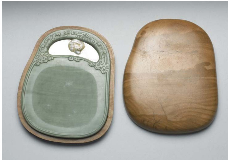
圖三 清 康熙 松花石山水紋硯 國立故宮博物院藏