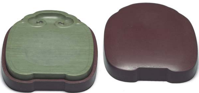
圖五 清 雍正 松花石如意首式硯 國立故宮博物院藏

款者五方，餘為無款者。（周南泉，〈松花石硯〉，《文物》一九八〇年第一期）因為不明了其文物編號，無法瞭解是否是清宮舊藏，若為清宮舊藏，也不知其原貯宮殿。 審視台北故宮所藏原貯于端凝殿的這四方雍正朝松花石硯，的確有中腰內縮的葫蘆（蒲盧）形狀之綠色有橫紋的松花石，點查號列四〇六（故文208）這件，其硯背中央凹下，正中位置陰刻篆書款：「雍正年製」，盒蓋取黃綠交疊的硯材巧雕而成，盒呈土黃色，並有深淺不同天然紋理：紋飾呈淡綠色，上半部巧雕瓜之藤蔓與二葉，下半部則雕一叢靈芝，二隻蝙蝠翔於其上方，寓意「萬代福」。