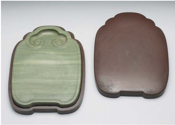
圖六 清 雍正 松花石如意首式硯 國立故宮博物院藏