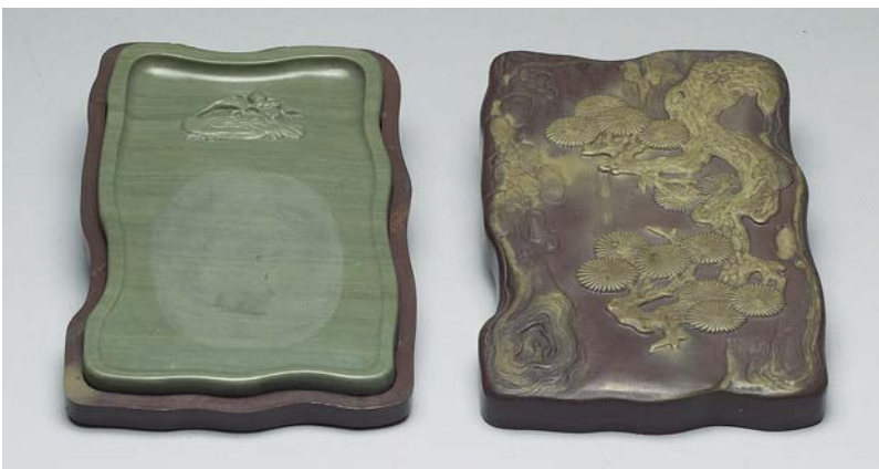
圖九 清 雍正 松花石松樹硯 國立故宮博物院藏

雕飾於蓋面右緣，盒身為紫色，紋飾呈黃綠色，蓋面淺浮雕一株垂松，自蓋面左上角向下方垂展，松幹皴鱗歷歷；不論器形之松幹或紋飾之松幹皆老辣多姿。硯匠另取一塊碧綠色石材，隨盒形雕琢出一不規則四方形硯，口形池下方浮雕一回首鵝，口銜