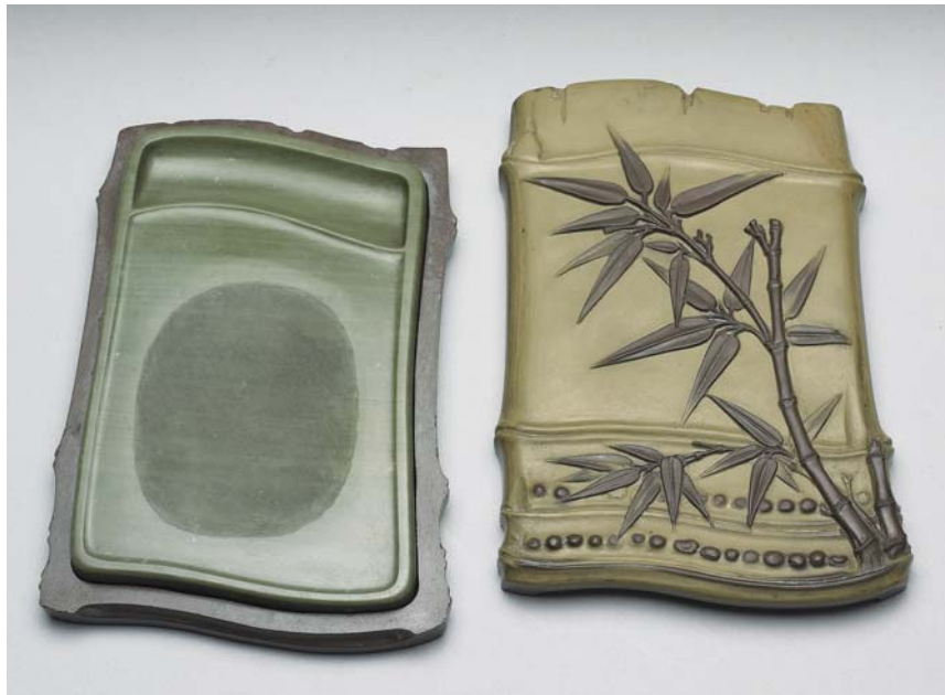
圖八 清 雍正 松花石竹節硯 國立故宮博物院藏