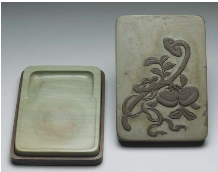
圖七 清 雍正 松花石事事如意硯 國立故宮博物院藏