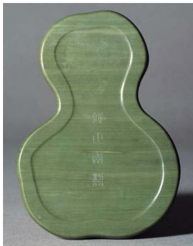
圖四 清 雍正 松花石壺盧硯 國立故宮博物院藏

款者五方，餘為無款者。（周南泉，〈松花石硯〉，《文物》一九八〇年第一期）因為不明了其文物編號，無法瞭解是否是清宮舊藏，若為清宮舊藏，也不知其原貯宮殿。 審視台北故宮所藏原貯于端凝殿的這四方雍正朝松花石硯，的確有中腰內縮的葫蘆（蒲盧）形狀之綠色有橫紋的松花石，點查號列四〇六（故文208）這件，其硯背中央凹下，正中位置陰刻篆書款：「雍正年製」，盒蓋取黃綠交疊的硯材巧雕而成，盒呈土黃色，並有深淺不同天然紋理：紋飾呈淡綠色，上半部巧雕瓜之藤蔓與二葉，下半部則雕一叢靈芝，二隻蝙蝠翔於其上方，寓意「萬代福」。