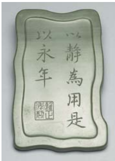
正年製」：盒蓋取紫色石材隨硯之外型雕成，蓋面光素無紋。(圖五、圖