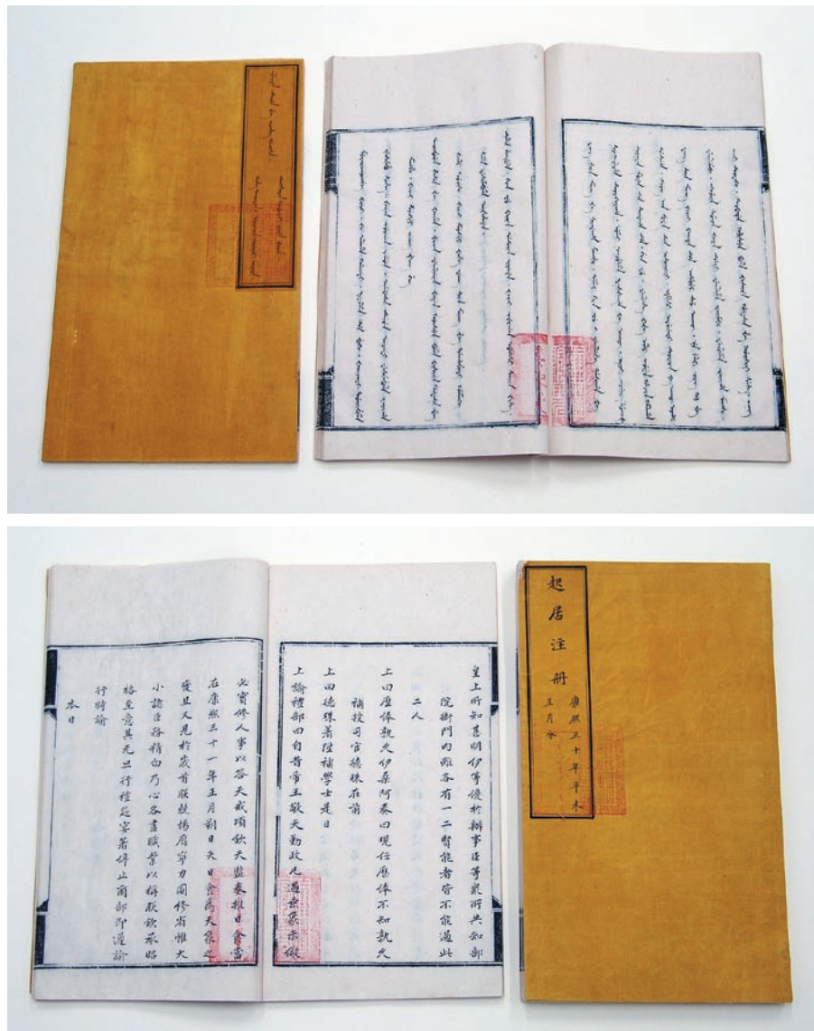
圖二 《康熙起居注冊》滿漢文本 國立故宮博物院藏