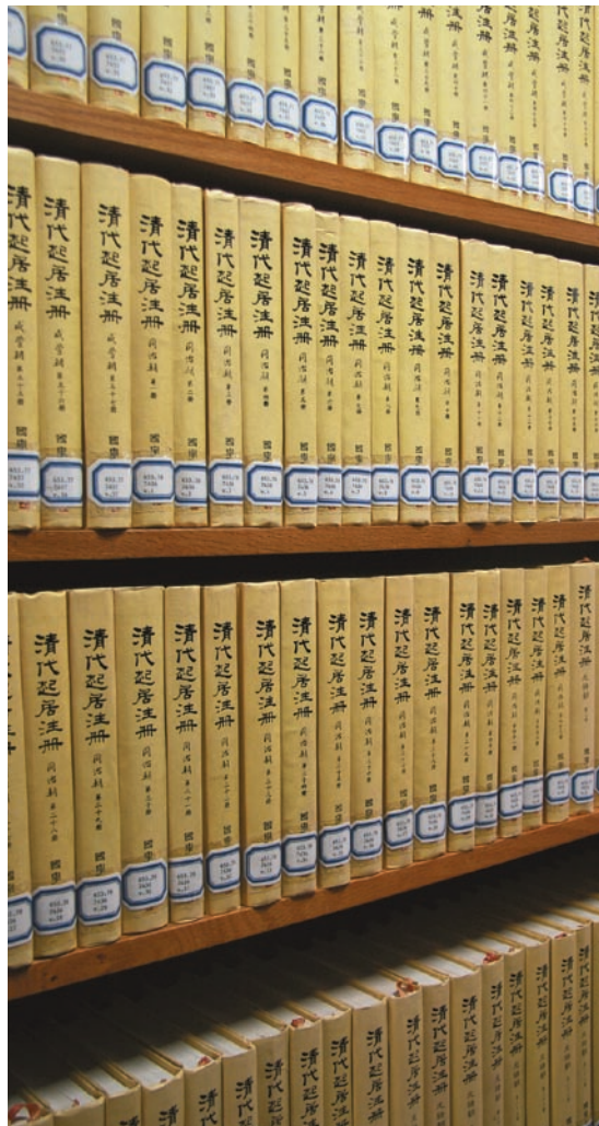
圖三-2 聯經出版事業公司發行之咸豐、同治、光緒《清代起居注冊》陳列在本院圖書館中。