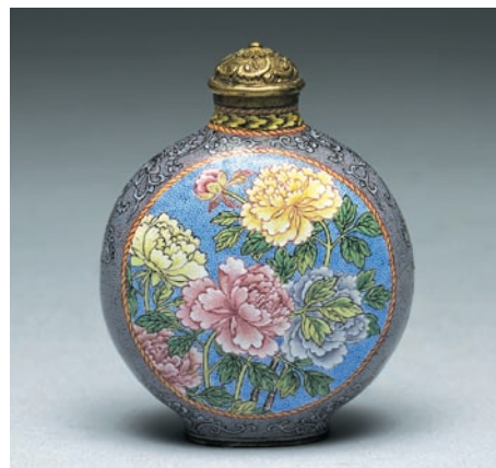
清 雍正 銅胎畫琺瑯菜地牡丹蓮荷紋鼻煙壺 高5.4公分 國立故宮博物院藏

雖然一個成功的導覽工作還需具備導覽技巧、對觀眾的掌握，而對展出文物的認識為基本的條件。因此，這次「雍正—清世宗文物大展」對志工的訓練安排也是從雍正皇帝各個面去規劃，以期志工能對雍正其人、其事有一深入認識。主講者除具專業深度的策展人外，亦邀請對雍正研究造詣深的學者、專家授課。課程安排如表一。此外，策展人亦為志工開列專書研讀。