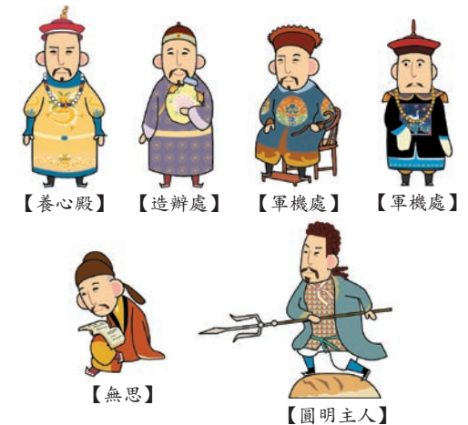
觀眾可透過多媒體互動桌呈現雍正於養心殿、軍機處、圓明園和造辦處等多處地點的相關影像與資料，並以雍正或大臣的肖像製作公仔，以驅動互動桌的內容(公仔底部黏貼辨識標識)。觀眾可藉由公仔回溯文物的原所在地、相關人物等歷史脈絡，以更多元的方式學習博物館典藏文物。例如，身著黃袍的雍正公仔可驅動養心殿的文物；身著西洋服飾的雍正公仔可驅動圓明園的文物等。