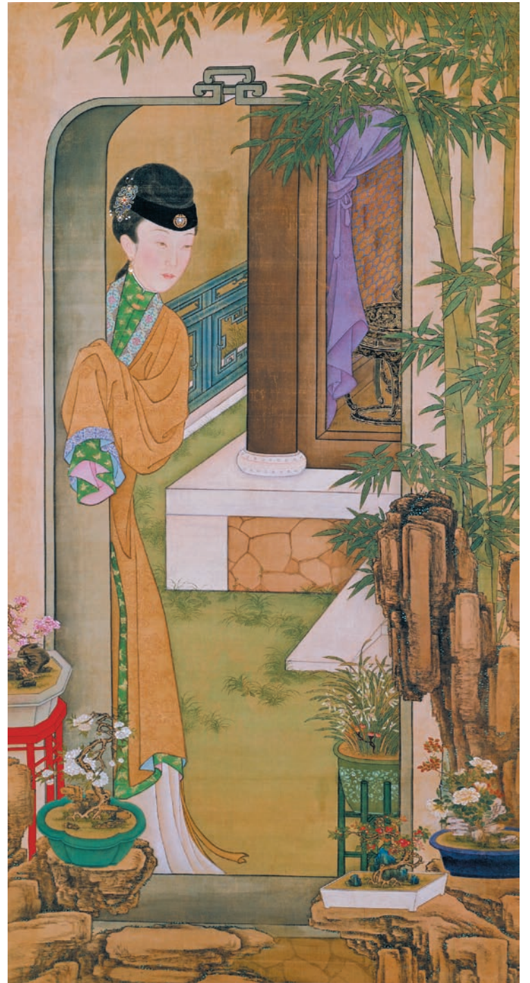
清 無款 美人圖·倚門 軸 絹本設色 縱184公分 橫98公分 北京故宮博物院藏

兒童在官能學習方式下，更能引起兒童的學習興趣，為讓兒童從體驗中獲得對雍正皇帝的認識，本院為七至十二歲的兒童及家長組成家庭團體特別設計親子教育活動。課程設計著重於動手做，針對本次展覽中的雍