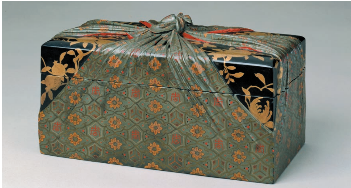
清 雍正 描金彩漆包袱式紋長方盒 高12.1公分 長22公分 寬11.5公分 北京故宮博物院藏