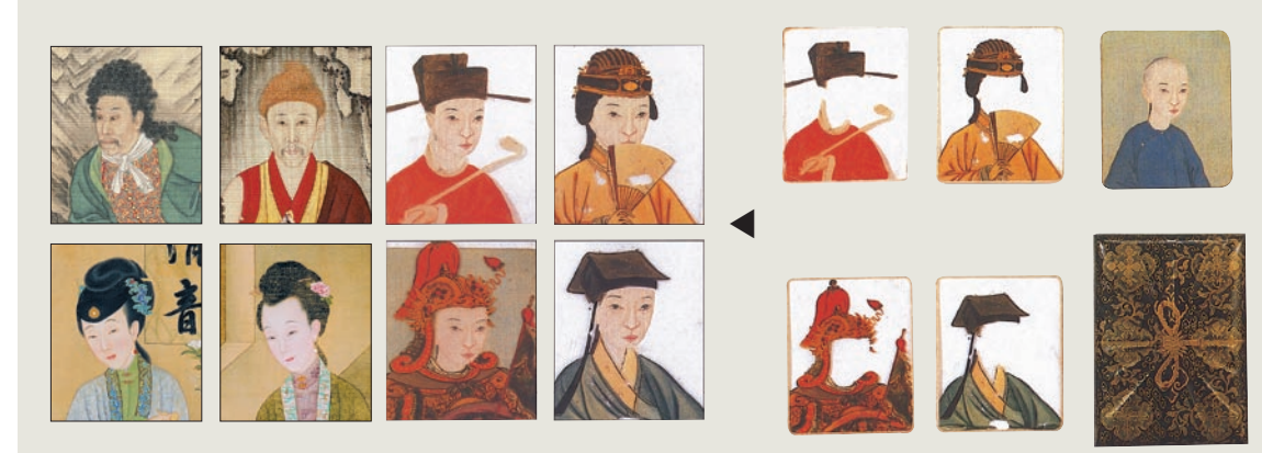
利用雍正畫像及美人圖，設計如洋畫片的方式，讓參加活動的兒童體驗cosplay(角色扮演)的樂趣並認識皇帝的日常生活。