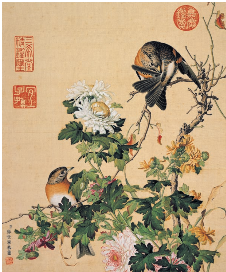
清 郎世寧 畫仙鶴長春 第十六開 冊 絹本設色 本幅共十六開 均為縱33.3公分 橫27.8公分 國立故宮博物院藏

正肖像及生活畫像，以及美人圖像，設計合成為學童的照片與畫像，讓兒童有如進入畫中，身歷其境地體驗宮中的生活，進而瞭解雍正皇帝平日生活情形。此類體驗式的教育活動的設計構想，首先藉華麗的雍正皇帝圖像引起兒童的注意力，在活動體驗過程中，建構他們對雍正皇帝的認知，在