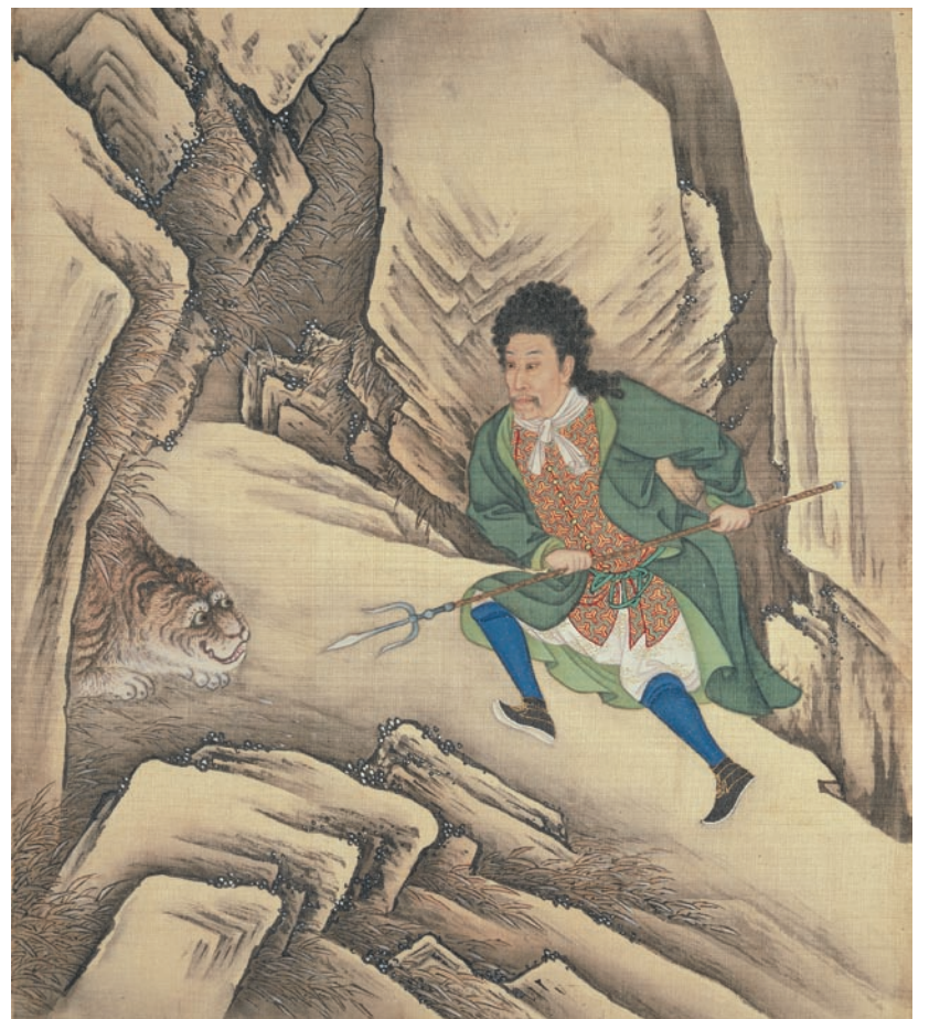
清 無款 胤禛行樂圖·刺虎 冊 絹本設色 縱34.9公分 橫31公分 北京故宮博物院藏

會於成立之初，即以成長團體型態方式帶領，為志工提供豐富多元的研習機會與環境，尤其對志工在各項展覽推出之前的訓練課程更兼及廣度深度的考量與設計。本院志工大多肩負本院導覽工作，他們都是本院陳列室內的教師。他們對文物知識的深度與廣