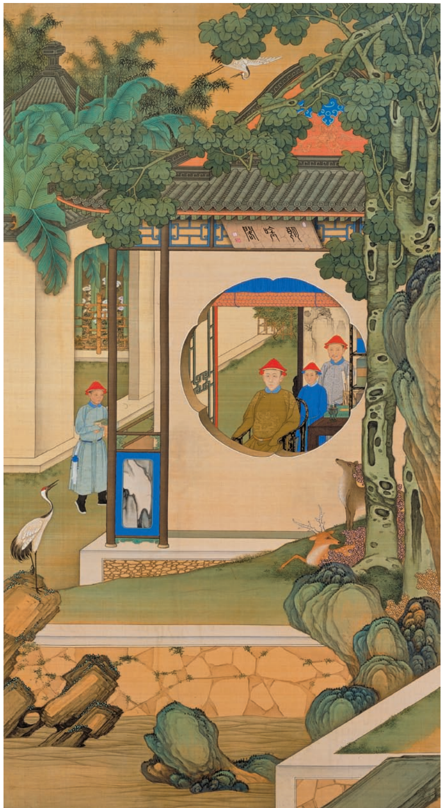
清 無款 胤禛朗吟閣圖軸 絹本設色 縱175.1公分 橫95.8公分 北京故宮博物院藏