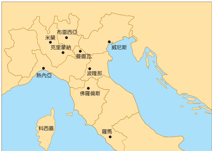
圖一 義大利北部地圖