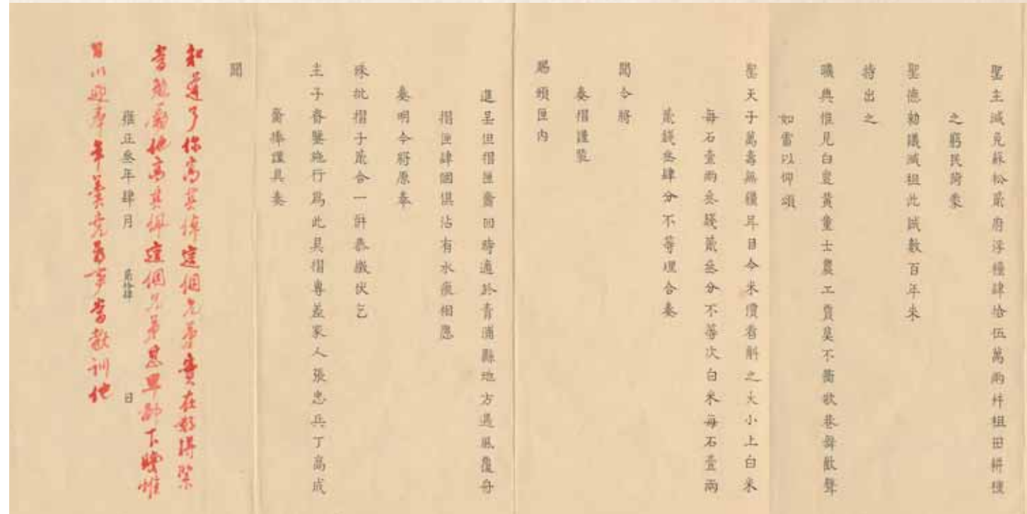
雍正三年四月二十四日 江南提督總兵高其位 奏謝頒賜摺匣並報蘇松沿海地方情形摺 國立故宮博物院藏

硃批:知道了。你高其倬這個兄弟,實在好得緊,當勉勵他。高其佩這個兄弟,甚卑鄙下賤,惟日以迎奉年羹堯為事,當教訓他。