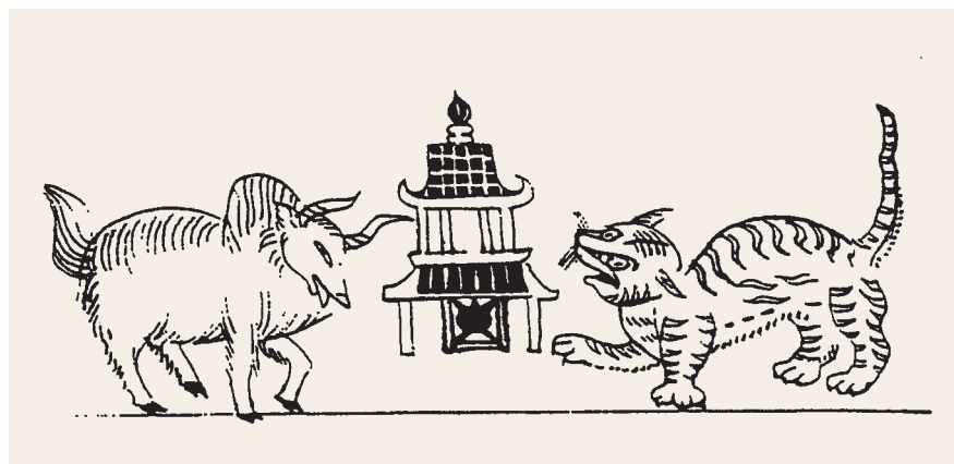
雲南納西族門神圖 曹振峰著《神虎鎮邪》北京 社會科學文獻出版社

雲貴地區的苗僮等少數民族篤信鬼神，當地儺文化的主要內容，就是逐鬼驅崇活動。國立故宮博物院典藏《職貢圖畫卷》中「廣順貴筑等處