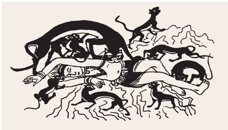
薩埵王子捨身飼虎圖 曹振峰著《神虎鎮邪》北京 社會科學文獻出版社