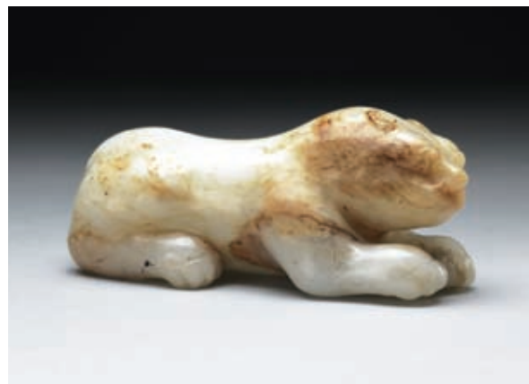
清 白玉虎 國立故宮博物院藏

演變而來，以虎爲圖騰的氏族，不僅以虎爲姓，也以虎爲名，自稱虎兒虎女，虎兒虎弟。永順土家族傳說他們的老祖宗是銅老虎、鐵老虎兩兄弟。《漢書·敘傳》記載，班氏祖先，與楚同姓，也是令尹子文的後裔。《春秋左氏傳》記載，楚若敖娶於邱，生鬥伯比。若敖卒後，鬥伯比從其母放牧於邱，與邱子之女私通，生子女。邱夫人派人將子文遺棄於雲夢澤中，有虎以乳餵食。邱子出獵看見，歸告