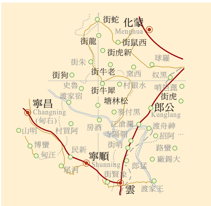
雲南順寧府虎街示意圖

目山，意即母虎山。瀘沽湖，古稱喇踏湖，意即虎王湖。哀牢山，意即大虎山。瀾滄江，意即虎跌入之江。上樂秋，意即上虎街村。下樂秋，意即下虎街村。羅甸，意即虎族居住的地方。土家語「巴」，意即虎，巴山，意即虎山。以虎為人和地命名，其用意是為求得虎祖庇護，子孫繁衍，