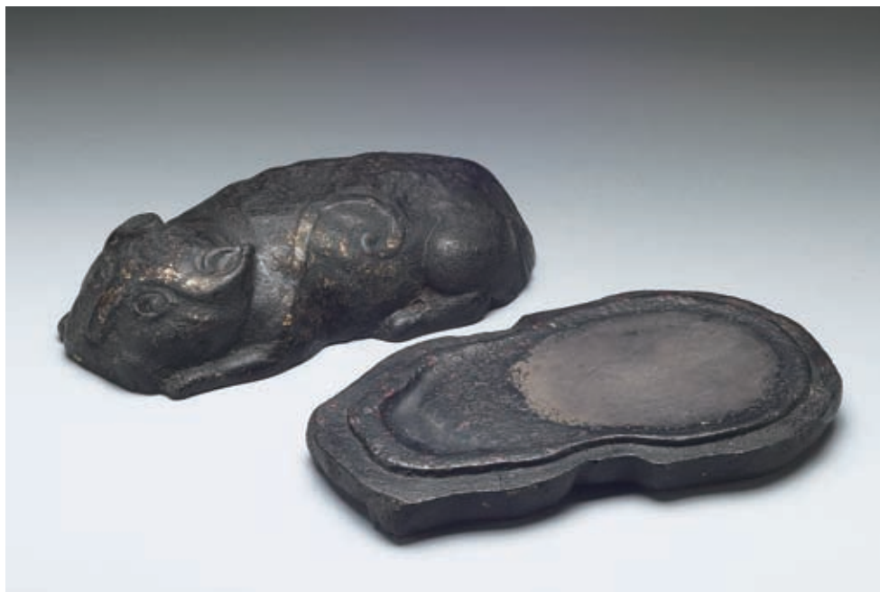
宋 澄泥虎符硯 國立故宮博物院藏

統一的圖騰具有維繫和鞏固氏族部落的作用。古代巴郡南部蠻本有巴氏、樊氏、譚氏、相氏、鄭氏五姓。巴氏首領務相爲廩君後，確立了以白虎爲巴郡五姓的共同圖騰。他們相信人與圖騰可以互相轉化。《後漢書·南蠻西南夷列傳》記載，「廩君死，魂魄世爲白虎。」《虎薈》一書也記載，「雲南蠻人呼虎爲羅羅，老則化爲虎。」哀牢山彝族巫師認爲他們是虎變的，如果不火葬，靈魂就不能還原爲虎。土家族是古代巴郡白虎氏族的後裔，以白虎爲圖騰。在土家族地區到處可以聽到白虎氏族祖先的神話傳說。其中虎兒娃的傳說就是虎與人結親生下半人半虎形象的孩子，既有人人的智慧，又有虎的勇猛。後來他斬妖除魔，救出公主，與公主成親繁衍了土家族。當地還有天上白虎星君化成白虎幫助土家族姑娘牧羊，趕走豺狗，到了夜晚白虎變成了英俊青年，與土家姑娘成親生下了七男七女，他們都以虎爲姓，表示他們是白虎的後