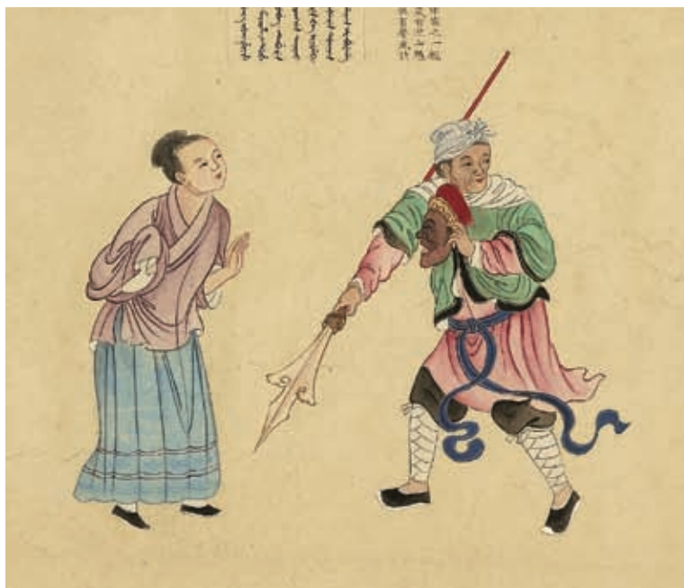
貴州廣順貴筑等處土人圖像 國立故宮博物院藏 職貢圖畫卷局部

式，虎在儺文化中扮演著重要的角色。《後漢書·禮儀》記載，「上古之時，有神荼與鬱壘兄弟二人，性能執鬼。」傳說神荼和鬱壘是兩尊門神，古人畫鬱壘持葦索，以御凶鬼；畫虎於門，使之食鬼，神虎鎮宅，就是常見的民間信仰。