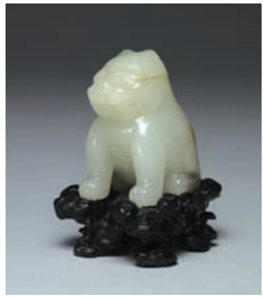
清 白玉虎 國立故宮博物院藏

這種觀念出發，便產生了本氏族圖騰的各種禁忌。譬如虎氏族的成員就嚴禁獵捕老虎，或傷害老虎。倘若捕食虎肉，就等於捕食自己的祖先。《魏書》記載，鄴城有石虎廟，北魏孝文帝太和二十年（四九六）五月，南安王楨以早祈雨於石虎廟。南安王楨告虎神像云：「三日不雨，當加鞭一百。因傷害神像，對虎神不敬，觸犯禁忌，南安王楨竟在同年五月間疽發背而身故。虎圖騰信仰，具有社會教化功能，衆生都是過客，人和虎共生，敬虎、愛虎，維護生態平衡，就是虎圖騰崇拜的原始意義。」 作者為本院圖書文獻處退休同仁