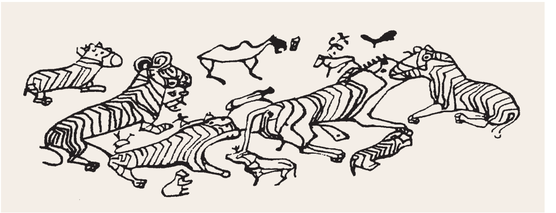
陰山岩畫：巴爾溝群虎圖 曹振峰著《神虎鎮邪》北京 社會科學文獻出版社

這種觀念出發，便產生了本氏族圖騰的各種禁忌。譬如虎氏族的成員就嚴禁獵捕老虎，或傷害老虎。倘若捕食虎肉，就等於捕食自己的祖先。《魏書》記載，鄴城有石虎廟，北魏孝文帝太和二十年（四九六）五月，南安王楨以早祈雨於石虎廟。南安王楨告虎神像云：「三日不雨，當加鞭一百。因傷害神像，對虎神不敬，觸犯禁忌，南安王楨竟在同年五月間疽發背而身故。虎圖騰信仰，具有社會教化功能，衆生都是過客，人和虎共生，敬虎、愛虎，維護生態平衡，就是虎圖騰崇拜的原始意義。」 作者為本院圖書文獻處退休同仁