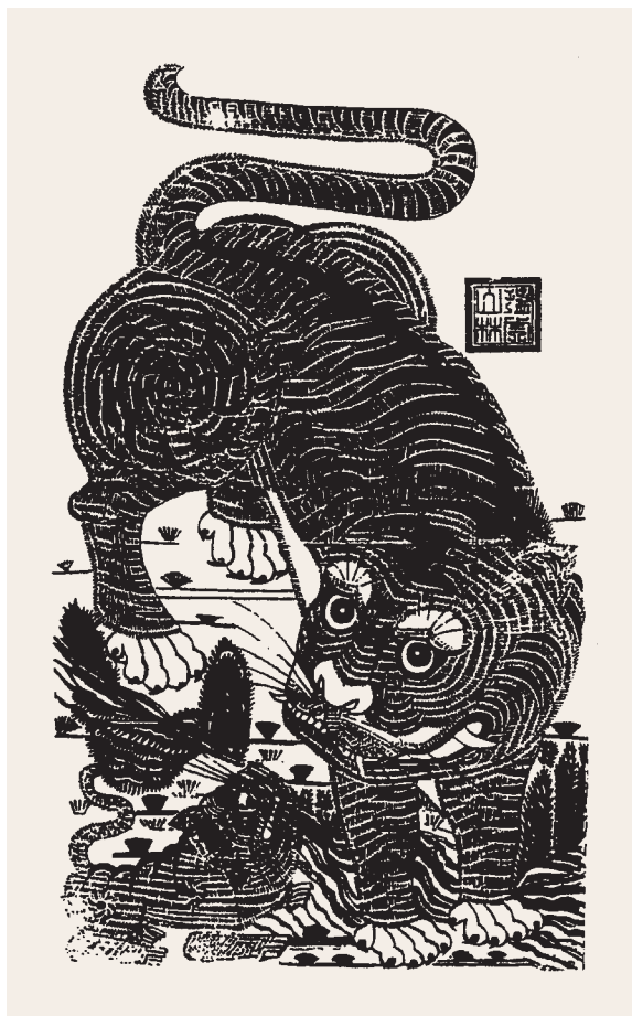
山東濰縣神虎鎮宅圖 陶思炎著《中國鎮物》臺北 東大圖書公司

式，虎在儺文化中扮演著重要的角色。《後漢書·禮儀》記載，「上古之時，有神荼與鬱壘兄弟二人，性能執鬼。」傳說神荼和鬱壘是兩尊門神，古人畫鬱壘持葦索，以御凶鬼；畫虎於門，使之食鬼，神虎鎮宅，就是常見的民間信仰。