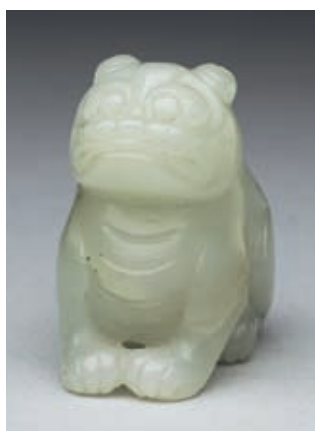
清 青玉虎 國立故宮博物院藏