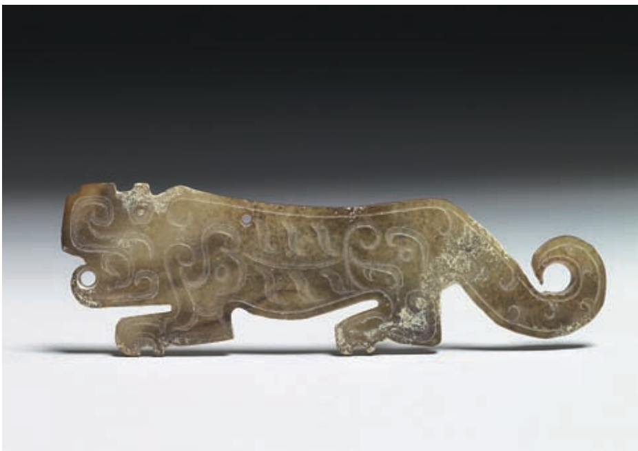
春秋 虎形玉佩 國立故宮博物院藏

作爲氏族名稱。以虎爲圖騰的納西族，就以虎爲姓。虎，納西語亦讀如「喇」或「拉」。寧浪、永寧土司、四川左所土所喇他、喇俄、喇秋等，都