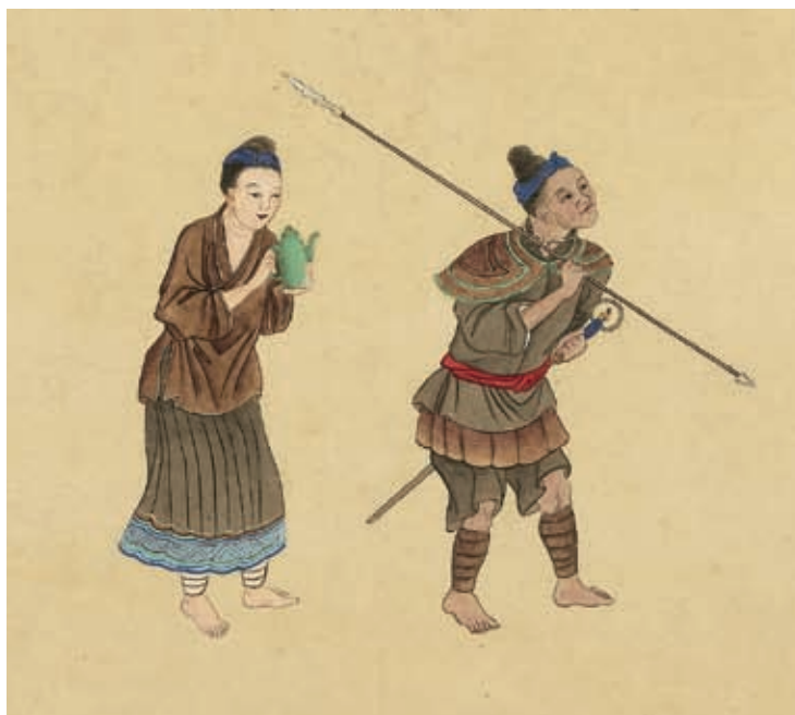
貴州都勻平越等處紫薑苗圖 國立故宮博物院藏 職貢圖畫卷局部

目山，意即母虎山。瀘沽湖，古稱喇踏湖，意即虎王湖。哀牢山，意即大虎山。瀾滄江，意即虎跌入之江。上樂秋，意即上虎街村。下樂秋，意即下虎街村。羅甸，意即虎族居住的地方。土家語「巴」，意即虎，巴山，意即虎山。以虎為人和地命名，其用意是為求得虎祖庇護，子孫繁衍，