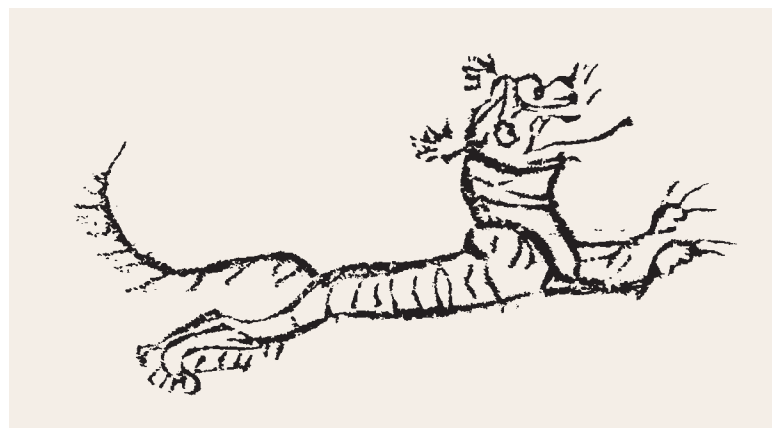
漢 狩獵紋畫像磚上的獵虎紋 國立故宮博物院藏

因生賜姓，同姓不婚，源自圖騰族外婚，姓就是由圖騰名稱演變而來。彝語「羅」意思是虎，羅與臘或喇，同音異譯。彝族舊稱「羅羅」，是羅的疊音，虎就是彝族共同崇拜的圖騰，說明彝族曾經以虎圖騰