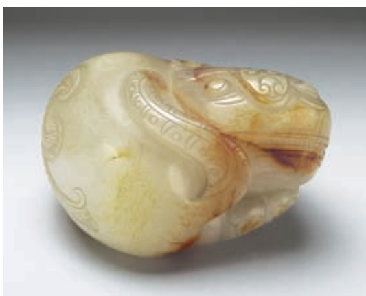
明 白玉虎 國立故宮博物院藏