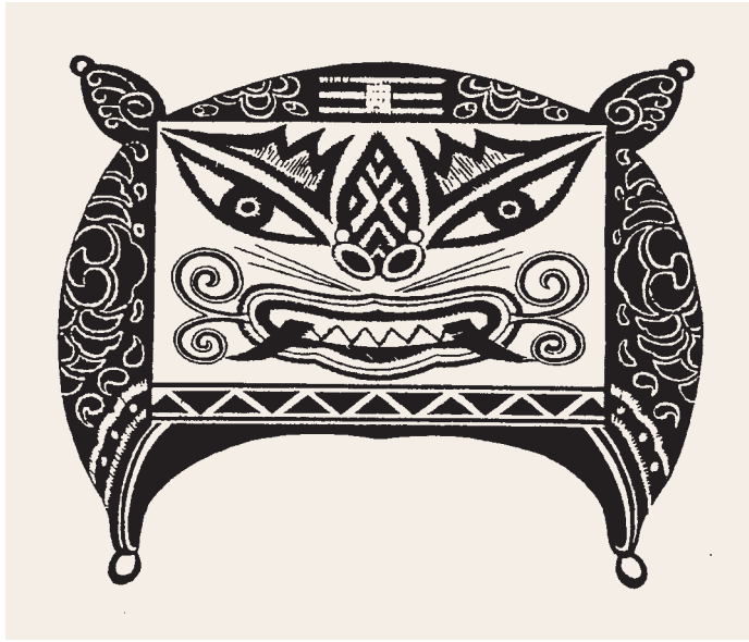
雲南鶴慶白族繡花虎頭帽 曹振峰著《神虎鎮邪》北京 社會科學文獻出版社

雲南納西族、普米族也認為虎年是吉利的年分，虎日是吉祥的日子，他們以虎年或虎日出生的嬰兒為貴，相信虎年或虎日出生的嬰兒是虎子虎孫，一身虎相，虎虎有生氣，平安長大。以虎為圖騰的白族相信在虎日出辦事，一切順利。他們選在虎日出遠門，相信在外面才有威風，可以吉利地出去，平安地回來。從遠方回來的