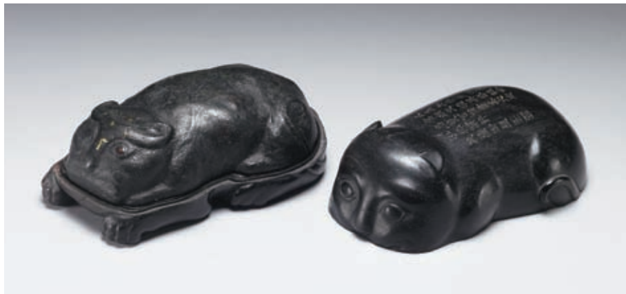
宋 澄泥虎符硯 國立故宮博物院藏

家人，也要選在虎日進家門。虎圖騰崇拜在雲貴等地區少數民族社會中已經成為根深柢固的民俗信仰。 從氏族圖騰能夠保護氏族成員