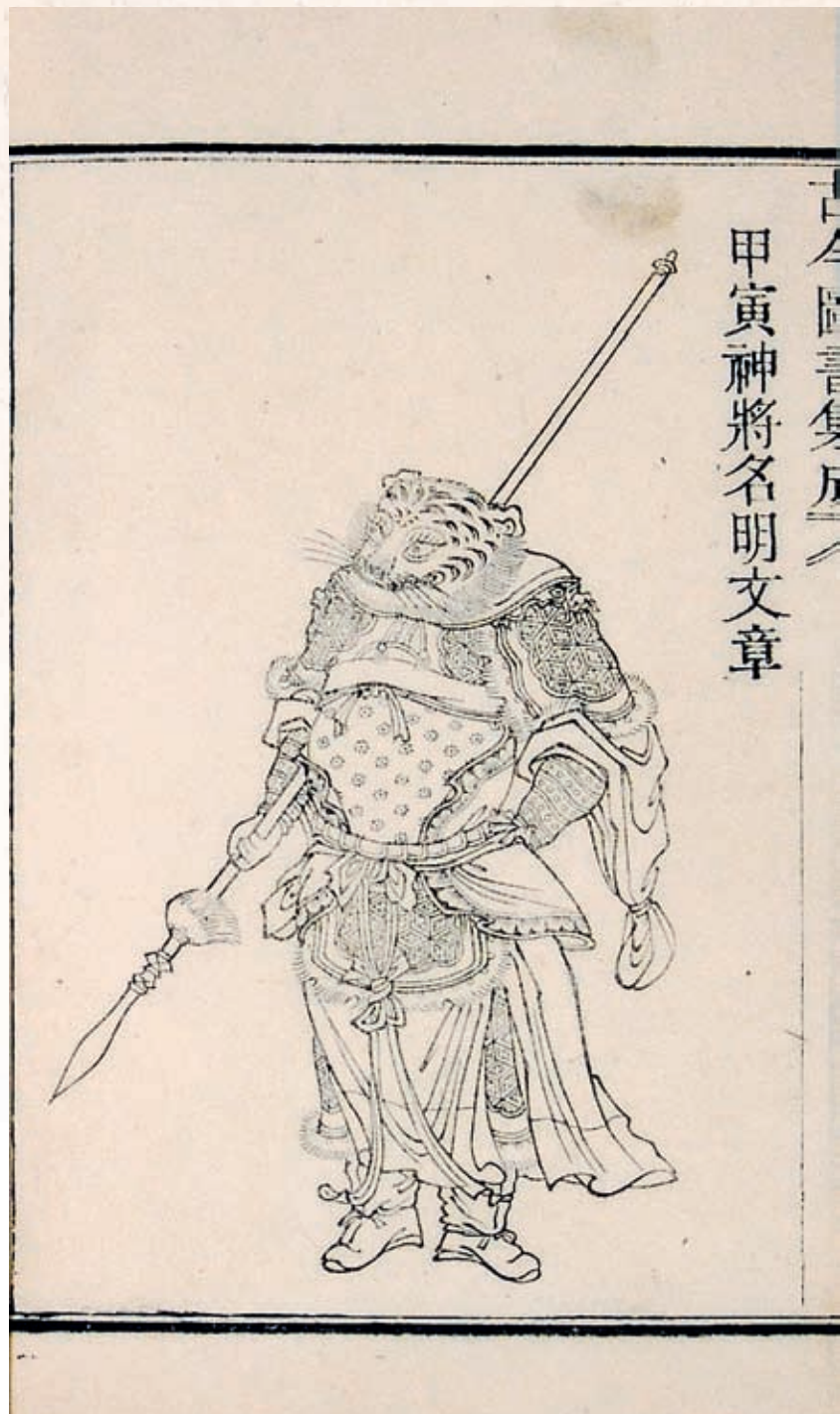
圖三 《古今圖書集成·神異典》 十二月將圖—甲寅神將 清雍正四年武英殿銅活字本 國立故宮博物院藏

篇」中記載一些民間有趣的說法和觀念，例如：老虎吃了狗肉，就會像喝醉酒一般，所以狗肉可說是老虎的酒。又有一則是說因為小孩不懂事，不怕老虎，所以老虎不吃小孩；還有老虎也不吃酒醉的人，一定要等到酒