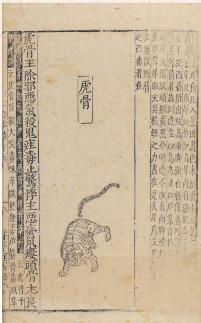
圖六 《經史證類大正本》 醫書中的虎骨以一整頭老虎的形象來表示 明萬曆五年南陵王秋尚義堂刊三十八年修補本 國立故宮博物院藏

最佳。老虎眼睛則可治療癩癩。可見老虎在中醫上對於恢復氣力、治療癩邪有特定功效。但是虎骨、虎睛或其他部位要成為藥材入藥前還必須經過事前準備手續，不是直接就可以使用的，例如：虎骨要先除去筋肉，烤過後再研成細粉使用；而虎睛需先浸羊血，洗淨後以小火烘焙再研磨成粉。