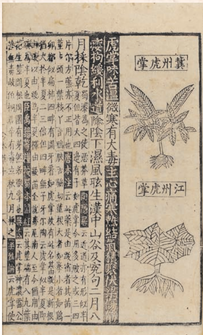
圖七 《經史證類大正本》 冀州虎掌和江州虎掌 明萬曆五年南陵王秋尚義堂刊三十八年修補本 國立故宮博物院藏

除，以「白虎」為名乃是取此藥方去熱效果極佳，有如同白虎的動作快速猛烈一般的意義存在。 而在《經史證類大正本》中介紹到了「冀州虎掌」和「江州虎掌」（圖七）。虎掌是中藥方中一味常見藥草，並非真的是用「老虎的手掌」，乃是草本植物，又稱天南星，因其葉脈近似虎掌而得名。根據《本