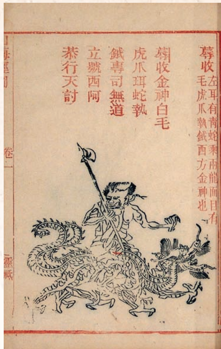
圖四 《山海經圖》 白虎神獸壽收 清光緒十四年掃葉山房刊朱墨套印本 國立故宮博物院藏