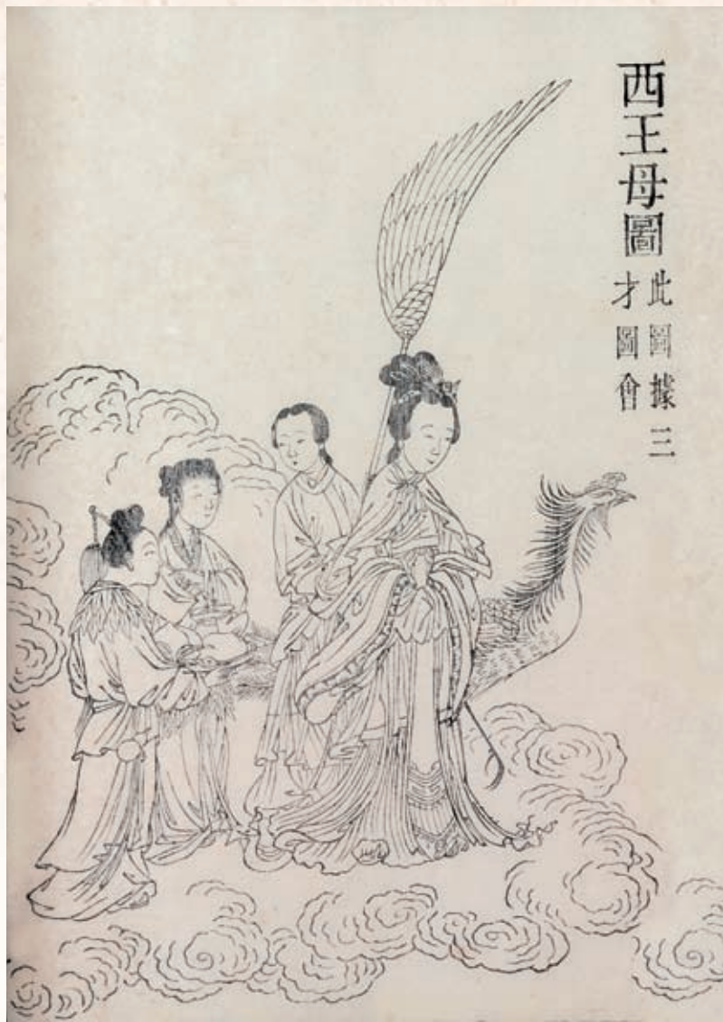
圖二 《古今圖書集成·神異典》 西王母的美女形象 清雍正四年武英殿銅活字本 國立故宮博物院藏