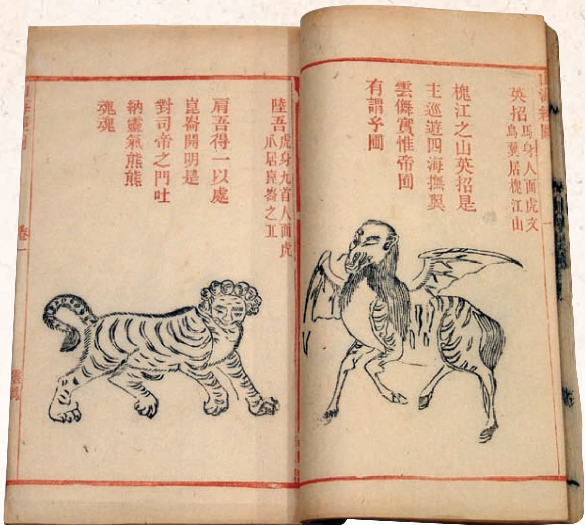
圖一 《山海經圖》 神獸英招和陸吾 光緒十四年掃葉山房刊朱墨套印本 國立故宮博物院藏

老虎除了為十二生肖的一員（圖三），也被視為傳達訊息的信使，在《廣博物志》中便記載白虎是西王母的使者，被派遣獻地圖給黃帝。老虎在道教中也扮演著人間和天界聯絡