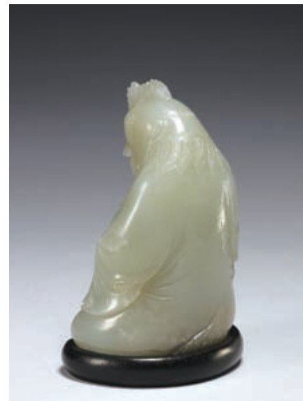
圖十五 清 乾隆 玉雞（背部） 國立故宮博物院藏

期登載之〈御筆—皇帝的硃批〉一文中，何傳馨先生就硃批所見，簡短的評述了清代各個皇帝的書法。關於嘉慶皇帝，何先生從其硃批的行草看來，「與父親乾隆帝相似，也是光圓