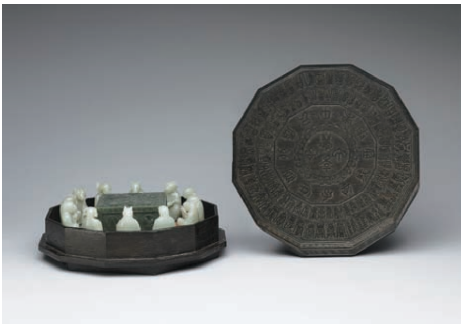
圖一 清 乾隆 紫檀「萬年甲子」多寶盒 國立故宮博物院藏

帝排遣心情之作。原來當時已歷經 二十年的「平大小金川之亂」，在高 宗的心裡已是接近「大功將成」的階 段，他因而「盼捷益切，寢食爲之不 安」，所以作此詩「聊以自遣」。到