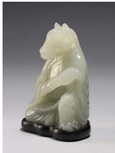
圖九 清 乾隆 玉馬 國立故宮博物院藏