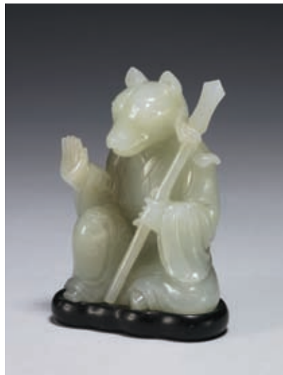
圖十三 清 乾隆 玉狗 國立故宮博物院藏