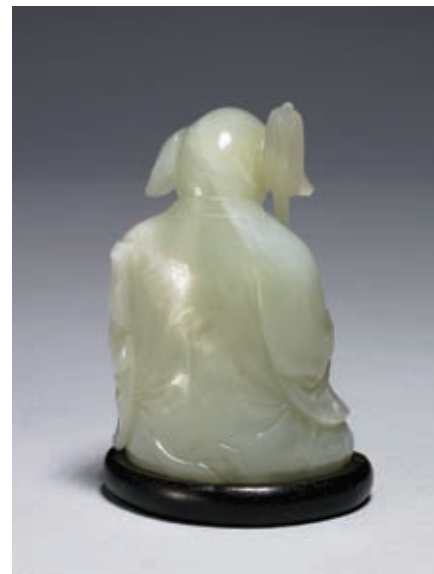
圖十六 清 乾隆 玉豬（背部） 國立故宮博物院藏