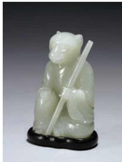
圖十一 清 乾隆 玉猴 國立故宮博物院藏