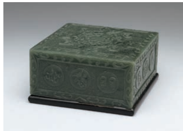
圖十七 清 乾隆 玉盒 國立故宮博物院藏

帝王儘管一家天下，但是大臣取悅天子最直接的方式，仍然不外是趁逢年過節、萬壽慶典或外出南巡時進貢獻禮。然而，進獻絕對是門學問，除了必須充分掌握皇帝的喜好，物件的價值要符合進獻者的身份，不寒酸也不過於誇富僭越，才能達到效果。進獻「萬年甲子」多寶盒的是全德。一般而言，根據〈內務府造辦處各成作活計清檔〉的資料，總是能得到相當清楚而確定的時間點。不過前引「匣棧作」的記錄，出現於乾隆二十年，卻是非常明顯的錯置。而從檔案中其他資訊推測，這應該是乾隆