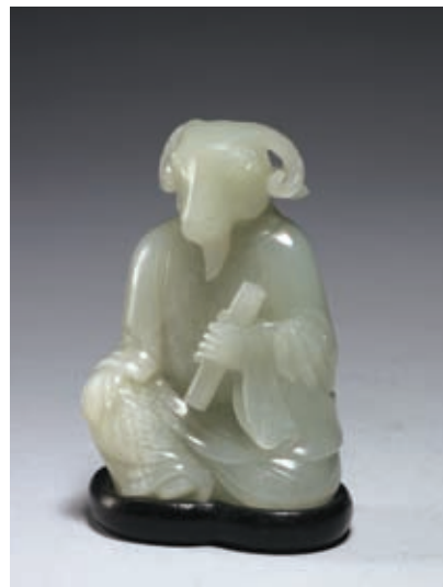
圖十 清 乾隆 玉羊 國立故宮博物院藏