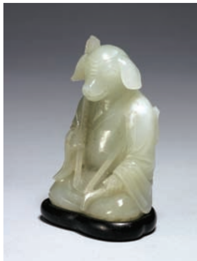
圖十四 清 乾隆 玉豬 國立故宮博物院藏