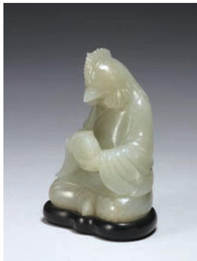
圖十二 清 乾隆 玉雞 國立故宮博物院藏

除了蛇之外，大都將手足露於外，強調其人類的軀體。但再仔細觀看背部，它們仍保留著動物的尾巴。(圖十五)這些尾巴本來皆可以被遮掩，但是，卻因為衣褶被略掀起而露了出來，(圖十六)所以應該是刻意要顯現。 青玉十二生肖像圍繞著木盒中心的一只碧玉方盒。此盒的蓋面中央為乾卦，雙龍左右護持之，外圍則一圓環，環外再飾四花瓣及螭虎相間的紋樣，內填雲紋地。蓋外壁琢黼黻十二章紋。(圖十七)玉盒中則置十五阿哥顯琿抄錄清高宗御製〈效仇遠十二辰體詠金川事解悶〉詩及詩註而成的「撫辰經緯」冊。本刊二六四