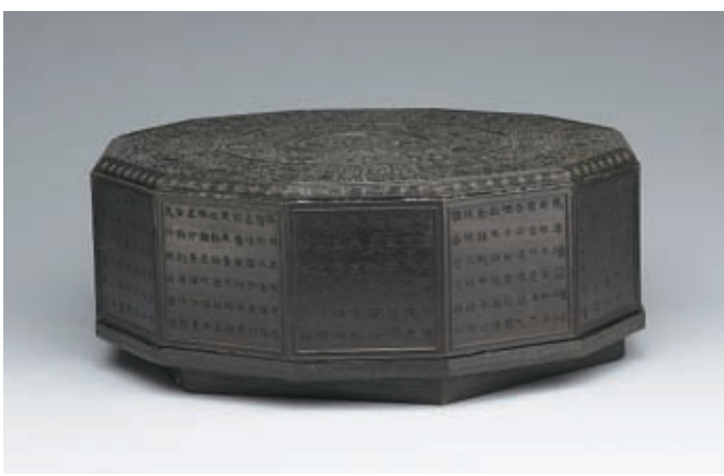
圖二 清 乾隆 紫檀「萬年甲子」多寶盒 國立故宮博物院藏