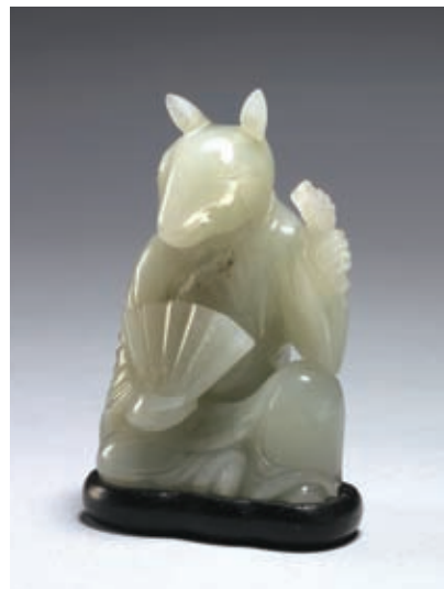
圖六 清 乾隆 玉兔 國立故宮博物院藏