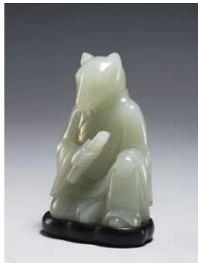
圖三 清 乾隆 玉鼠 國立故宮博物院藏