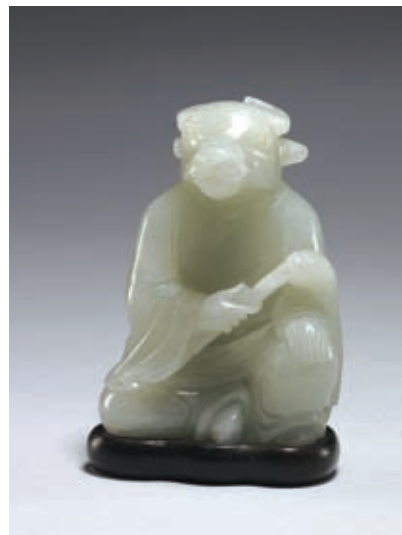
圖四 清 乾隆 玉牛 國立故宮博物院藏