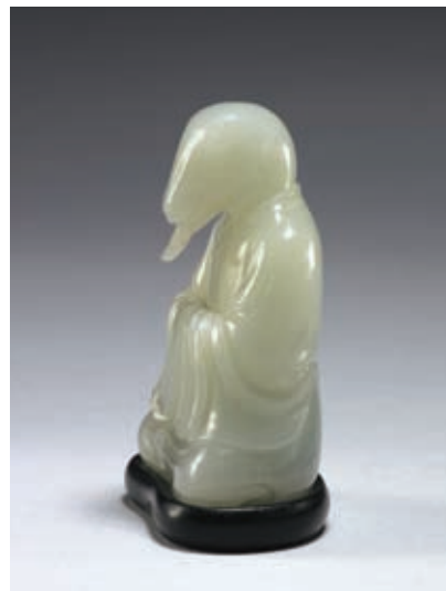
圖八 清 乾隆 玉蛇 國立故宮博物院藏