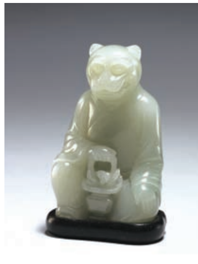
圖五 清 乾隆 玉虎 國立故宮博物院藏