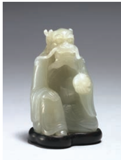
圖七 清 乾隆 玉龍 國立故宮博物院藏