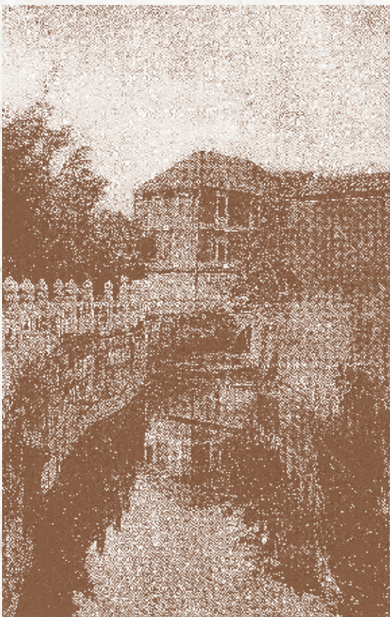
古物陳列所文物庫房—寶繩樓

民國二十六年（一九三七），抗日戰爭正式啓動，文物轉徙西南大後方。戰後復員，政府於民國三十七年（一九四八）將古物陳列所原留存北平的文物及所轄館舍歸於故宮博物院，此外並將其南遷文物全數撥交中央博物院籌備處。古物陳列所也就正式結束。民國五十四年（一九六五），國立故宮博物院與中央博物院籌備處合併，古物陳列所南遷精品亦多入藏故宮。