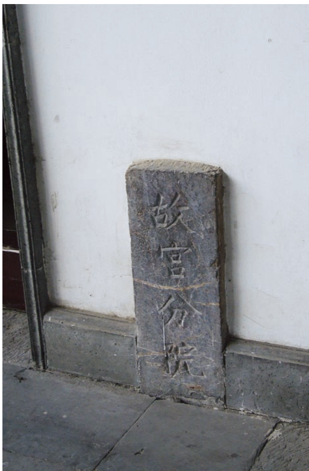
南京「故宮分院」石碑現存江蘇省崑劇院。

並將這趟旅程定名為「溫故知新」。 兩岸故宮自去歲二月達成九項共識以來，各項合作積極推展。「溫故知新—重走文物南遷路」考察活動，是繼「雍正—清世宗文物大展」與「兩岸故宮第一屆學術研討會：為君難—雍正帝其人其事及其時代」後，兩院又一開創性合作，共同回顧一段有特殊意義的歷史。從博物館專業角度來看，很少有博物館有此經歷，參與活動者可藉此體會前人精神，進行文字和影像紀錄，以供後人研究。 「溫故知新—重走文物南遷路」自六月三日在南京會合、出發，前後十六天，至六月十八日在成都結束，路線設計主要考量有四： (一) 文物南遷過程中重要事件發生地； (二) 當地是否仍保存有文物南遷痕跡； (三) 參與過文物維護的當地人是否健在； (四) 是否有文物南遷檔案遺存等。 考察方式有三：