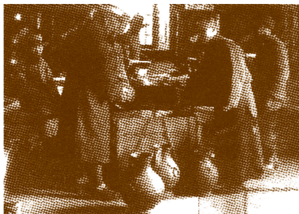
紫禁城中職工正忙著將文物裝箱預備南遷