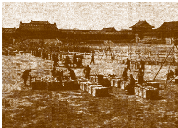
文物箱件啓運南遷景像

物，又歷盡艱辛於民國三十六年悉數安然運回南京分院。 這趟長達十多年為捍衛文物的浩大搬運工程，發生在物資貧乏、交通不便、遍地烽火之亂世，不僅是件叫人肅然起敬的事，更是寰宇文博界絕無僅有的經歷。被搬運保護免於戰火摧毀與敵寇掠奪的文物，至今仍妥善保存在兩岸故宮、南京博物院、北京國家圖書館及中國第一歷史檔案館（案：北京故宮博物院典藏的善本舊籍多已移撥北京