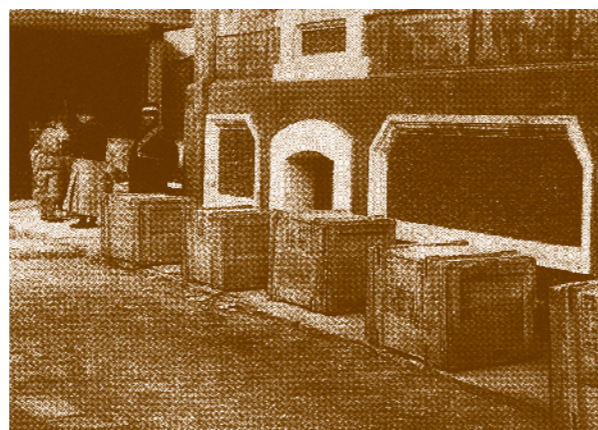
文物箱件啓運南遷景像