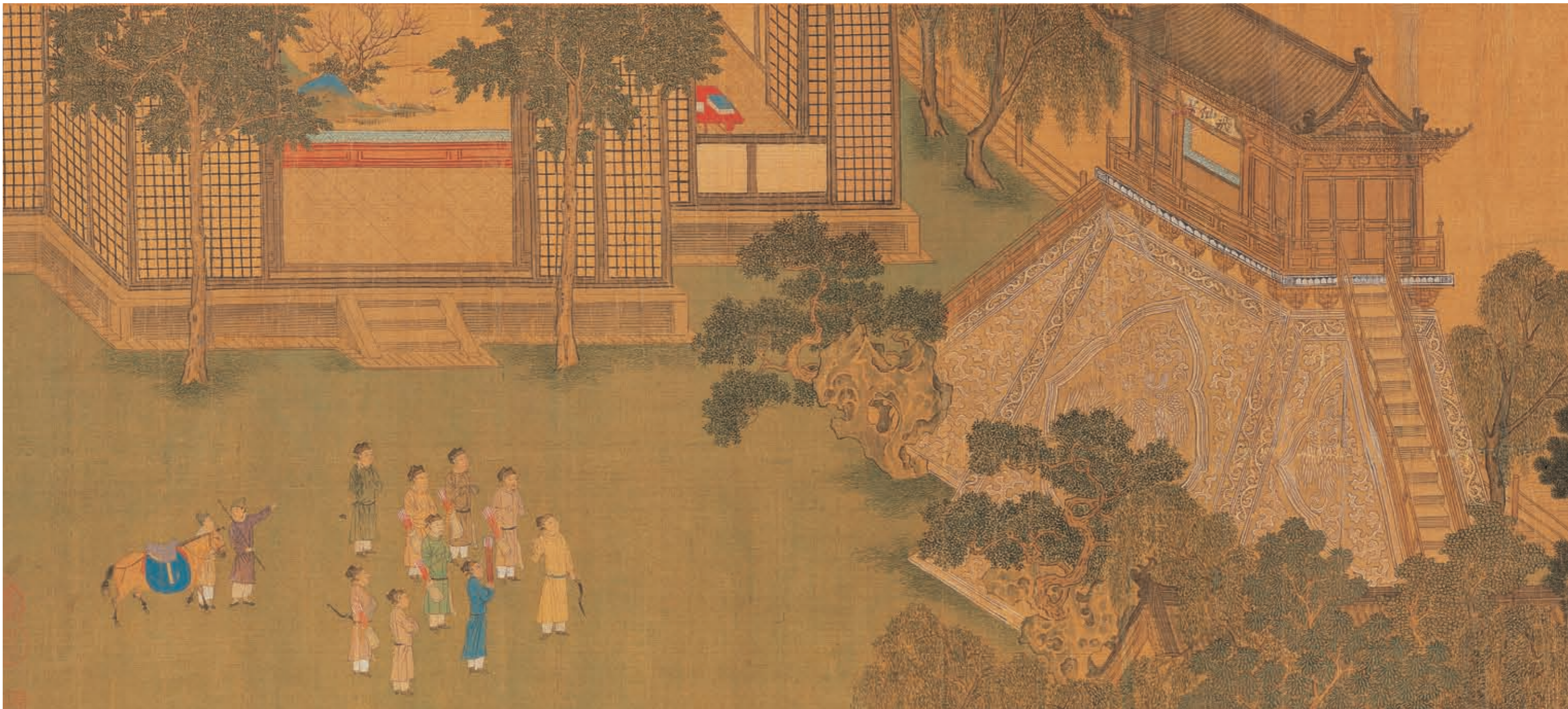
《瑞應圖》〈射中臺榜〉描繪康王抬頭望飛仙臺匾額所射中的三箭，眾人前方身穿黃衣手持弓的便是康王。

渡過黃河。十六日五更，康王從元水鎮啓程，抵達一座村莊。不久，村民來說：附近有三名金軍騎兵來詢問康王軍那一天抵達，村民說已經通過數日，金軍說打探失誤，然後離去。康王便上馬繼續行進，是日下午安全抵達北京大名。