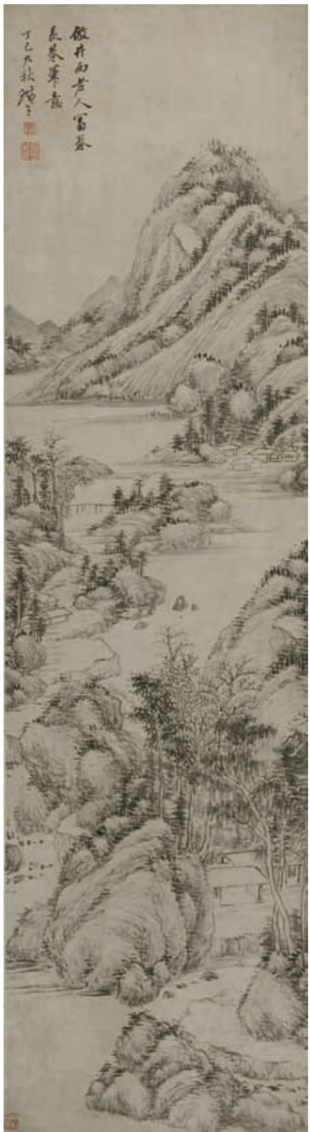
清 奚岡 墨筆山水 軸 浙江省博物館藏

龕、蝶野子，別號鶴渚生、蒙泉外史、蒙道人、蘿龕外史、散木居士、鶴渚散人、冬花庵主等。錢塘（今浙江杭州）布衣。詩書畫印皆善，是清朝著名篆刻家、畫家。在印學上，他造詣頗為精深，與丁敬、黃易、錢松等人合稱「西泠八家」，在中國印學史上佔有重要的地位。有《冬花庵燼餘稿》傳世。奚岡在乾嘉間極有聲譽，其山水畫的影響甚至遠播海外。《清稗類鈔》言「乾隆時，琉球人嘗以餅金購之。」他曾取徑婁東，學習元人畫法，上溯董巨，又對沈周、文徵明、李流芳等歷代名家的遺跡心摹手追，用功很深。他的山水風格多為