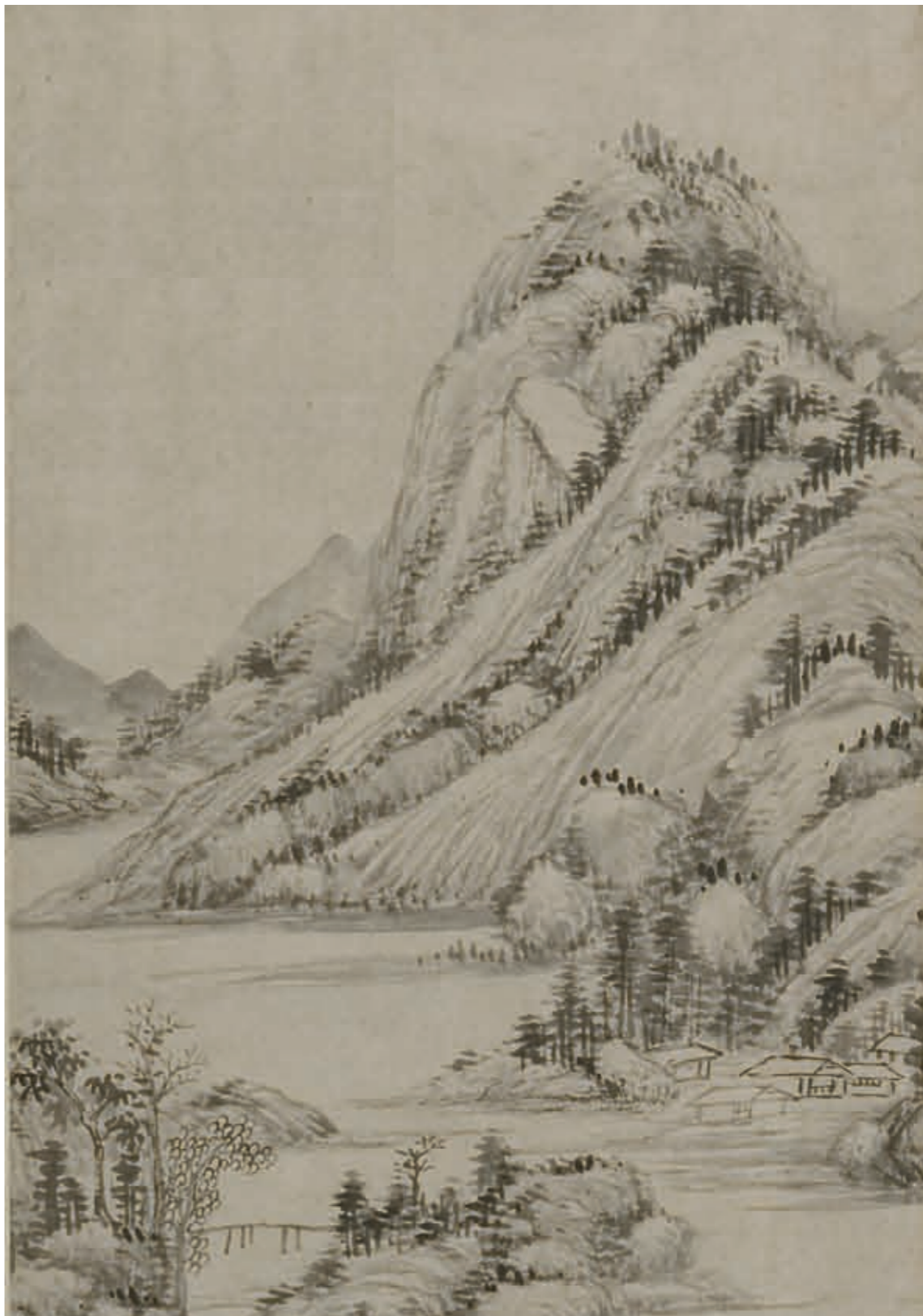
遠景山勢漸高，樹木在山脊坡石間依勢而生，更遠處的山巒僅以淡墨渲染，給人以山峰連綿不斷的遐想。