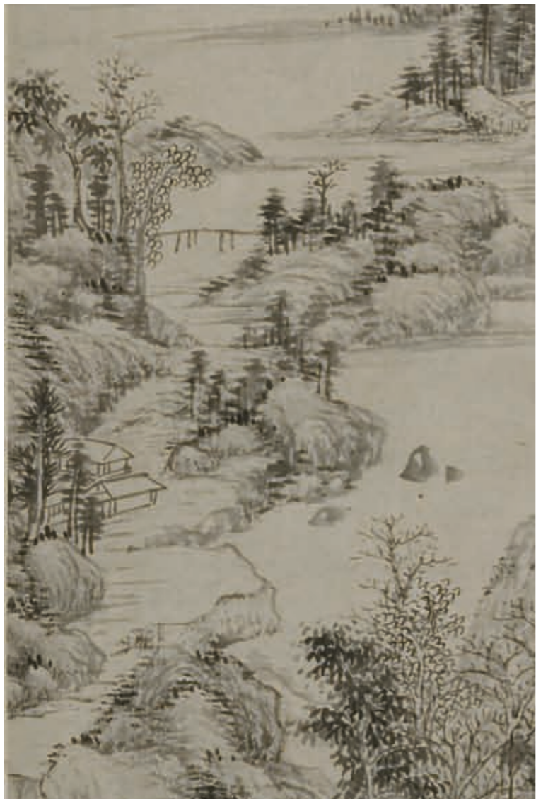
溪流中有三四碎石，借助碎石便把水聲潺潺寫出，化虛為實。