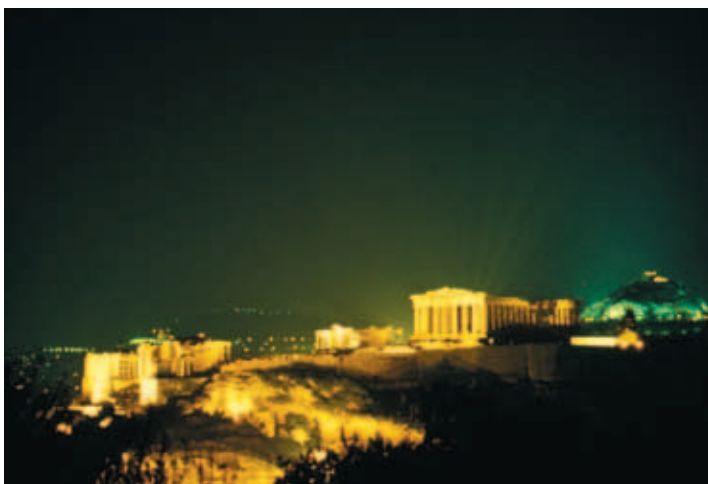
雅典衛城 (Acropolis) 帕特農神殿