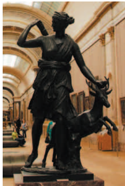
羅浮宮大藝廊 (Grande Galerie) 中的〈凡爾賽的黛安娜娜〉是大理石原作在十八世紀的青銅翻鑄品