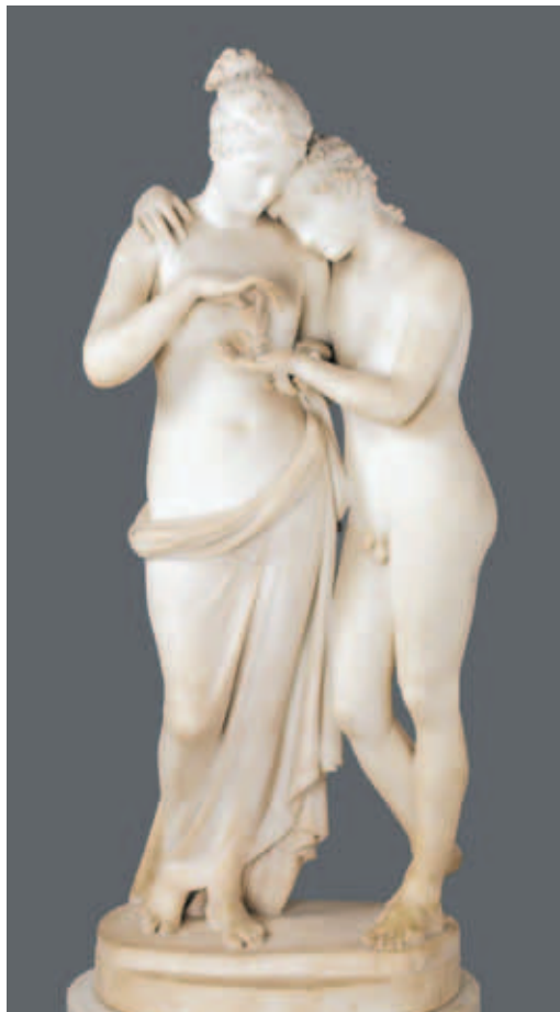
《愛神與賽姬》 卡諾瓦 約1797 卡拉拉大理石 高1.451公尺 寬0.85公尺 長0.58公尺 巴黎羅浮宮博物館藏