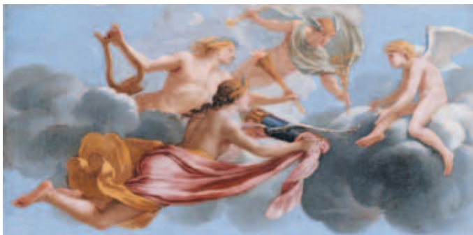
《愛神領受黛安娜、阿波羅和麥丘爾的致敬》 勒蘇厄 約1646-1647 油彩、畫布 高0.26公尺 寬0.52公尺 巴黎羅浮宮博物館藏