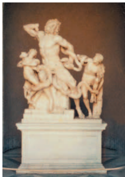
洩露木馬屠城天機的海神祭司〈勞孔〉父子受蟒蛇絞死的懲罰 大理石 梵蒂岡美術館望樓

與凡人瑟梅蕾 (Semele) 之子。而宙斯和凡人所生的半神，後來都成爲一個個傑出的英雄人物，在希拉的妒恨與迫害中，一一被捲入上天的是非恩怨。如宙斯和佩修斯 (Perseus) 的孫女阿克曼妮