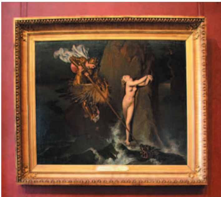
安格爾《羅傑解救安潔莉》的原作 這傳奇故事取自史詩《瘋狂的羅蘭》 1819 油畫 羅浮宮古典繪畫廊

付出極大的代價——墜入痛苦的輪迴或是人倫關係的毀壞，親人的離散，幸福的失落，情感的誤解，或是承受永無止息的懲罰，甚至喪失生命，滅亡整個國家！ 希臘聯邦的十年戰爭，在特洛伊公主卡珊德拉（Cassandra）的眼中，早已是明白寫在空中的悲劇預告，縱有海神祭司勞孔（Laocoön）洩露天