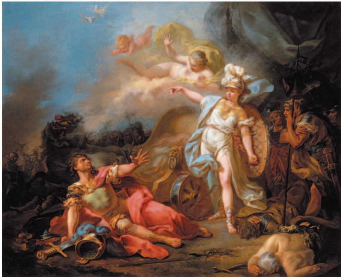
蜜涅芙和馬爾斯二位戰神，各自擁護希臘聯軍和特洛伊 大衛（David）新古典風格形成以前的洛可可（Rococo）風格之作〈蜜涅芙大戰馬爾斯〉 1771 油彩、畫布 高1.14公尺 寬1.4公尺 巴黎羅浮宮博物館藏

的亡國命運，與整個希臘聯軍，因犧牲、因戰亡、因背叛而失去的英雄人物，都因一顆鏤刻了「獻給最美的女神」的金蘋果而起。世間威力最強的炸彈——愛與忌妒，在遠古的希臘投下，直到今日，世界仍籠罩著爆炸的煙霧。