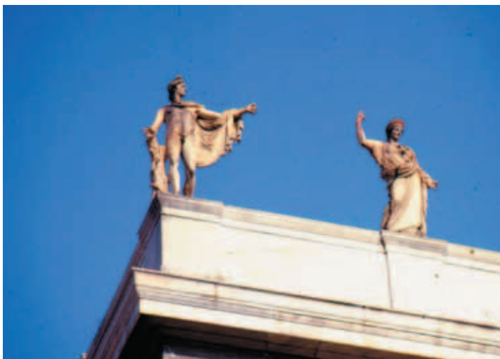
雅典考古美術館簷欄的〈阿波羅雕像〉

人的戰役》牽動天上諸神與凡人的力量，大力士海克力斯 (Hercules) 加入戰鬥，就已經預告著神與人之間不可切的命運。