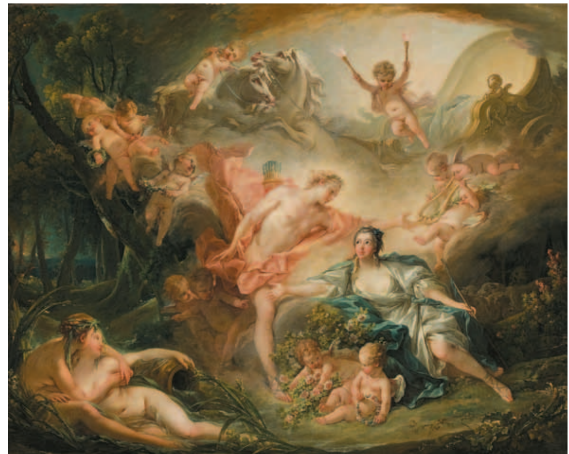
〈阿波羅向牧羊女伊賽揭示他的神性〉 布雪 1750 油彩、畫布 高1.29公尺 寬1.575公尺 圖爾美術館藏