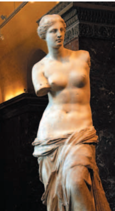
米羅島的〈維納斯〉 大理石 羅浮宮希臘雕刻廊

希臘神話主要依據荷馬 (Homer, ca. 8th century BC) 史詩《伊里亞德》(Iliad) 和《奧德賽》(Odyssey) 兩部史詩流傳人間，到了羅馬時代的拉丁文詩人，奧維德 (Publius Ovidius Naso, B.C. 43-14) 以《變形記》(Metamorphoses) 更增添希臘神話中奇特情節，維吉爾 (Publius Vergilius Maro, B.C. 70-19) 仿荷馬《伊里亞德》(Iliad) 史詩所做的《埃涅亞德》(Aeneiad)，更將特洛伊亡國後，埃涅阿斯 (Aeneas) 的命運與羅