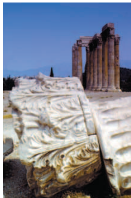
雅典最高的神殿—宙斯神殿

心中浮生讚嘆，而不明所以。人的世界，如何想像神的宇宙？而生命的誕生，又如何依附在自然界的岩石、草木，和森林中的走獸，與海底的魚龍？自然界的風、雲、雨、露，種種靈動的現象，靜止的狀態，都包含著無限的秘密，而這一切，終究該有屬於它們自己的故事。