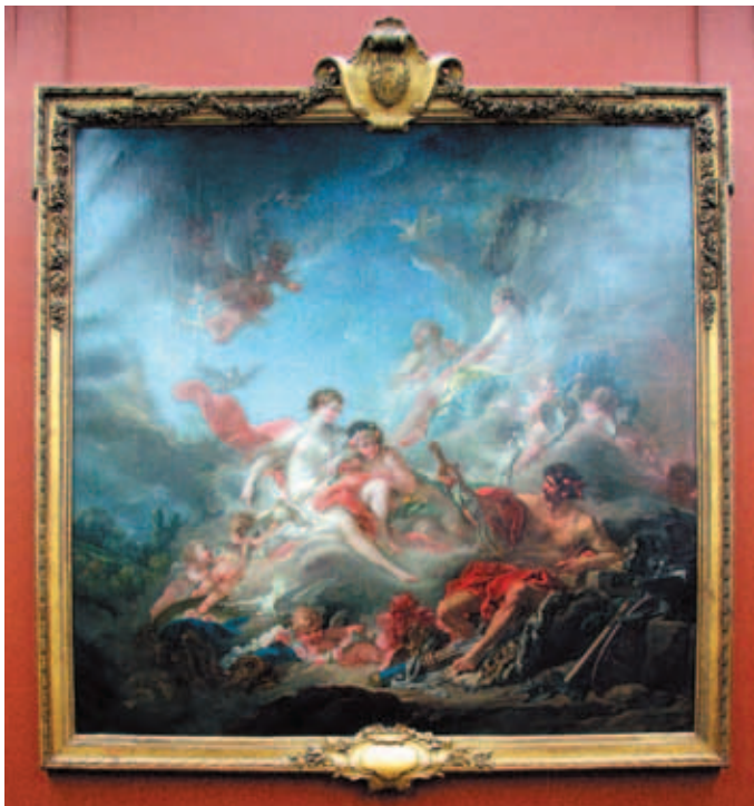
《金工神伏爾剛將兵器交給妻子維納斯》 布雪 油畫 羅浮宮方庭 (Cour Carrée) 法國繪畫廊