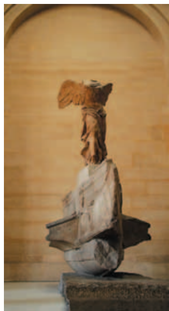
羅浮宮中〈勝利女神像〉(尼克)