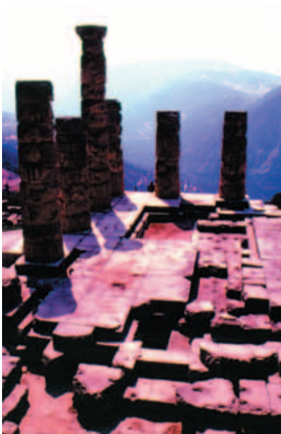
德爾斐 (Delphy) 帕納索斯山 (Montpanasse) 上阿波羅神殿遺跡

信使神漢密斯則成為墨丘利 (Mercury)，酒神戴奧尼索斯也叫做巴庫斯 (Bacchus)，到了羅馬時代，人們偏好稱呼他為巴庫斯。太陽神阿波羅也曾擁有另一個希臘名字是菲柏斯 (Phoibos)，羅馬時代則仍舊以阿波羅通行。譯名更迭，希臘諸神的故事在羅馬時代更經過重新翻譯而新編改寫。