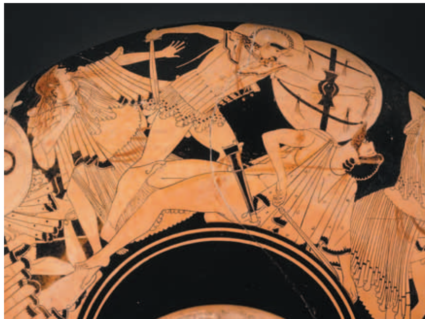
古希臘紅繪高腳酒杯〈攻佔特洛伊城〉 雅典 西元前490年左右 陶土 高0.315公尺 寬0.42公尺 直徑0.332公尺 巴黎羅浮宮博物館藏