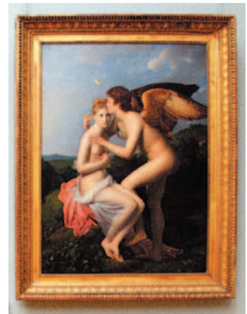
大衛學生傑哈爾 (Gerard) 的〈塞姬與愛神〉飄在思緒上方的靈魂蝴蝶 油畫 巴黎羅浮宮博物館

天帝宙斯有著絕對的權威，它震怒如雷霆，威力強大，雖是仲裁天界是非的主神，卻控制不住自己的欲望。他總是誘拐、挾持、掠奪凡間女子，除了戰爭女神雅典娜是他與元配梅蒂絲 (Metis) 所生，戰神馬爾斯是他和天后希拉所生之外，他留下太多令天后希拉妒恨的風流種。這些私生子充塞天上與凡間，有不死的神仙與人間大英雄。如太陽神阿波羅與月神黛安娜是宙斯與莉托 (Leto) 之雙生子，美神維納斯是他和迪奧妮 (Dione) 所生，漢密斯是他與寧芙仙子瑪雅 (Maia) 所生，酒神戴奧尼索斯是他