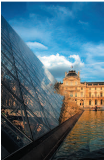
巴黎羅浮宮

先於繪畫的神話文學 希臘神話，在雕刻與繪畫能成熟地呈現之前，早以文學的形式完備存在了。雖然希臘的繪畫至今已罕見完整且獨立的作品存世，卻以陶繪的形式留在為數龐大的各式陶器之上。 古希臘從西元前五百年開始，發展出成熟的陶器繪畫——紅色胎土的底色顯露形象的「紅繪」，和黑色釉藥所描繪形象的「黑繪」。以紅土胎色