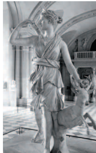
羅浮宮中希臘羅馬雕刻廊的〈凡爾賽的黛安娜娜〉大理石原作