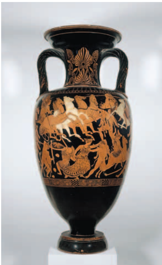
奧林帕斯山上諸神全數登場的〈天神與巨人之戰（巨人戰役）〉 蘇維蘇拉城的畫師 雅典 約公元前410-400年 長頸雙耳尖底壺 紅繪彩陶 高0.695公尺 直徑0.324公尺 巴黎羅浮宮博物館藏

先於繪畫的神話文學 希臘神話，在雕刻與繪畫能成熟地呈現之前，早以文學的形式完備存在了。雖然希臘的繪畫至今已罕見完整且獨立的作品存世，卻以陶繪的形式留在為數龐大的各式陶器之上。 古希臘從西元前五百年開始，發展出成熟的陶器繪畫——紅色胎土的底色顯露形象的「紅繪」，和黑色釉藥所描繪形象的「黑繪」。以紅土胎色