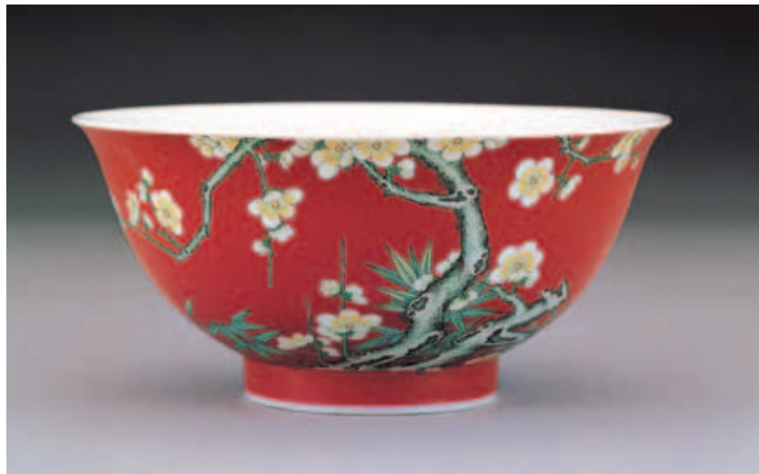
清 雍正 瓷胎畫琺瑯紅地白梅花碗 口徑15.1公分 國立故宮博物院藏