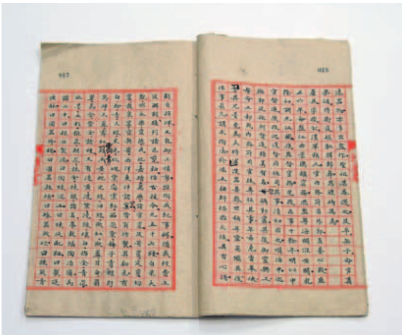
清〈唐英傳〉 清史館本 國立故宮博物院藏