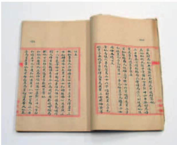
清 《敏妃章佳氏》 收入《后妃傳》 清史館本 國立故宮博物院藏