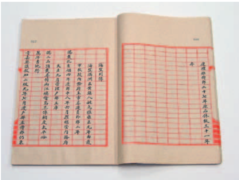
清〈海望傳〉 收入《國史大臣列傳正編》 卷120 清國史館本 國立故宮博物院藏

此，當絕大多數作坊都從養心殿搬出，改設在慈寧宮茶飯房時，卻被稱作「養心殿造辦處」，也就是保持原來造辦處設在養心殿時的叫法。