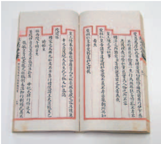
清 《世宗憲皇帝上諭八旗》 卷8 收入《四庫全書》 文淵閣寫本 國立故宮博物院藏