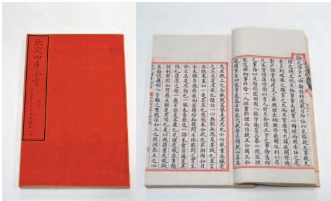
清 《世宗憲皇帝上諭內閣》 卷46 收入《四庫全書》 文淵閣寫本 國立故宮博物院藏