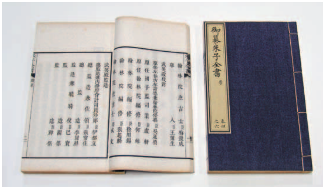
清 《朱子全書》 清康熙53年武英殿刊本 國立故宮博物院藏