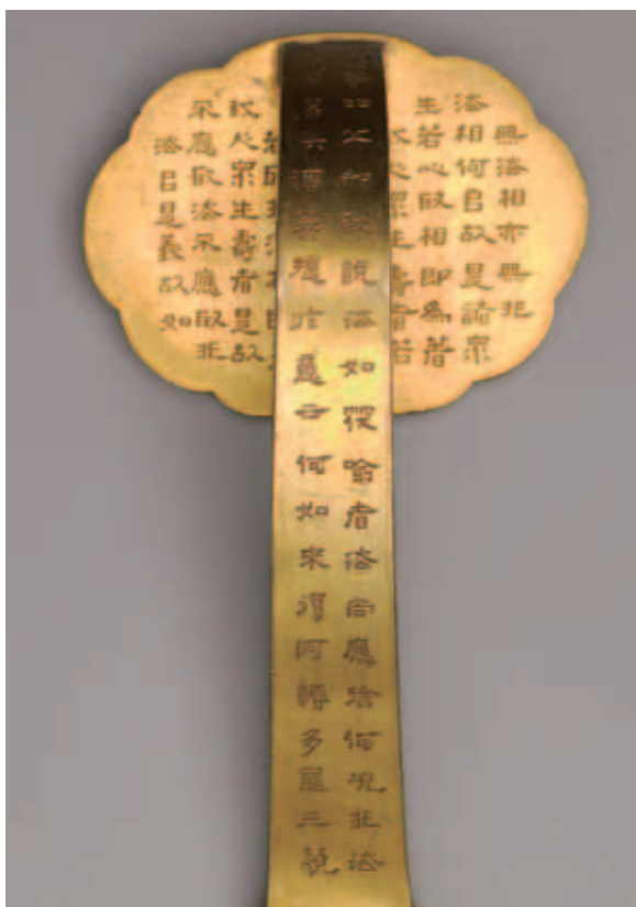
圖六 背面長柄上端寫經 故雜990 國立故宮博物院藏