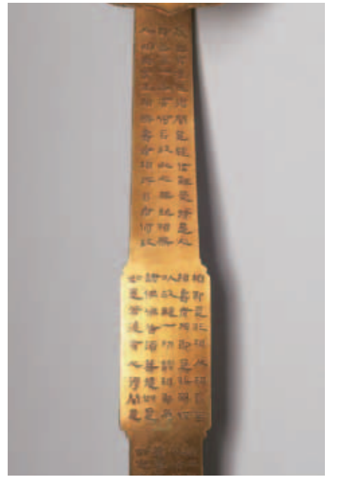
圖三 長柄上端與中段寫經 故銅2458 國立故宮博物院藏