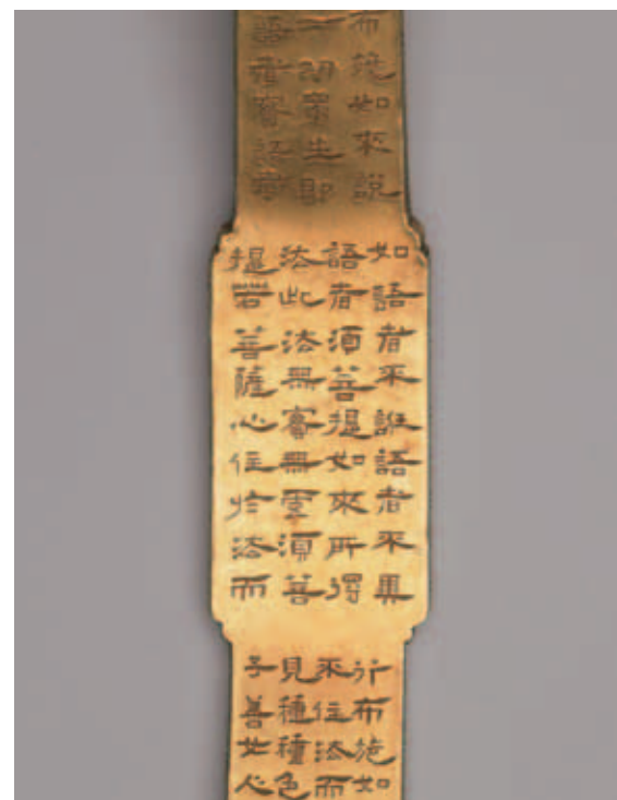
圖七 背面長柄中段寫經 故銅2458 國立故宮博物院藏