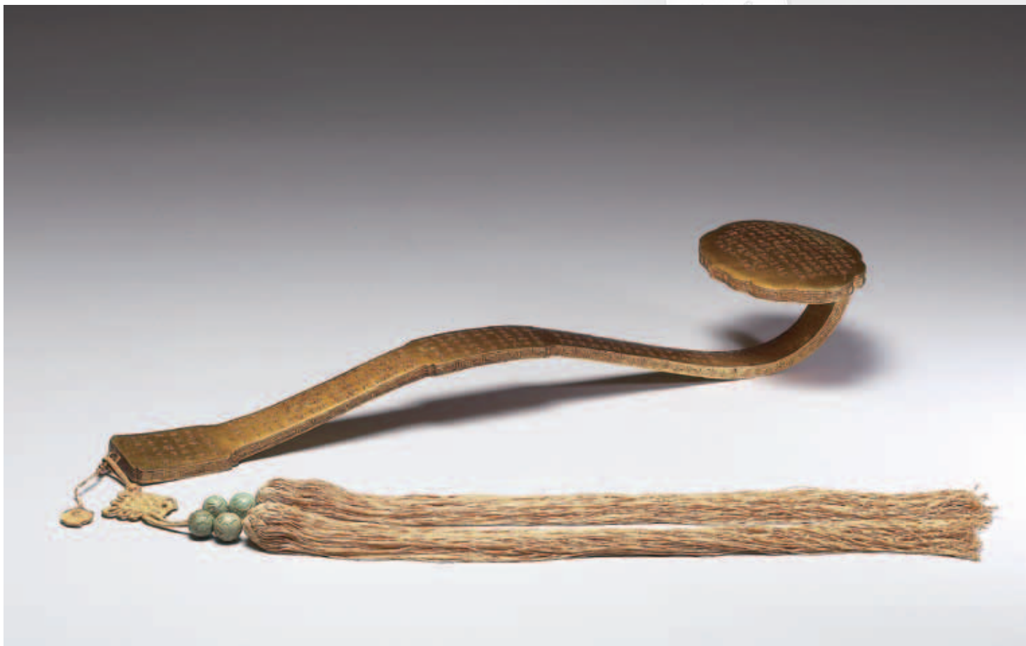
圖一 清 銅鍍金刻金剛經如意 故銅2458 國立故宮博物院藏

如意，原為背搔，古謂爪杖，又稱癢和子，顧名思義，即用以搔抓手不到之脊背之癢，如人之意，故稱如意。在清代成為吉祥的象徵。從考古實物證明中國在公元紀年前便有如意，但中世紀如意也成為佛教的象徵之一。文殊菩薩手持如意造像便曾出現在敦煌壁畫，而唐代法門寺塔地宮亦發掘出九世紀的銀如意。取其祥瑞之意，有清一代，宮中處處陳設如意，喜慶節日尤不可缺，並成為君臣間餽贈的禮品。清代如意或以竹、木雕製，清雅小巧，或鑲嵌眾寶、點翠鑲金，富麗堂皇，不外乎為文人博古之清賞或貴胄賞賚之瑞器；一套十二支銅鑲金如意，鑄刻首尾俱全之《金剛般若波羅蜜經》法供養，宛如空谷足音。其中一件如意曾於民國九十七年赴奧地利展出，筆者在當時 Schatze aus dem Nationalen Palastmuseum, Taiwan 圖錄中，首次披露本院藏有一整套清刻《金剛經》如意，但言簡意賅，又為德文，今另撰小文介紹，以饗國內讀者。