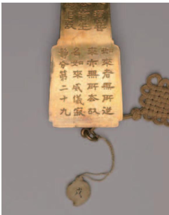
圖九 背面長柄趾部寫經 故銅2457 國立故宮博物院藏