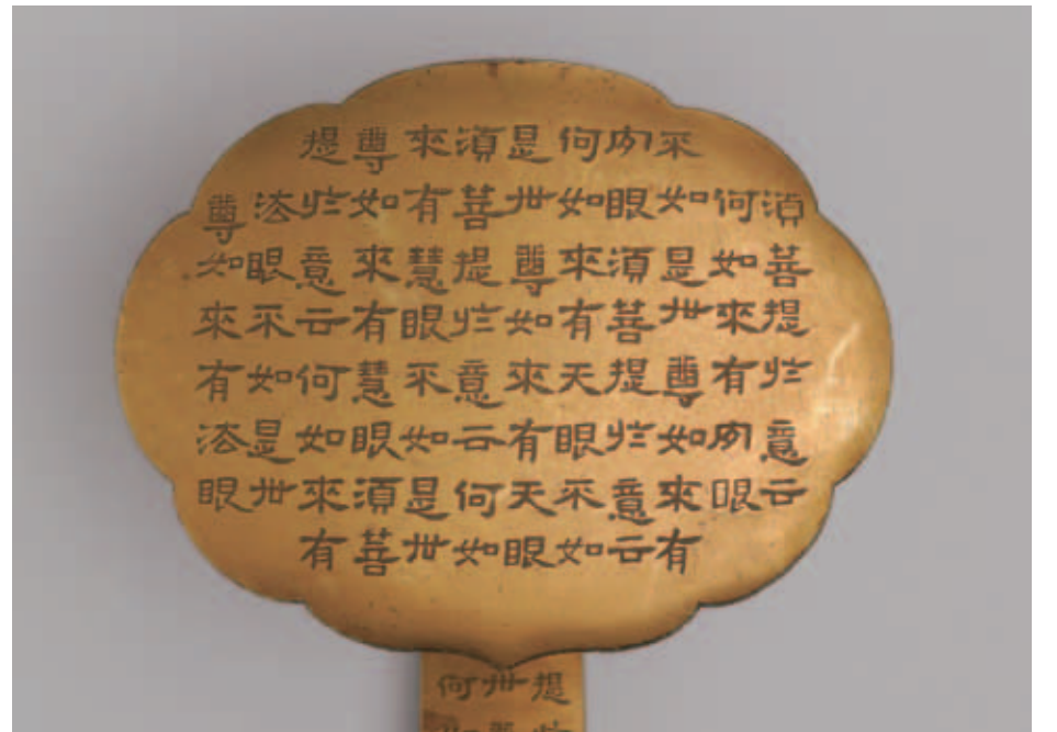
圖二 如意雲頭 故雜989 國立故宮博物院藏

國人所熟知的《金剛經》是《金剛般若波羅蜜經》或曰《金剛能斷般若波羅蜜經》的簡稱，闡述大乘佛教