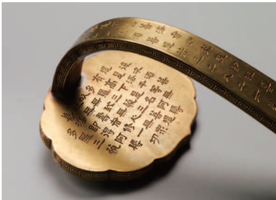
圖五 如意雲頭背面寫經 故雜1320 國立故宮博物院藏