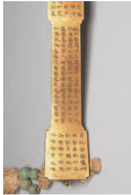
圖四 長柄下端與趾寫經 故銅2458 國立故宮博物院藏