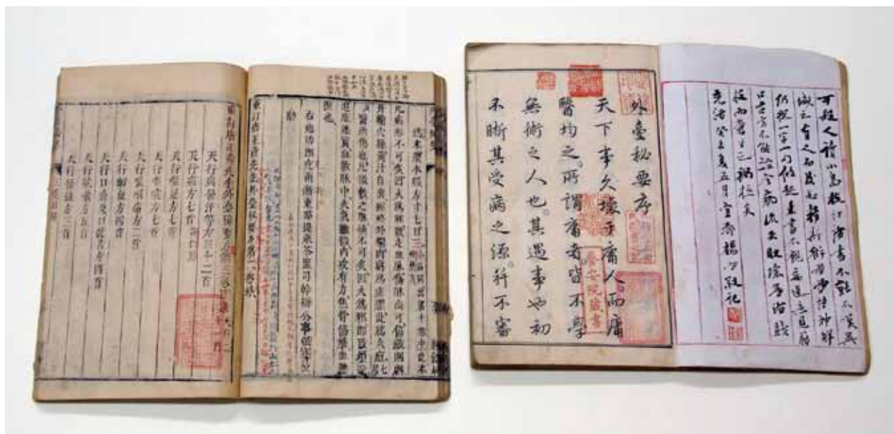
圖二 唐 王彥撰 《外臺秘要方》 明崇禎13年程行道經錄居刊本 故觀011533 國立故宮博物院藏