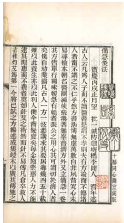
圖五 宋 聞人耆年撰 《備急灸法》 光緒17年江寧藩署重刊羅嘉杰十瓣同心蘭室本 故觀004243 國立故宮博物院藏

將之與其所獲朝鮮金循義等編《鍼灸擇日編集》（一四四七）一同，於日本影刻，羅氏名為「十瓣同心蘭室藏版」，光緒十六年（一八九〇）刊行。翌年，羅氏刊本由江寧藩署翻刻。（圖五）內有摹刻之方印「伊澤氏/酌源堂/圖書記」。 《備急灸法》是否有其他版本，尚不得而知，現行本皆以明嘉靖間仿宋版為祖本。但尚質影抄本中添附一紙記錄，即源晉問詢小島尚質，疑似本書未有錯簡及缺葉。源晉即京都天皇家醫官福井棟園（一七八二～一八四九），福井家為京都著名藏書家，可見福井家或亦藏有相同版本。《黃帝內經太素》