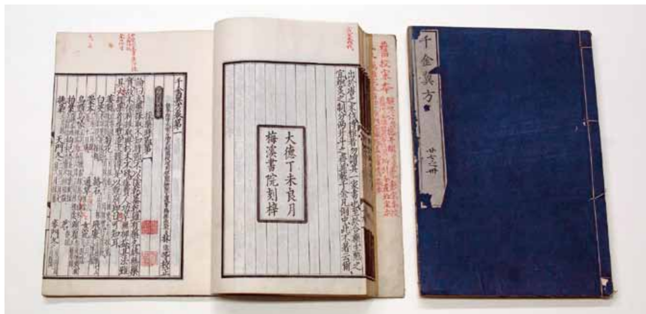
圖一 《千金翼方》 故觀010743 日本文政12年覆刊元大德11年梅溪書院本 國立故宮博物院藏

社會狀況等密切相關。本人曾於《故宮學術季刊》發表專文(註二)，敘述小島家與楊氏收藏古籍。本文介紹小島家學問及蒐書功績。