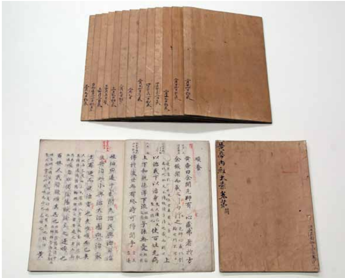
圖六 唐 楊上善撰 《黃帝內經太素》 故觀003257 日本江戶後期影鈔仁和寺本 國立故宮博物院藏

○曾自七二一至七二七年間於司經局任校書，似曾重抄二書。仲麻呂因玄宗不允歸國，故託同期留學生吉備真備（六九五～七七五）於七三五年歸國時將二書帶回日本。日本奈良時代七五七年，二書被定為醫官教科書，伴隨朝廷政權衰亡，十四世紀以降，傳本已不復見。至江戶時代，與皇室宿有緣由之仁和寺秘庫，方可珍藏平安古卷子本，而其影抄本則秘密傳入京都福井家，以及尾張（現名古屋）藩德川家醫官淺井家。 小島尚質獲知仁和寺本諸訊息，自一八三〇至一八四二年，耗費十數年歲月，即現存之影寫仁和寺本《太素》。其第四、六至十二、十四至十八、二十三冊之封底左下墨書云：「某月某日郵來（到來、寄來）」等等。（圖六）尚質令善書者赴尾張影寫，并寄送江戶，一八三二年記錄各冊受領日期。第一冊（卷二）末葉，尚質朱書：「天保壬寅（一八四二）四月廿八日，與澁江摘齋（一八〇五～一八五八）、伊澤柏軒（一八一〇～一八六二），同照《素》、