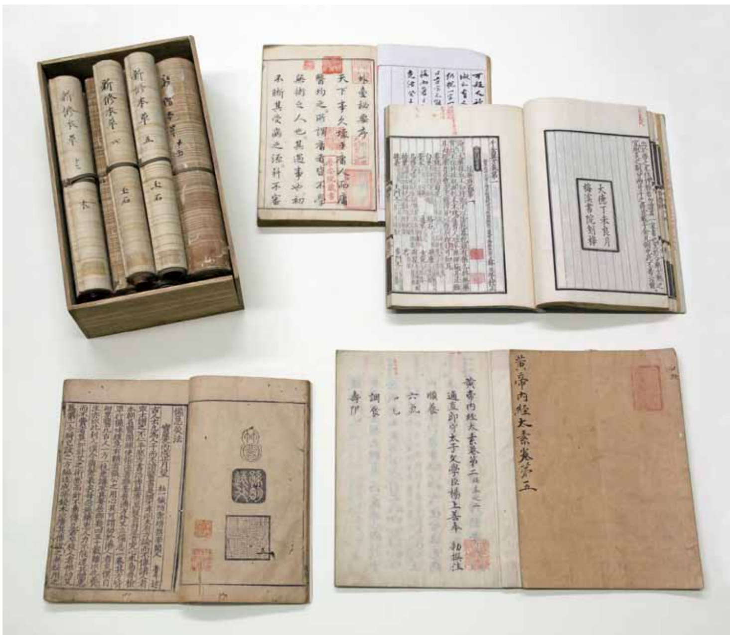
楊守敬觀海堂藏小島家醫書選介 國立故宮博物院藏