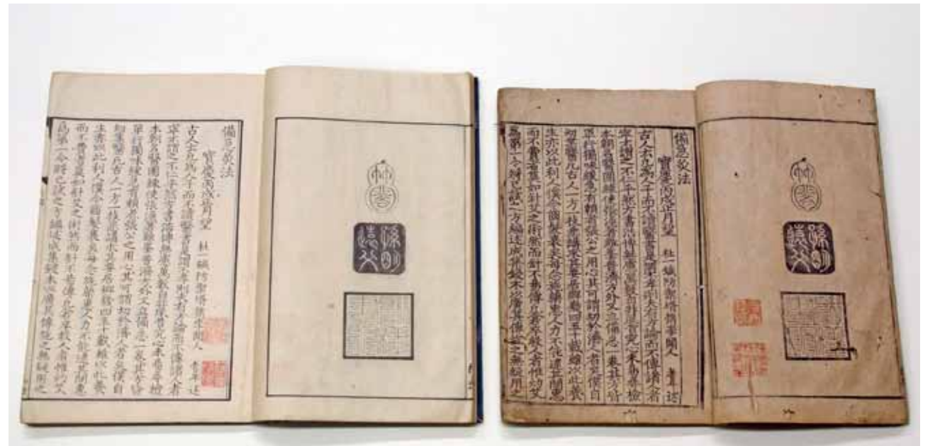
圖四 宋 聞人耆年撰 《備急灸法》 日本江戶後期影鈔明仿宋本 故觀013861 國立故宮博物院藏 圖三 宋 聞人耆年撰 《備急灸法》 明仿宋刊本 故觀013860 國立故宮博物院藏

○曾自七二一至七二七年間於司經局任校書，似曾重抄二書。仲麻呂因玄宗不允歸國，故託同期留學生吉備真備（六九五～七七五）於七三五年歸國時將二書帶回日本。日本奈良時代七五七年，二書被定為醫官教科書，伴隨朝廷政權衰亡，十四世紀以降，傳本已不復見。至江戶時代，與皇室宿有緣由之仁和寺秘庫，方可珍藏平安古卷子本，而其影抄本則秘密傳入京都福井家，以及尾張（現名古屋）藩德川家醫官淺井家。 小島尚質獲知仁和寺本諸訊息，自一八三〇至一八四二年，耗費十數年歲月，即現存之影寫仁和寺本《太素》。其第四、六至十二、十四至十八、二十三冊之封底左下墨書云：「某月某日郵來（到來、寄來）」等等。（圖六）尚質令善書者赴尾張影寫，并寄送江戶，一八三二年記錄各冊受領日期。第一冊（卷二）末葉，尚質朱書：「天保壬寅（一八四二）四月廿八日，與澁江摘齋（一八〇五～一八五八）、伊澤柏軒（一八一〇～一八六二），同照《素》、