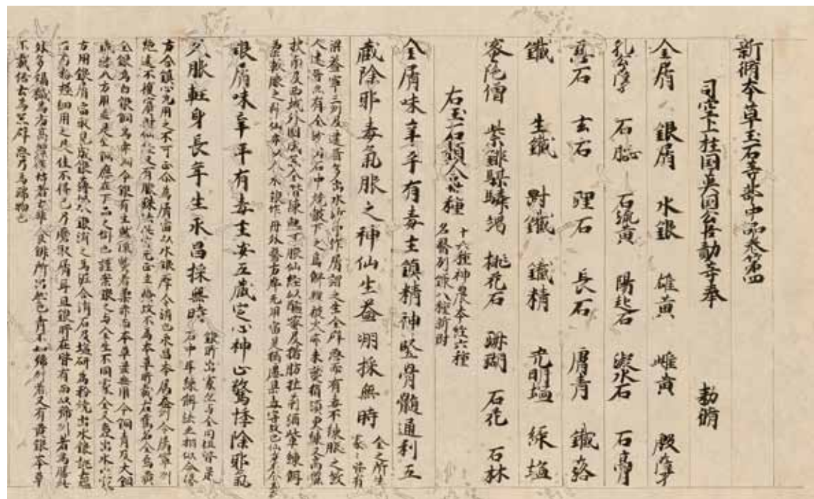
圖十 唐 蘇敬等編 《新修本草》 日本江戶後期影鈔卷子本 故觀00440 國立故宮博物院藏

仁和寺僚本卷十五（重要文化財），皆為鎌倉時代十三世紀卷子抄本。圖十乃小島尚質依各卷子本所影寫。為保持舊態，未曾按捺小島家及楊氏藏書印記，亦未書識語。小島尚質最初所得卷十五，係重抄友人考證學者狩谷掖齋（一七七五～一八三五）一八三二年於京都影寫福井家本。一八三四年，尾張淺井正翼（一七九七～一八六〇），影寫仁和寺本卷四、五、十二、十七、十九，其後尚質亦得以重抄。福井家另藏仁和寺本卷十三、十四、十八、二十之影寫本四卷，尚質一八四二年於京都重抄。但此四卷原本，現所在不明。尚質與尚真根據影抄本，重輯《新修本草》（故觀〇一三二〇）本闕遺部分，進而對尚真與森約之等重輯《本草集注》、森立之重輯《神農本草經》等起到促進作用。尚質致力蒐集散在殘卷并影寫傳存，功績甚大。又卷十五末尾識語云：「天平三年歲次辛未七月十七日，書生田邊史」，可知原本於奈良時代天平三年（七三一），由寫經生田邊史（真人）抄寫。此為《新修本草》傳入日本之最早記錄，且與天皇家寶庫正倉院舊藏文書中，書記官田邊真人之署名筆跡相一致，故卷十五之識語並非贗作。