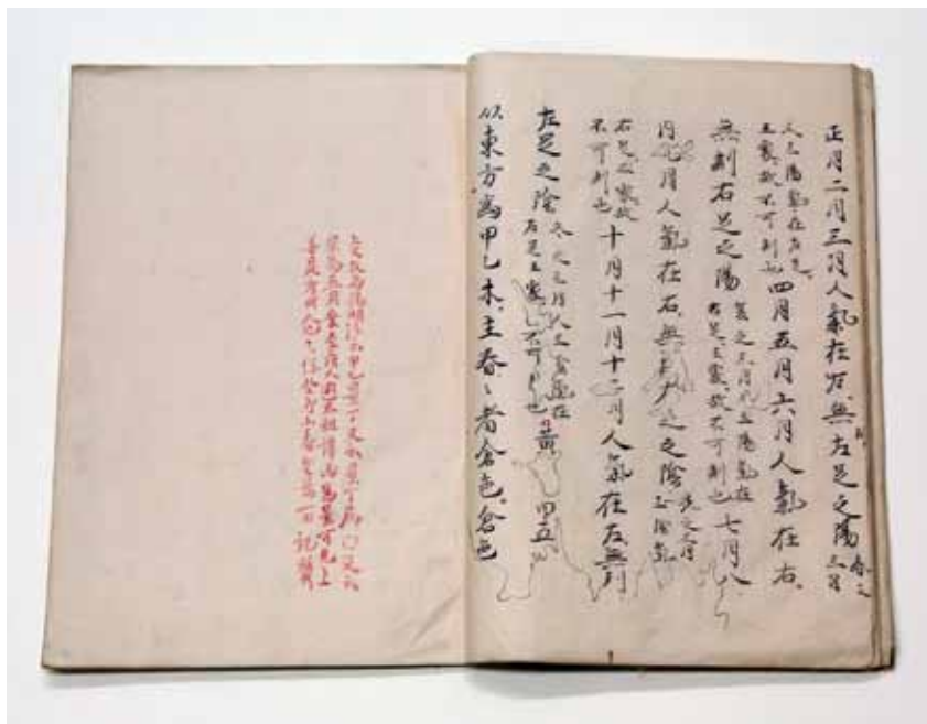
圖七 《黃帝內經太素》 第24冊小島尚質識語 故觀003280 國立故宮博物院藏