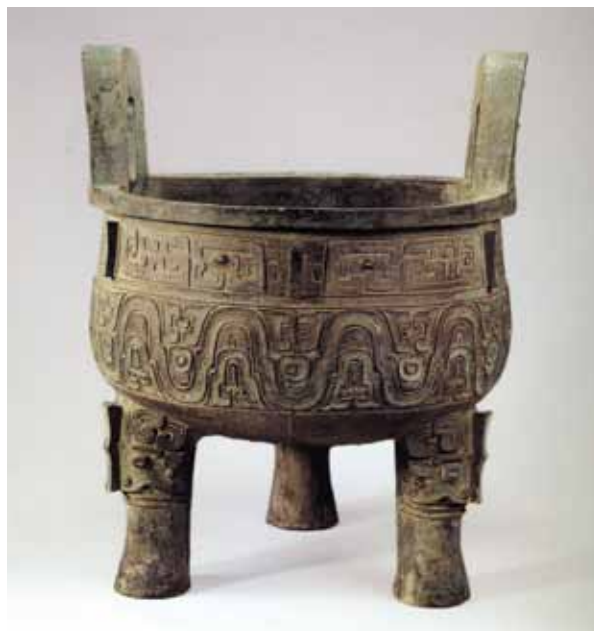
圖六 西周晚期 大克鼎 通高93.1公分 上海博物館藏 引自《夏商周青銅器研究：上海博物館藏》