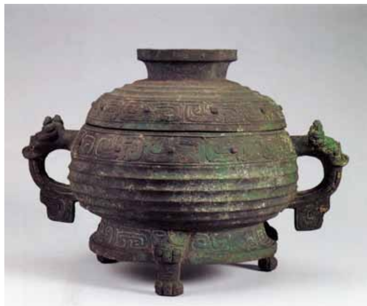
圖九 西周晚期 膳夫梁其簋 高25.6公分 上海博物館藏