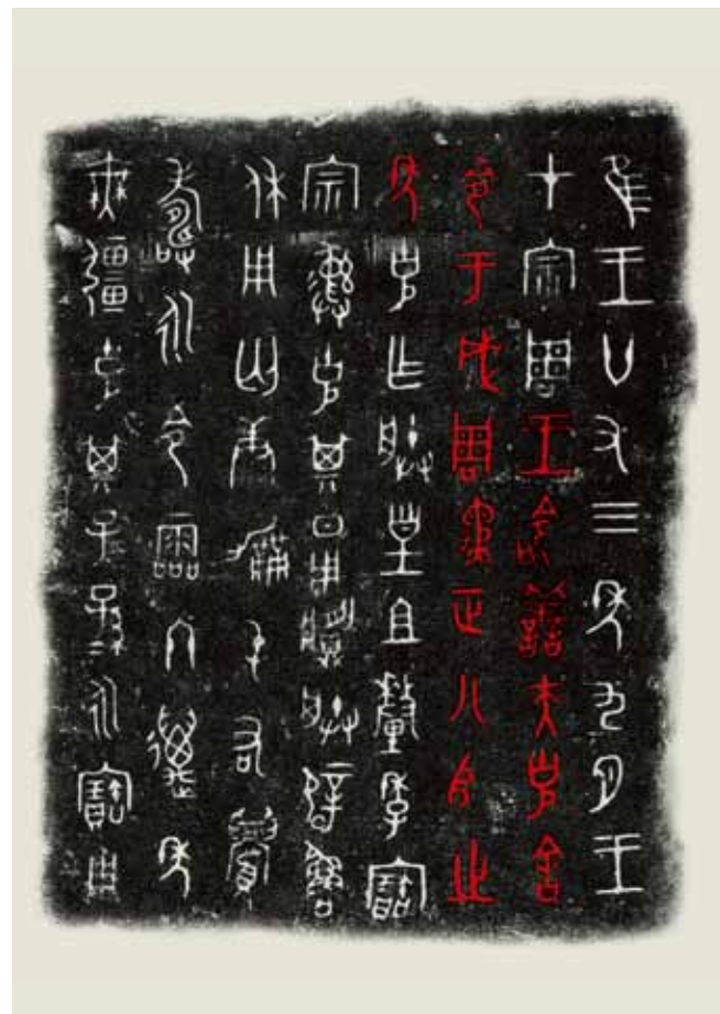
圖八 《小克鼎》拓片 引自《夏商周青銅器研究：上海博物館藏》

〈大克鼎〉記錄膳夫克得到的賞賜物非常豐富，甚至有樂器「雷籥鼓鐘」，可見周王賦予高規格的禮遇。從土地賞賜方面考察，至西周中晚期時，周王對具有重要功績的官員，土地的賞賜成爲獎勵手段，且通常是軍事方面的功勳。「田」雖是土地的最小單位，膳夫克一次得到七處田，並且還有附屬的勞役人員，相較於其他的賞賜案例，膳夫克立下的功勞雖未有詳細記載，由上述豐富的賞賜物內容，可見作器主膳夫克深受寵信與穩