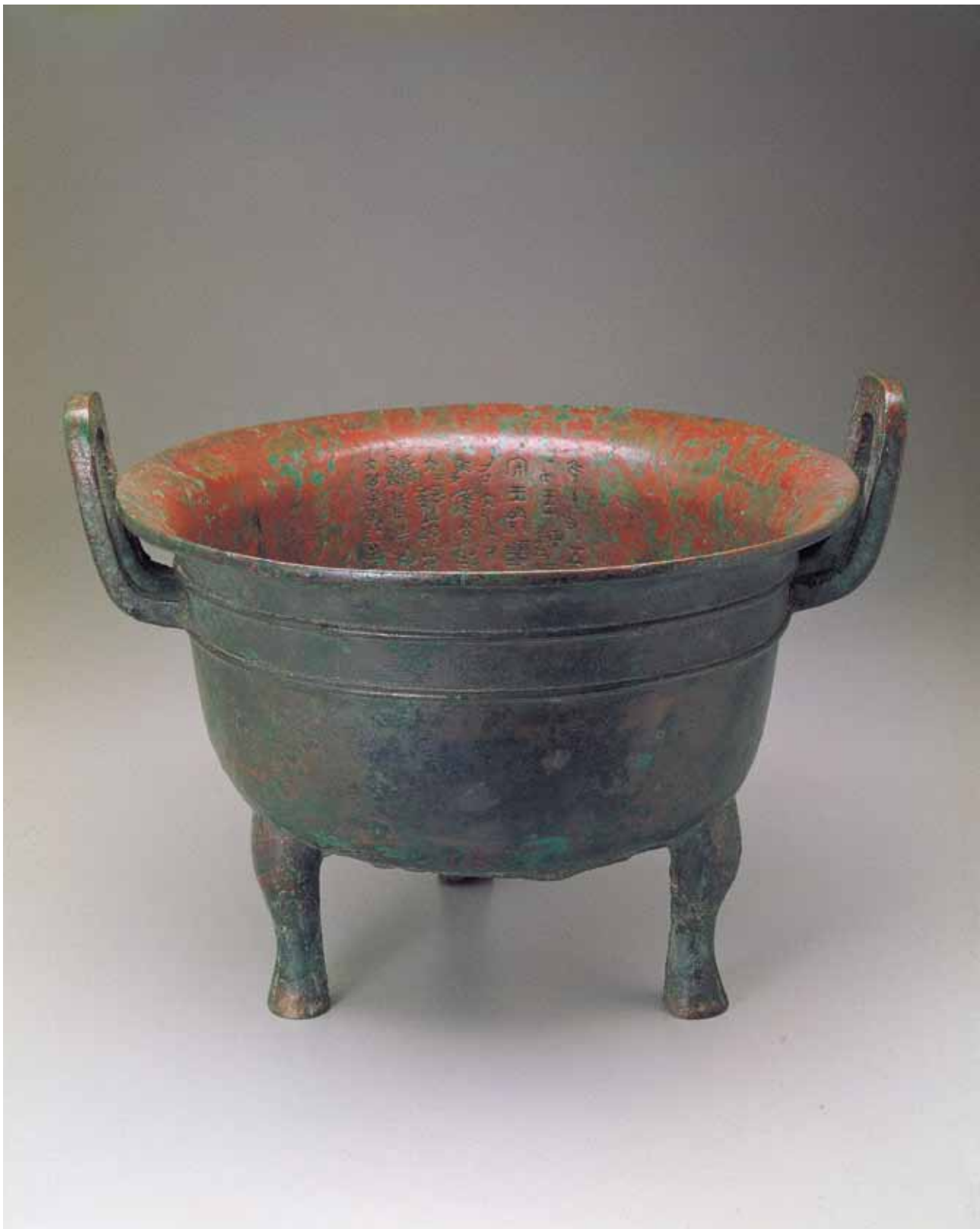
圖一 西周晚期 大鼎 通高31.6公分 國立故宮博物院藏