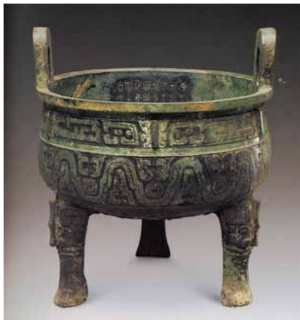
圖七 西周晚期 小克鼎 通高35.4公分 北京故宮博物院藏 引自《故宮青銅器館》