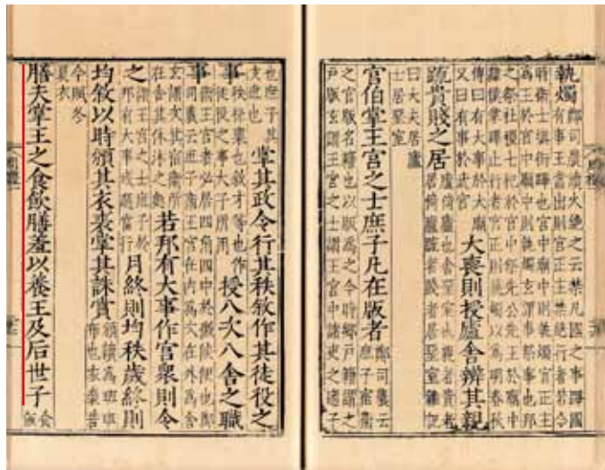
圖三 《周禮·天官》 明徐獻忠本 國立故宮博物院藏