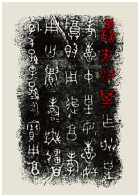
圖十 《膳夫梁其簋》拓片 引自《殷周金文集成》04149.1