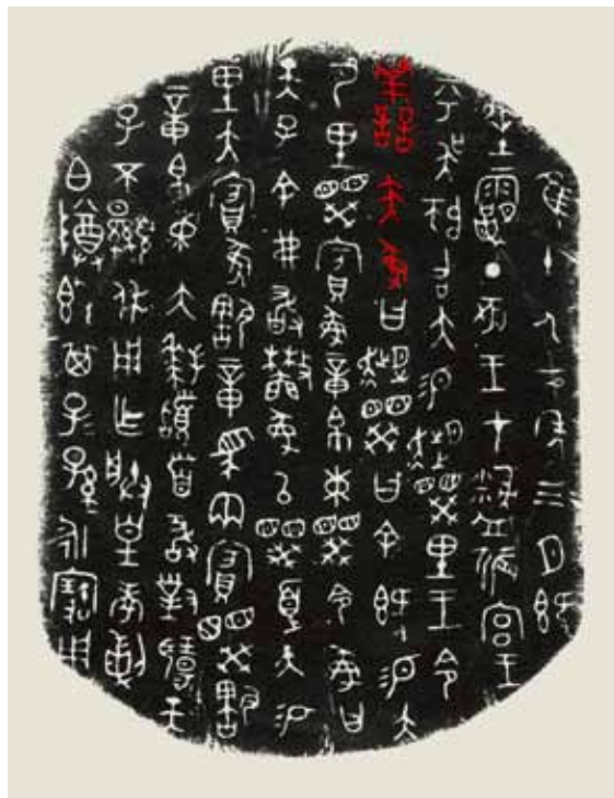
圖五 〈大簋蓋〉拓片

五），銘文內容同樣是周王賞賜「大」的紀錄，膳夫在這兩次的賞賜過程中，卻擔任不同的角色。〈大簋〉描述周王賞賜「大」特級馬匹，而〈大簋蓋〉為賜予田地。〈大簋蓋〉內容為：「唯十又二年三月既生霸丁亥，王在盤儀宮，王呼吳師召大，賜趨睽里，王令膳夫豕曰趨睽曰：余既賜大乃里。睽賓豕璋、帛束。睽令豕曰天子：余弗敢吝。豕以睽履大賜里，大賓豕訊璋、馬兩，賓睽訊璋、帛束，…」(04298-04299，西周晚期)周王賞賜「大」一處田里，此地原屬於名為「趨睽」的人所