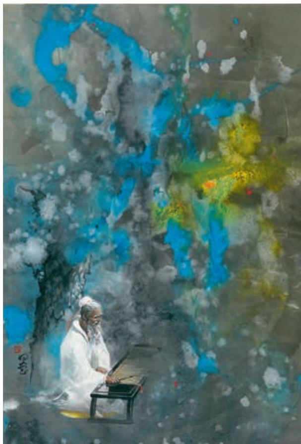
圖13 1990 鄭問 孔子 收入《東周英雄傳》

逐步闖出名號的鄭問，其作品日漸受到肯定，集結出版單行本的《刺客列傳》，在 1987 年獲得「國立編譯館民國 75 年下半年度優良連環圖畫獎」第一名。這一年的 7 月 15 日，臺灣正式解嚴，隨著威權統治的遠去，漫畫審查制度也自動失效，許多創作者開始揮灑自己的理念，卻仍有有關單位試圖恢復漫畫審查制度。行走漫林的鄭問，1991 年除了得到日本漫畫家協會獎的優秀賞外，也在 8 月成立的臺灣漫畫家聯盟內擔任聯盟會長，領銜抗議審查制度，並積極爭取國內漫畫家的生存空間。鄭問義正嚴詞的表示，「臺灣漫畫市場 95% 被日本色情暴力漫畫壟斷，政府卻要只有 5% 銷售量的國內正版漫畫負起不良漫畫的責任，實在太不公平。」一個意外的插曲，讓鄭問轉入了漫畫圈，還繼承了前輩的衣鉢，站上了浪頭。即便身後，他仍開創了首位漫畫家作品前進故宮的記錄。（圖 14）