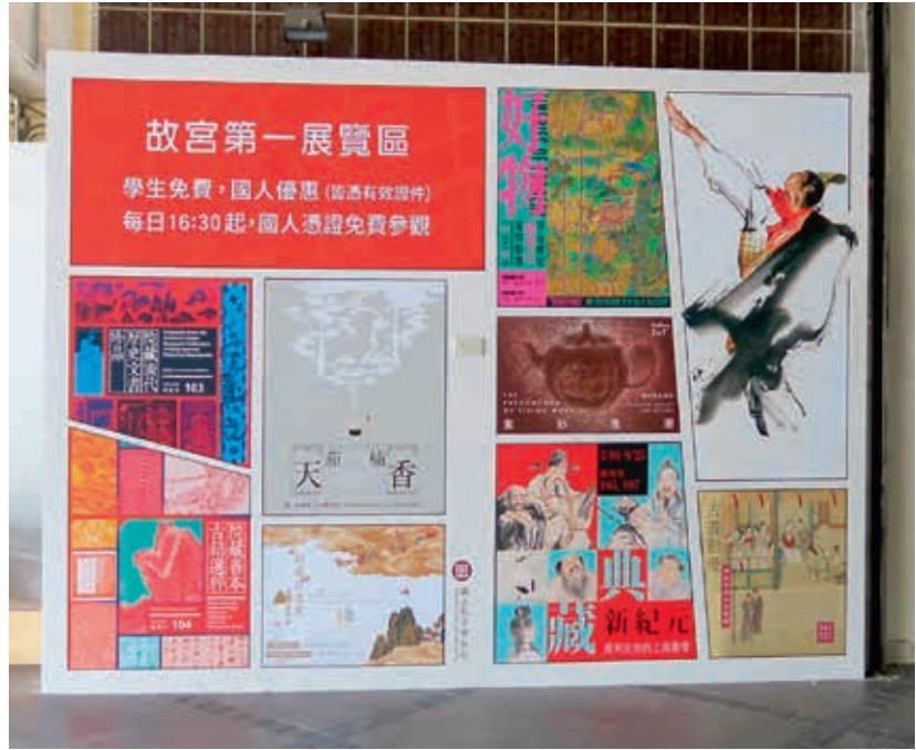
圖18 故宮的設計師以連環圖畫分鏡的樣式，串連了鄭問展的形象與故宮正館的各展覽。

了八卦山大佛、故宮……還有中華商場。這讓我確信，在他以整個亞細亞或大宇宙為想像場域時，終究帶著從島嶼出發的情感。」 9