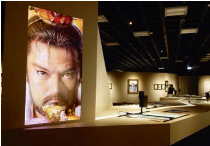
圖5 特展內有相當多元的多媒體與互動裝置，讓民眾可以用不同角度來了解鄭問的作品。