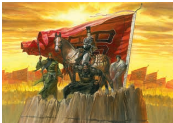
圖14 2001 鄭問 漢中王劉備 收入《鄭問之三國誌》 ©鄭問工作室