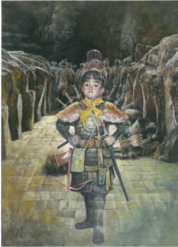
圖12 1991 鄭問 始皇童年 收入《東周英雄傳》 ©鄭問工作室

少見的CG（Computer Graphics）動畫及靜止畫的新技術來製作，足見其慎重。 6 故宮這個寶庫，適時的提供了漫畫家創作的泉源，穿透國境，讓新的文化創意萌芽滋長。鄭問曾經表示，於每一篇角色的選定，「其實就是看心情。我會隨意翻史書，如《左傳》、《公羊傳》，喜歡畫誰就畫誰。」故宮蘊含的華夏文化薈萃，就這麼作為鄭問創作漫畫時的養分。