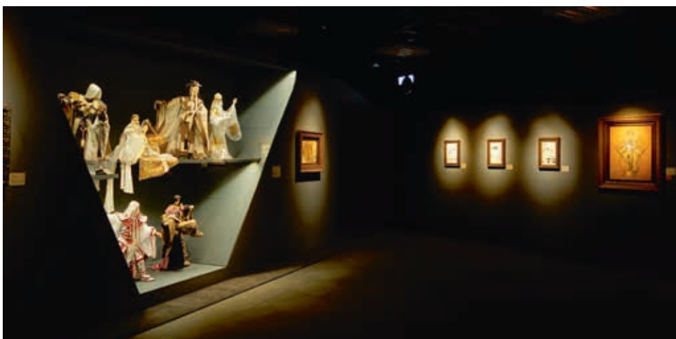
圖16 「千年一問——故宮鄭問大展」內的霹靂布袋戲人偶，正與〈阿鼻劍〉的何勿生遙遙相望。

卦山大佛、蘭嶼、臺中公園、臺北中華商場、國父紀念館、基隆大觀音像、高雄蓮池潭，甚至於終結也在女主角最後化為野柳女王頭後等待男主角黑豹中結束。而在香港創作的《大霹靂》（圖 15、16），以及已完成手稿，卻未能繼續下去的「史豔文」等，便是取材至臺灣庶