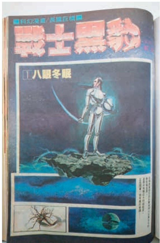
圖8 於《時報周刊》288期首刊的《戰士黑豹》第一話〈八眼冬眠〉

外雙溪新館正式竣工，11月12日舉行館舍落成典禮，公開陳設展示。往前回溯，故宮文物在鄭問出生的前一年，於臺中霧峰北溝新建的陳列室內開始展示，讓有心賞析華夏藝術者有一扇窗口；然地處偏遠，場地亦狹，終究相當有限。在臺北復院後，民眾能在更舒適的空間及更完善設備下觀覽文物，吸引了絡繹不絕的遊客前來。加以在當時由國立編譯館所編行課本當中，多採用故宮文物的圖片，讓故宮的形象及文物影響力，逐漸深植臺灣民間，也成為外國觀光客來臺必遊的景點。《戰士黑豹》作為鄭問個人代表性的正式出道作品（在此之前，鄭問曾經為《近代中國》叢書畫過連環性的插圖，另為《時報周刊》連載小說〈五大名劍〉、也在