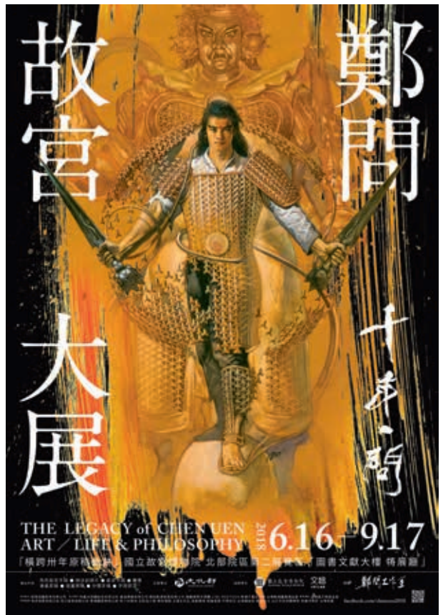
圖1 「千年一問——故宮鄭問大展」海報 ©鄭問工作室

《戰士黑豹》是鄭問25歲的出道作品，於1983年的《時報周刊》288期開始連載。（圖8）當時的鄭問因比賽獲獎已小有名氣，《時報周刊》在前一期（287）的報導中，強調「本刊下