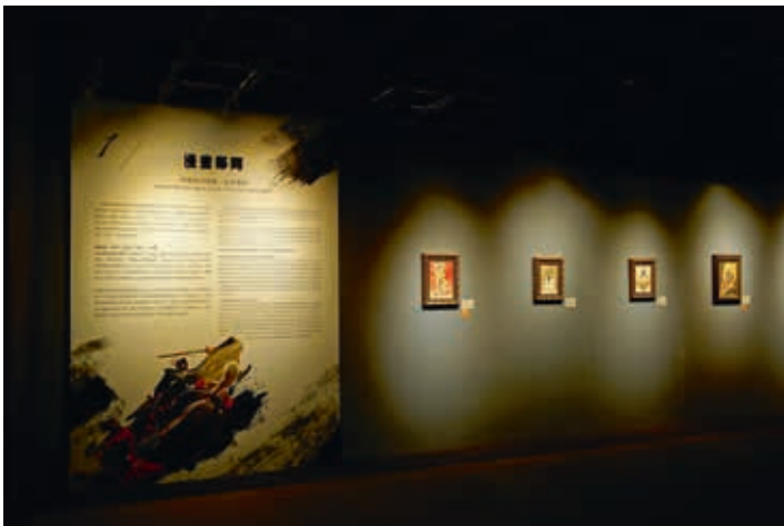
圖4 鄭問特展展場入口第一單元樣貌