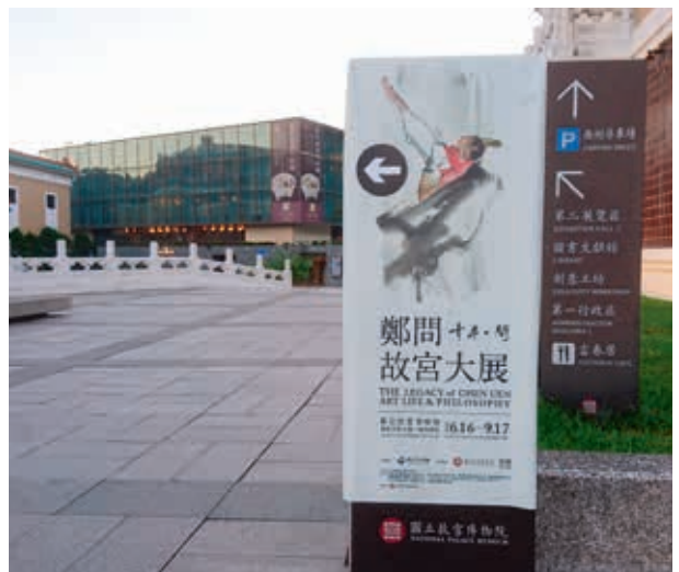
圖3 故宮廣場上的「千年一問——故宮鄭問大展」指標