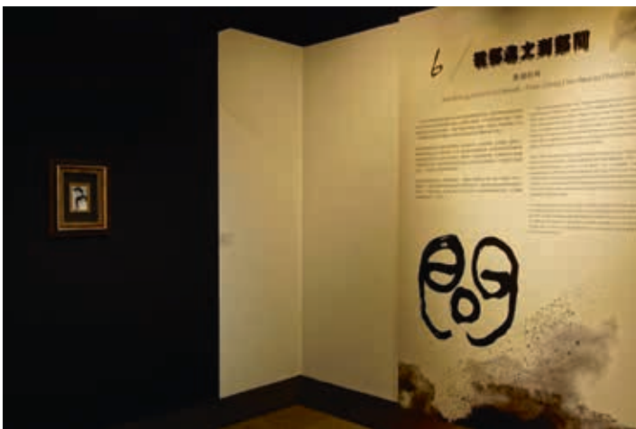
圖6 特展的各單元說明設計甚具巧思 林姿吟攝

畫家也重新拿起筆，群起反擊氾濫成災的日本漫畫。」 1 果然連載之後，就引起不少話題，連載至1984年1月第20話〈野柳女王〉告一段落後，隨即便發行了上中下集的單行本，讓來不及在周刊上閱覽的讀者能有機會購置回家捧讀一番。而《戰士黑豹》不僅是鄭問第一件發行的連載漫畫，並是他的作品當中少數完整連載刊行者。