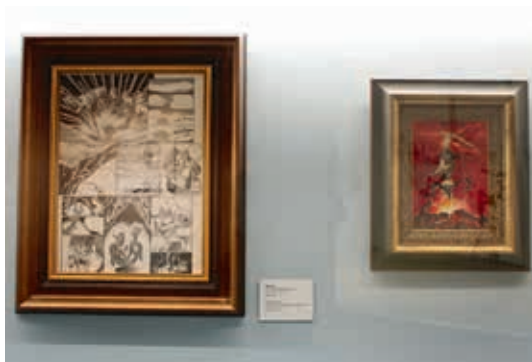
圖9 展場內展示的《戰士黑豹》手稿

1989年，繼發表〈最後的決鬥〉、〈劍仙傳奇〉、〈劊子手〉、《鬥神》、《刺客列傳》後，鄭問更與作家馬利（郝明義）合作，於《星期漫畫》上連載《阿鼻劍》。一系列的作品，不