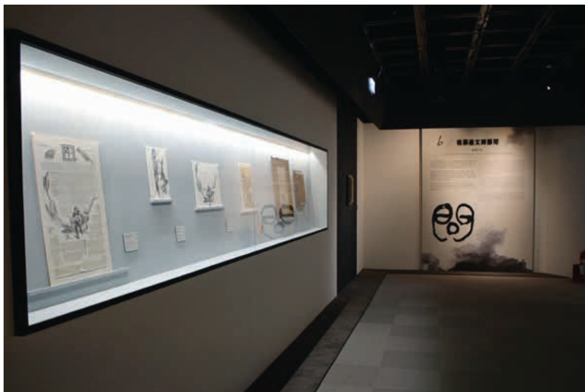
圖11 「從鄭進文到鄭問」展區光景

獎項的多寡，無損鄭問的魅力持續席捲日本漫畫界。1992年起，日本NHK（日本放送協會）決定斥資超過一億日圓，拍攝卡通動畫影片「孔子傳」，後更聯合韓國KBS（韓國放送公社）及臺灣PTS（公共電視臺）進行三方跨國合作。後這部影片遴聘導演侯孝賢擔任影片的監製，孔子的造型則由鄭問擔任設計，繪製原稿。接下這個工作的鄭問，繼續秉持著他堅持的精神，為了考據孔子的造型，甚至數度進出故宮，終將孔子的造型完全顯現出來。 5 NHK為了鈞膩表達鄭問特殊的筆法，還採用當時尚