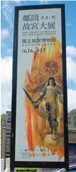
圖17 「千年一問——故宮鄭問大展」的宣傳立牌