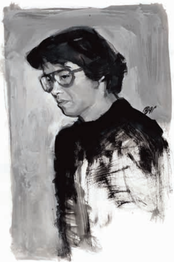
圖7 1990 鄭問 自畫像

外雙溪新館正式竣工，11月12日舉行館舍落成典禮，公開陳設展示。往前回溯，故宮文物在鄭問出生的前一年，於臺中霧峰北溝新建的陳列室內開始展示，讓有心賞析華夏藝術者有一扇窗口；然地處偏遠，場地亦狹，終究相當有限。在臺北復院後，民眾能在更舒適的空間及更完善設備下觀覽文物，吸引了絡繹不絕的遊客前來。加以在當時由國立編譯館所編行課本當中，多採用故宮文物的圖片，讓故宮的形象及文物影響力，逐漸深植臺灣民間，也成為外國觀光客來臺必遊的景點。《戰士黑豹》作為鄭問個人代表性的正式出道作品（在此之前，鄭問曾經為《近代中國》叢書畫過連環性的插圖，另為《時報周刊》連載小說〈五大名劍〉、也在