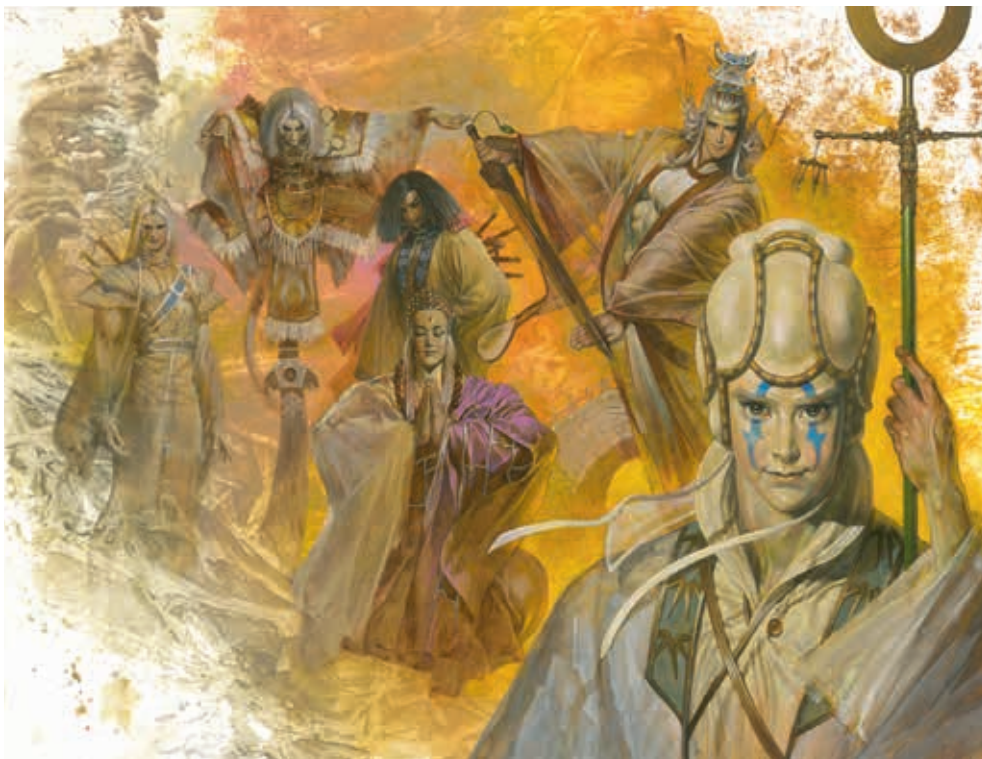
圖15 2000 鄭問 臺灣霹靂國際多媒體、香港玉郎集團與鄭問合作的漫畫《大霹靂》創刊號手稿 © 鄭問工作室