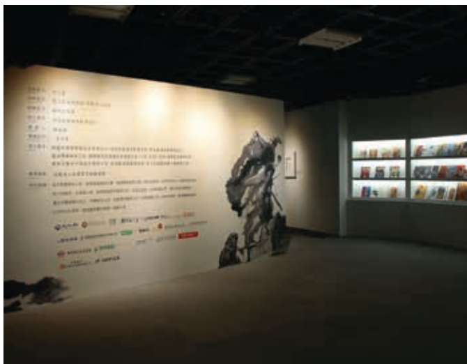
圖2 參與「千年一問——故宮鄭問大展」的諸多單位、個人

期起刊出鄭問的長篇鉅構『黑豹戰士』」，並特別以聳動的說詞提出「住在麥哲倫星雲的『八眼老人』，為了對付乘虛而入的黑暗勢力，他在台灣找到了『黑豹戰士』，同樣的，本地漫