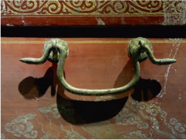
圖4-8 〈朱漆鎔金雲龍紋箱〉金屬配件之拉手提樑