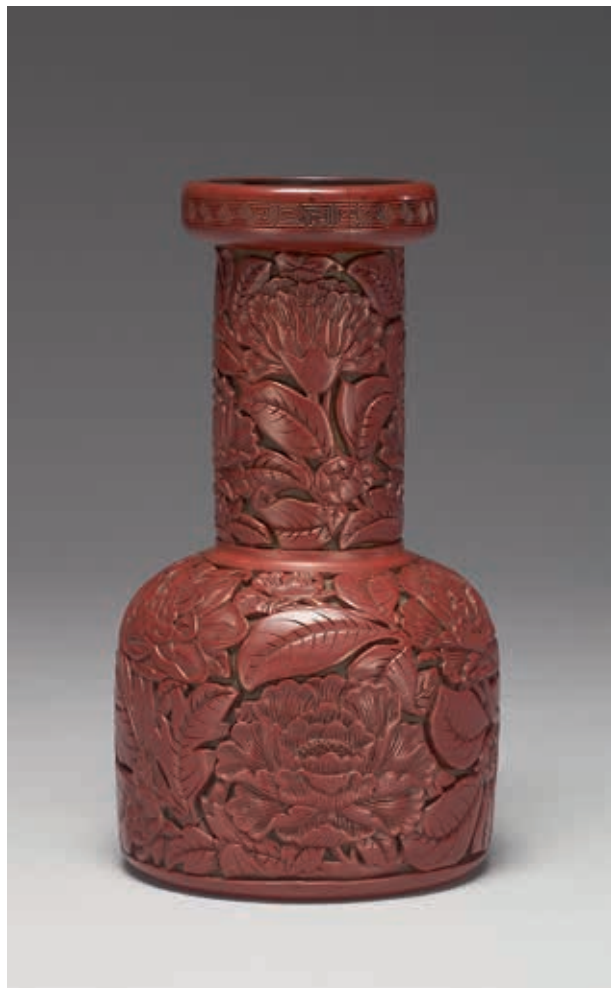
圖6-1 明 永樂 剔紅錐把瓶 國立故宮博物院藏

所謂永樂時期的剔紅漆器，應是指稱傳世不在少數的永樂款剔紅漆器，其中也包括永樂款改為宣德款者。這類永樂款剔紅漆器，一般多接受是明成祖永樂年間果園廠的「廠器」（《帝京景物略》中用語，見下文）之一部份。