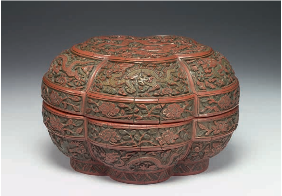
圖2 明 隆慶 剔彩雲龍紋梅花式盒 國立故宮博物院藏