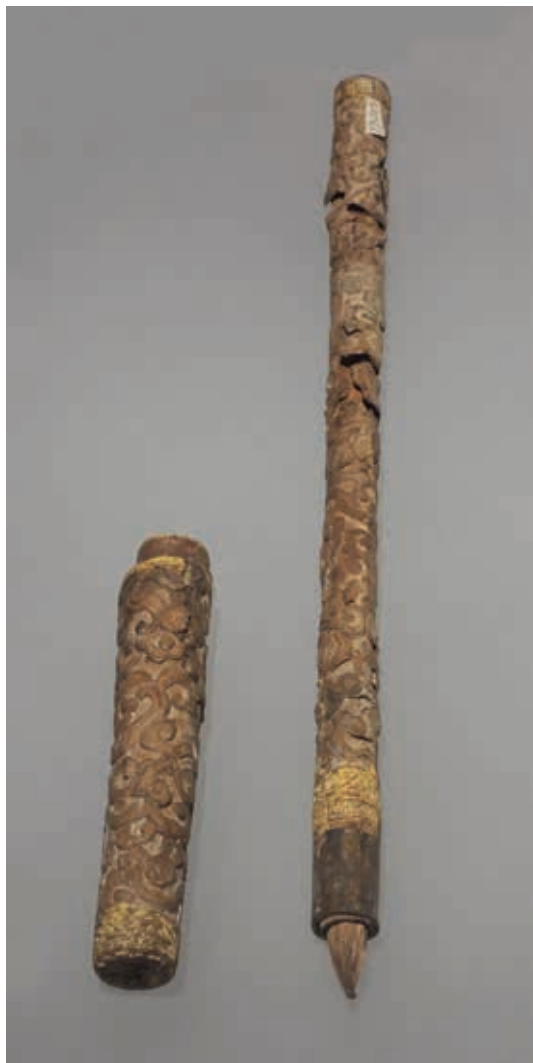
圖5-1 明初 剔黃卷雲紋筆管（附剔黃卷雲紋筆套） 通長32.7，筆管長23.6，筆套長9.4，徑1.55公分 明末檀壘出土 作者攝於2017年8月27日