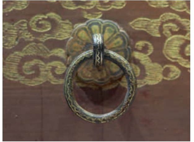
圖4-9 〈朱漆鎔金雲龍紋箱〉金屬配件之鐵環 董宇攝於2018年6月25日