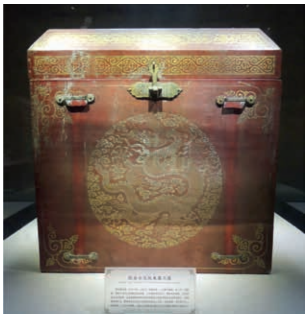
圖4-1 明初 朱漆鎏金雲龍紋箱 通高60，邊長58公分 明朱檀墓出土

的社會大浩劫中進行，出土漆器亦曾委託當時北京故宮博物院的修復人員處理，吾人近日方能得見這批明代「國初」漆器實物。