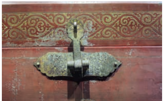
圖4-6 〈朱漆鎏金雲龍紋箱〉金屬配件之轉釦