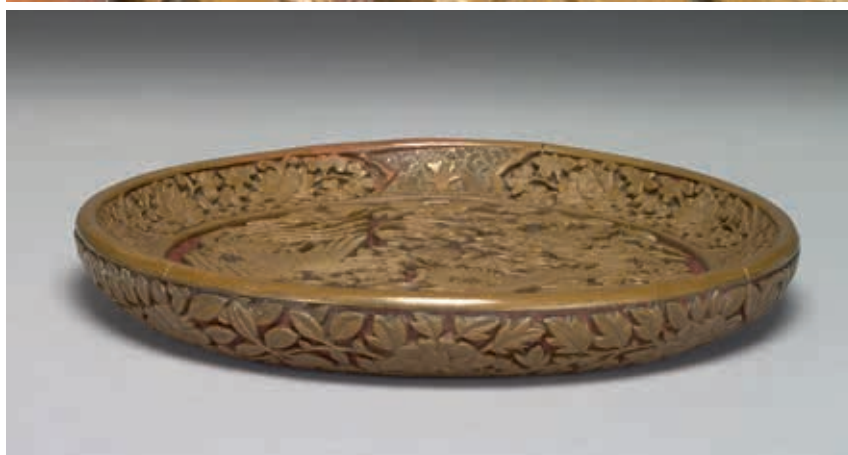
圖7-2 明 嘉靖 剔黃花卉龍鳳紋盤 局部 國立故宮博物院藏

嘉靖壬午年製」八字楷款，即嘉靖元年（1522）：盤內剔飾紅漆方格米字錦地紋，盤之內外壁皆剔飾花卉紋飾，器外壁飾一周纏枝四季花卉紋，器內壁四開光內飾纏枝花卉紋。龍鳳主紋首尾相接立於盤內，盤心正中剔飾火珠一；下方剔飾壽山福海，上方正中剔刻轉枝牡丹，其餘花卉錯落於龍鳳紋間。細審這件嘉靖初年的剔黃盤，紋飾正面打磨較仔細，轉入紋飾側面，則見剔刻不夠規整，圓潤不足；的確是「刀不藏鋒，稜未磨也」。（圖7-2）