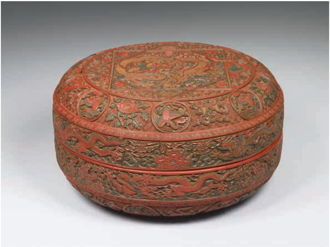
圖1 明 嘉靖 剔彩龍鳳紋盒 國立故宮博物院藏