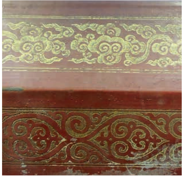
圖4-5 〈朱漆鎏金雲龍紋箱〉壘頂蓋側壁紋飾