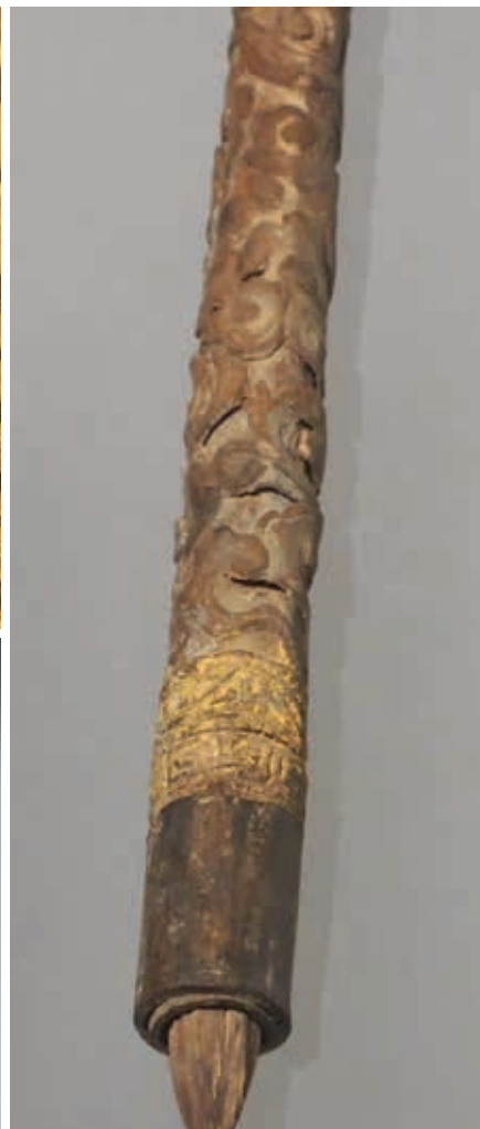
圖8 明初 剔黃卷雲紋筆管 局部紋飾 明朱檀墓出土 作者攝於2017年8月27日