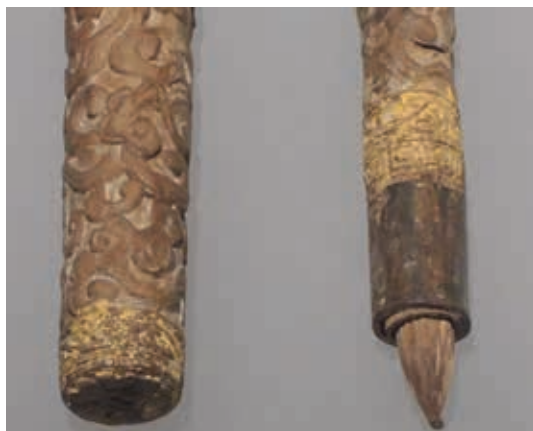
圖5-2 〈剔黃卷雲紋筆管（附筆套）〉局部