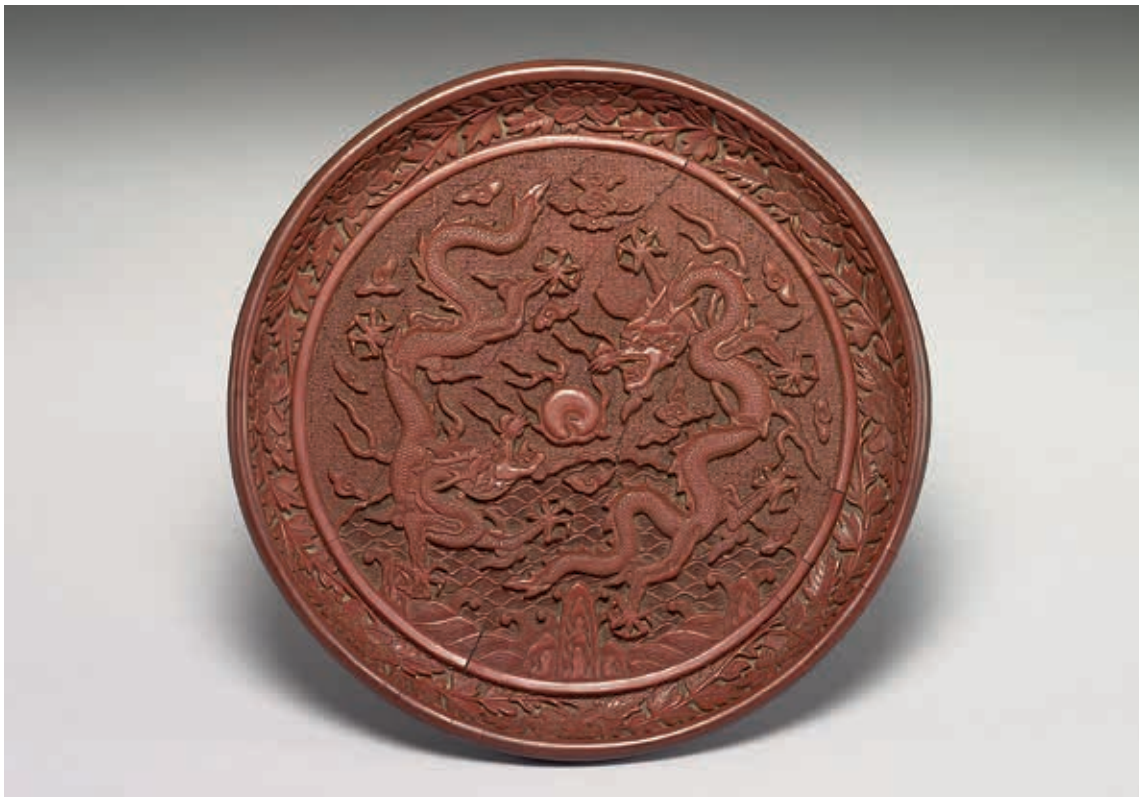
圖3 明 萬曆 剔紅雙龍戲珠紋盤 國立故宮博物院藏