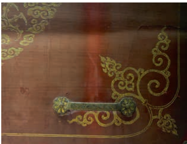
圖4-4 〈朱漆鎏金雲龍紋箱〉委角卷雲紋與金屬配件之吊扣 董宇攝於2018年6月25日