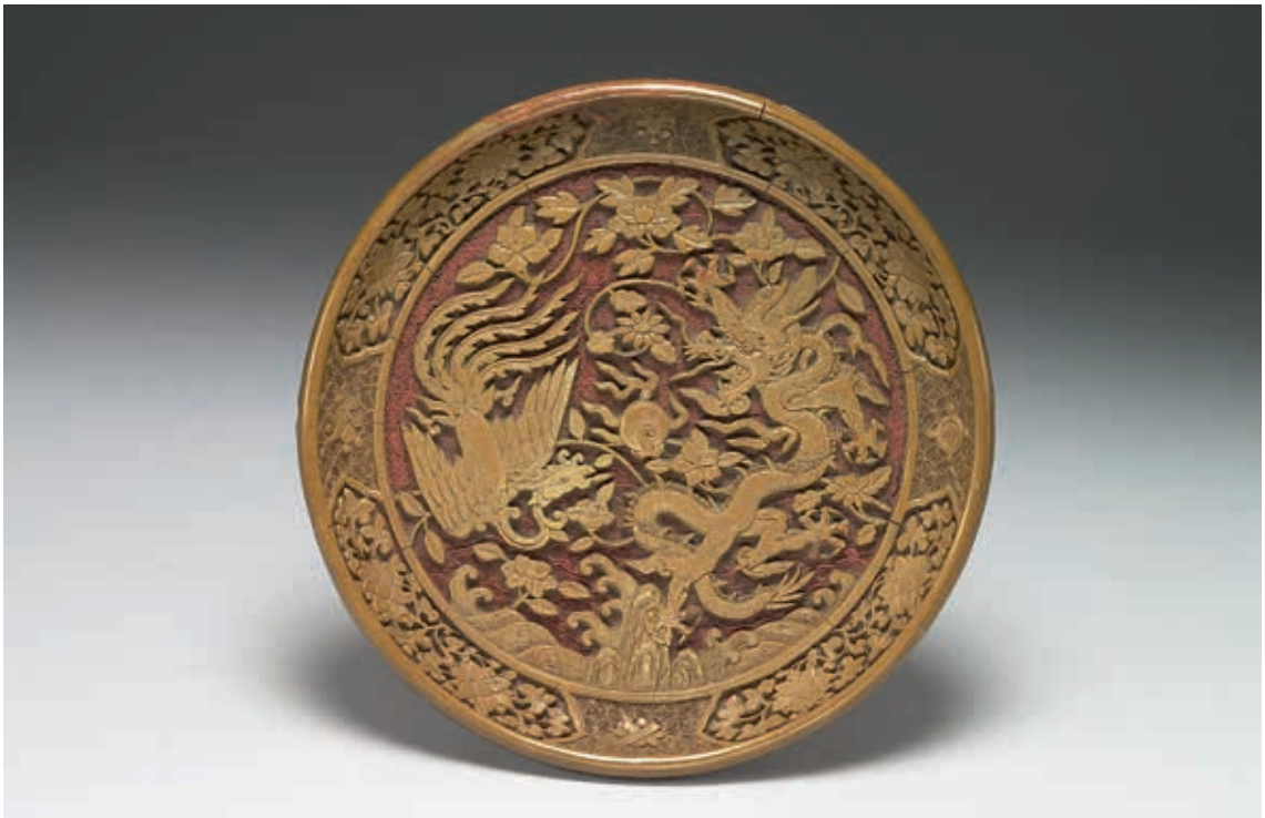
圖7-1 明 嘉靖 剔黃花卉龍鳳紋盤 國立故宮博物院藏

為「顯然是張德剛一派風格的作品」， 8 也就是漆層最少三十六道。 9 細審其腹部紋飾，花葉生動自然，尤其花瓣起伏有致，栩栩如生；不論花葉與枝幹的邊緣皆曾經仔細打磨，轉角圓潤，