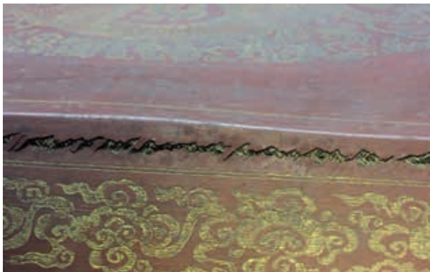
圖4-3 〈朱漆鎏金雲龍紋箱〉壘頂蓋之斜側面裂罅 作者攝於2017年8月27日