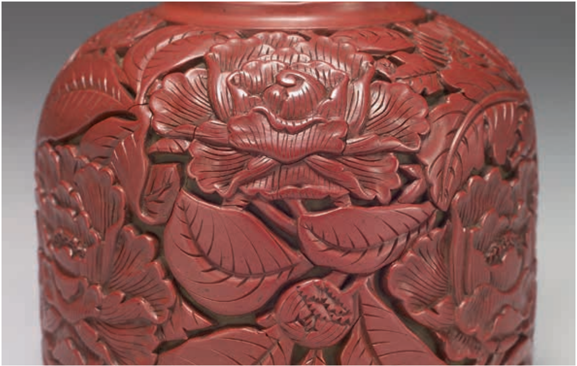
圖6-2 〈剔紅錐把瓶〉器腹局部