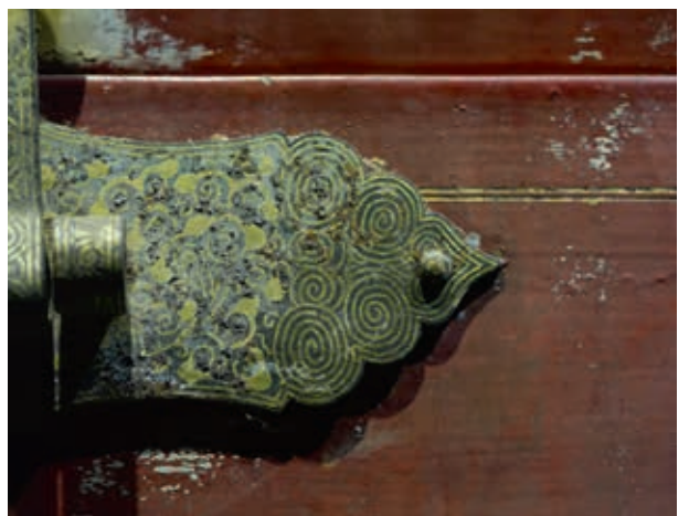
圖4-7 〈朱漆鎏金雲龍紋箱〉金屬配件之轉釦局部