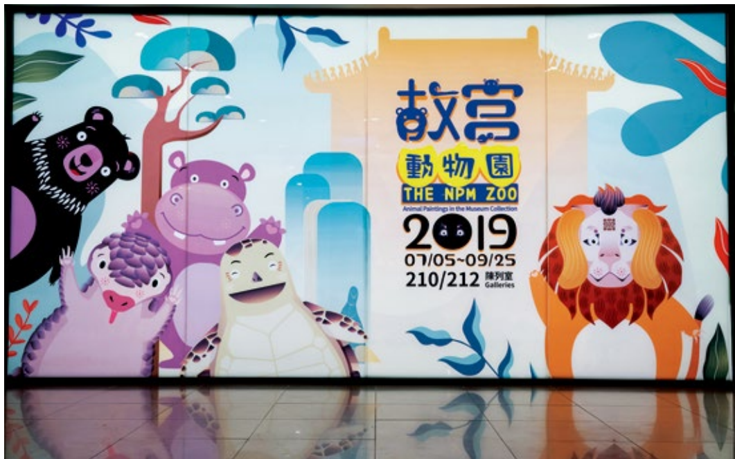
圖1 主視覺燈箱：正館展廳入口處主視覺燈箱設計，裡面Q版動物分別是浣猴（本院清劉九德〈畫浣猴圖〉）、穿山甲（臺北市立動物園代表）、河馬（新竹市立動物園代表）、臺灣黑熊（高雄壽山動物園代表）與綠蠵龜（國立海洋生物博物館代表）。