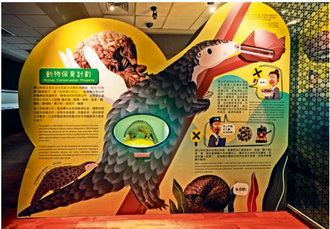
圖6 | 展廳：動物保育計劃區，以穿山甲為主題。