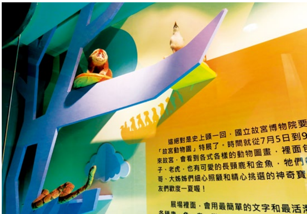
圖2 | 展廳入口：與臺北市立動物園商借之標本展示。

這些素材是參觀臺北市立動物園教育中心後，發現他們有相關資源可供展覽使用，加上展覽是設定給國小學童參觀，多感體驗會增進小朋友的印象和趣味，故如「點糞成金」（圖5）專區，就提供了觸覺（象皮與動物糞便紙觸摸）與嗅覺體驗（河馬與大象糞便紙聞聞看），順便帶出「資源再利用」的概念。另外值得一提的幾個部份是：一、大象糞便是本院同仁、展覽設計廠商與臺北市立動物園非洲區同仁花費力氣採集、洗清，再送地方手工紙廠製作；河馬糞便則是因為動物園有新的濾水設備，故收集起來相對較為簡單，展示動物糞便紙除了趣味外，同時也呈現了臺灣地方手工紙業製作成果。二、展示標本是為了讓觀眾了解動物的實際樣貌與大小，如懶猴、環尾狐猴可作現場對照。三、臺灣