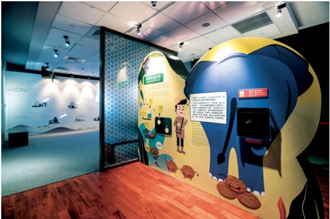
圖5 | 展廳：點黃成金計劃區，可供民眾觸摸橡皮、聞與摸動物糞便紙，藉此了解「資源再利用」的概念。