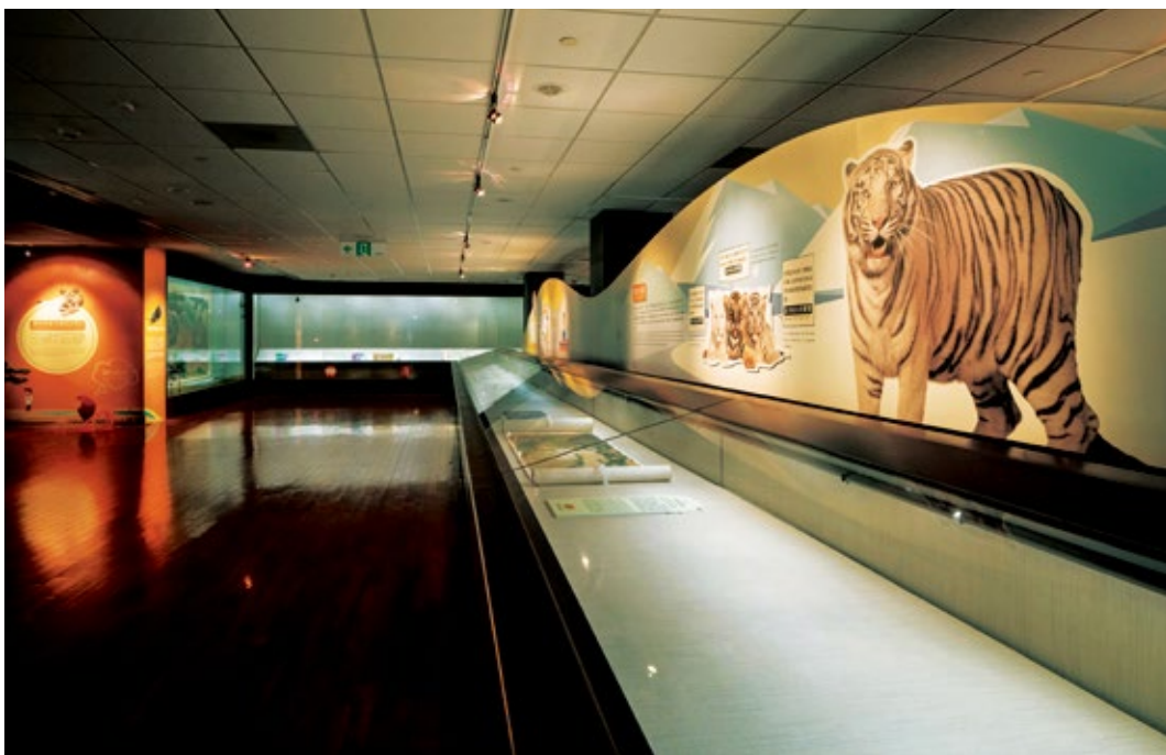
圖7 展廳：白老虎說明板，以本院明人〈內府驕虞圖〉與白老虎說明板互作呼應的展陳方式，在觀賞文物的同時亦推廣生物多樣性的概念。