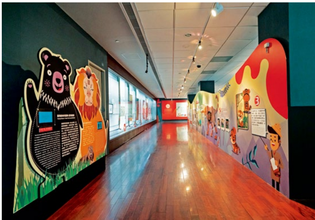
圖3 | 展廳一角：含壽山動物園暨本院影片與動物觀察員展示，此區搭配童趣的展版引導閱讀。