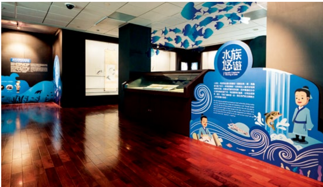
圖9 | 展廳：「水族悠遊」單元，展覽設計訴諸海洋保育重要性。

蠟龜救護)等。本展 212 展廳「水族悠遊」與導覽手冊提及的相關海洋生物知識與圖片，大部分為海生館提供。(圖9)因為這次的合作機緣，讓過去藝術史未能解決的海洋生物物種問題，於學術研究上有所突破和發現。該館吳耀如博士並首度配合本院書畫展覽，為青少年舉辦「古畫中的海洋生物」教育講座，都是雙方合作產生的新模式。