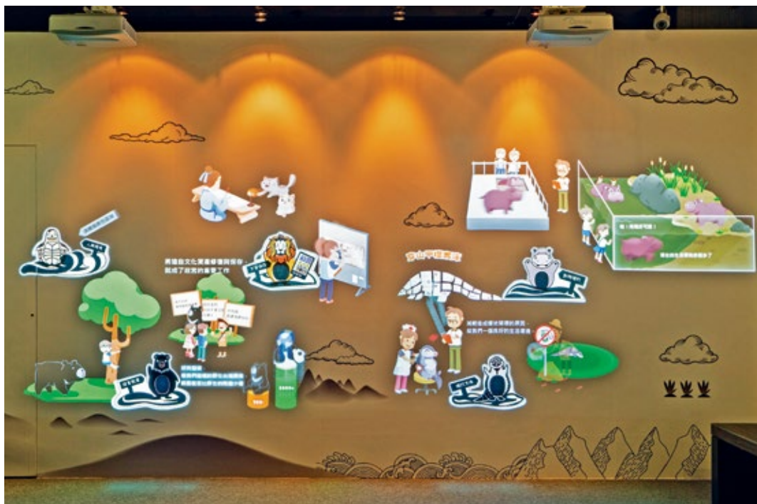
圖4 | 展廳：油電導墨互動區，認識文資保存、動物福利、人與環境等小概念。