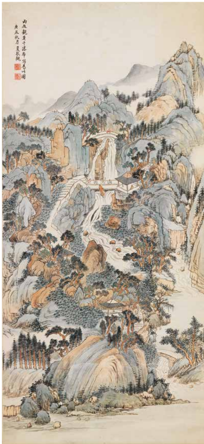
民國 夏敬觀 觀瀑圖 國立故宮博物院藏 竹影連山，標誌莫干山作為避暑勝地的特色。