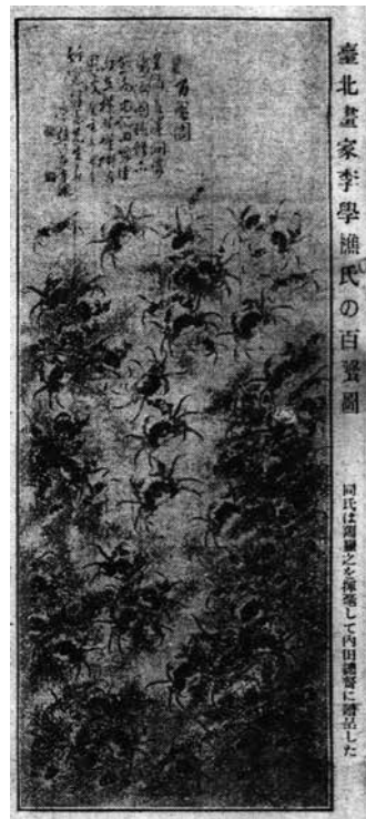
圖 7 李學樵 〈百蟹圖〉 1924 年 藏地不明