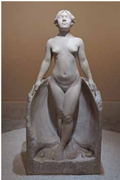
圖 6 黃土水 〈甘露水〉 大理石 1921 年 文化部藏