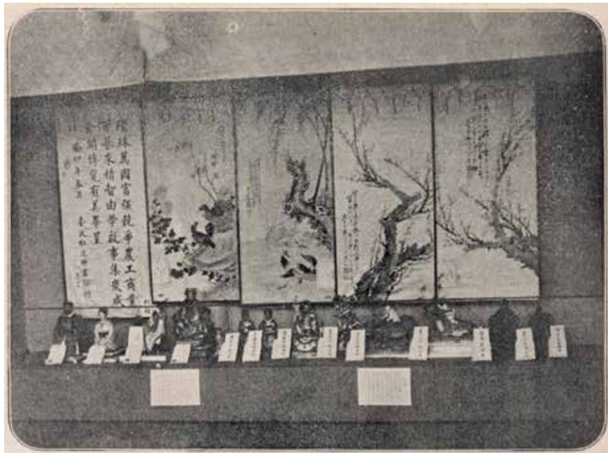
圖 1 1903 年第五回內國勸業博覽會臺灣館中展示的繪畫、雕塑與刺繡