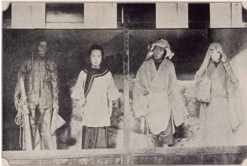
圖 5 1903 年第五回內國勸業博覽會臺灣館中展示的臺灣著裝標本（由右至左：女子喪服、男子喪服、粵族婦人的服裝、勞動者的服裝）