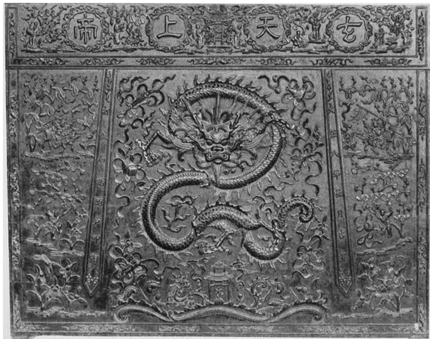
圖 2 陳瑞寶 〈臺南市北極殿異木鑲嵌桌〉 製作年不明 藏地不明