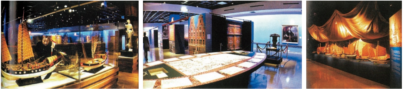
圖 1 2003 年「福爾摩沙：十七世紀的臺灣、荷蘭與東亞」特展展場 取自宋兆霖主編，《故宮院史留真》，臺北：國立故宮博物院，2013，頁 159，圖 582。

Museum of Denmark）以及荷蘭的博物館和公立收藏（除荷蘭國家博物館外，還包括了其他如荷蘭國家檔案館 Nationaal Archief, Netherlands、荷蘭國家圖書館 Koninklijke Bibliotheek, KB、阿姆斯特丹歷史博物館 Amsterdam Museum 等公立收藏總計共十六個機構）。在此展覽中，荷蘭國家博物館提供了三件藏品參加展覽：即十七世紀的無款〈福州圖〉（圖 2）、十八世紀的無款〈媽祖聖跡圖〉（圖 3-1、3-2）、以及紀年 1738 年張汝霖〈西洋人圖〉（圖 4）等。 1