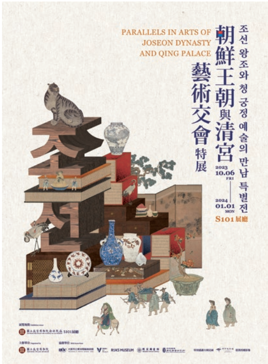
圖 15 2023 年國立故宮博物院南部院區「朝鮮王朝與清宮藝術交會特展」海報

描取得之信息，對象牙球進行 3D 建模和分層解析。確認故宮所藏的兩顆象牙球分別為 23 層與 18 層套球。此外，透過電腦斷層掃描技術，我們不僅能清楚知道象牙球究竟有幾層，更能看到每一層象牙球細膩的紋飾，甚至工匠製作象牙球時留下的痕跡都看得見，並且憑此推斷象牙球的製作方式，解開象牙球工藝技術的秘密。 4