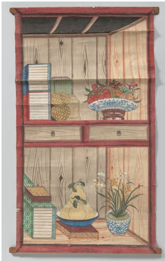
圖 17 1750 ~ 1800 年 飾有中國文物的壁紙 BK-NM-9776-D