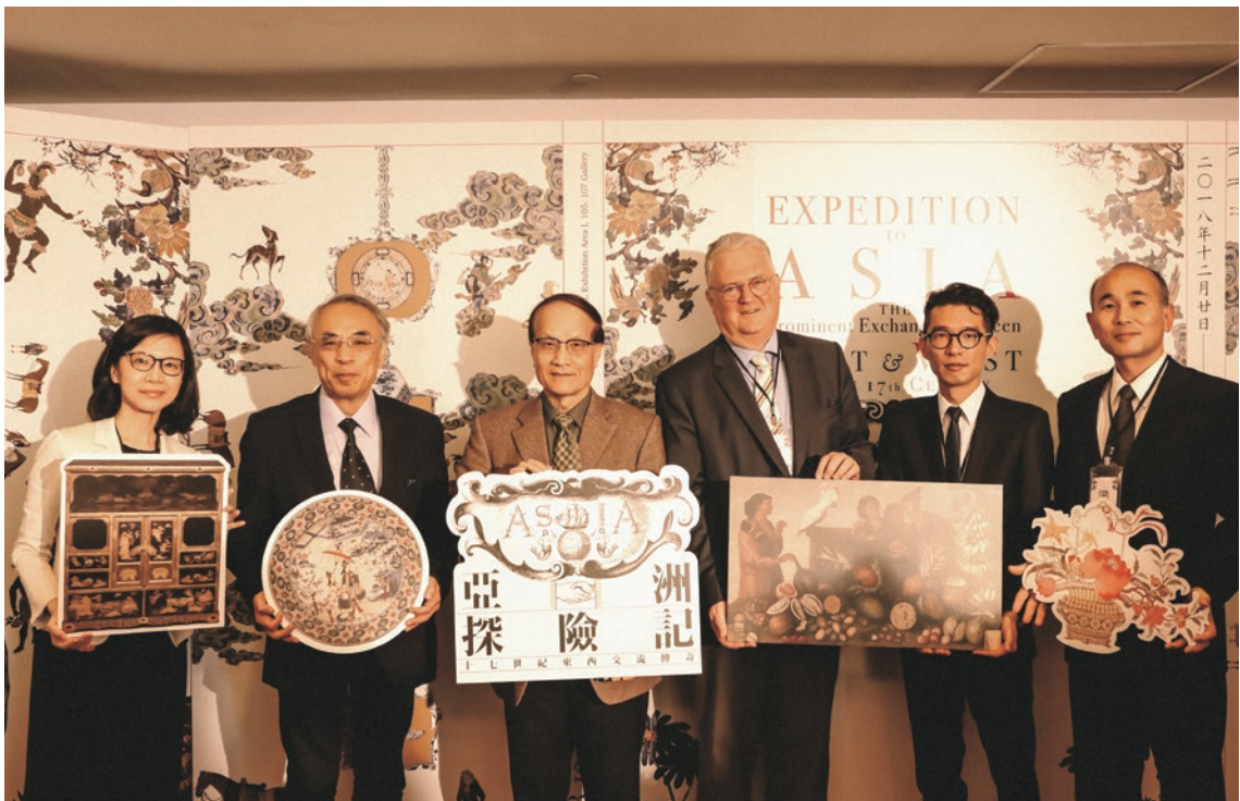
圖 6 「亞洲探險記——十七世紀東西交流傳奇」開幕記者會 國立故宮博物院與共同策劃合作博物館代表合影