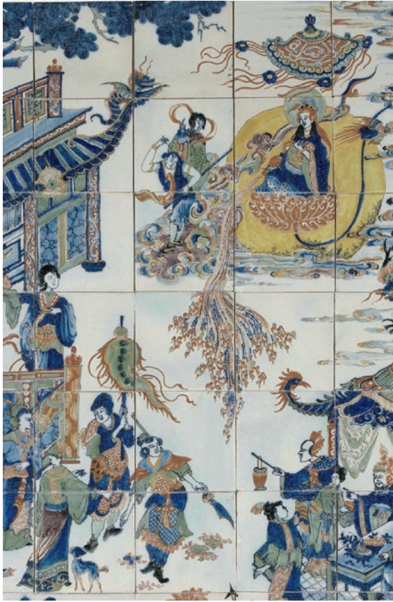
圖 9 荷蘭 約 1700 年 德爾夫特窯 青花釉上彩中國風與黑人紋飾壁磚局部 BK-NM-12400-443