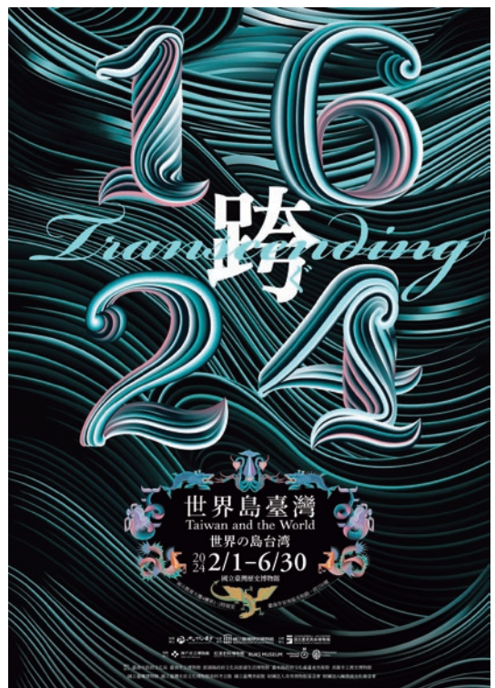
圖 21 國立臺灣歷史博物館「跨·1624：世界島臺灣國際特展」海報

一、展覽籌備時間。荷蘭國家博物館在展覽的籌備所需要的時間很長，以敝館的特別展為例，最短需要兩年的時間，有的甚至四到五年；臺灣的博物館有時籌備展覽的時間很短，就這點來說有的時候非常難配合。