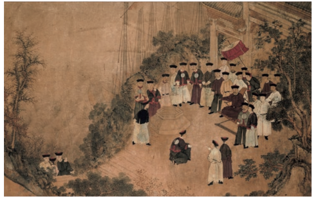
圖 3-2 18 世紀 無款 媽祖聖跡圖：湧泉給師 AK-RAK-1991-11-A

雖然該展已經逾二十年之久，但依舊有其在學術史上的一些指標性意義：首先，它是國立故宮博物院第一個以「臺灣」（非中國）為主體之特展：可以說是自 2000 年首次政黨輪替之後，國立故宮博物院較早跳脫以往「大中國」、「清宮」等過於單一之歷史論述框架的窠臼，而在策展上採用多元史觀的特展之一。其次，本展亦可視為故宮首次向國外博物館合作借展以充實特展內容之濫觴。然而可惜的是，國立故宮博物院與荷蘭國家博物館（或者說與荷蘭其他博物館的合作），在二十年前的「福爾摩沙展」之後，並再未有任何相關的合作，直到近年才重新開啓。