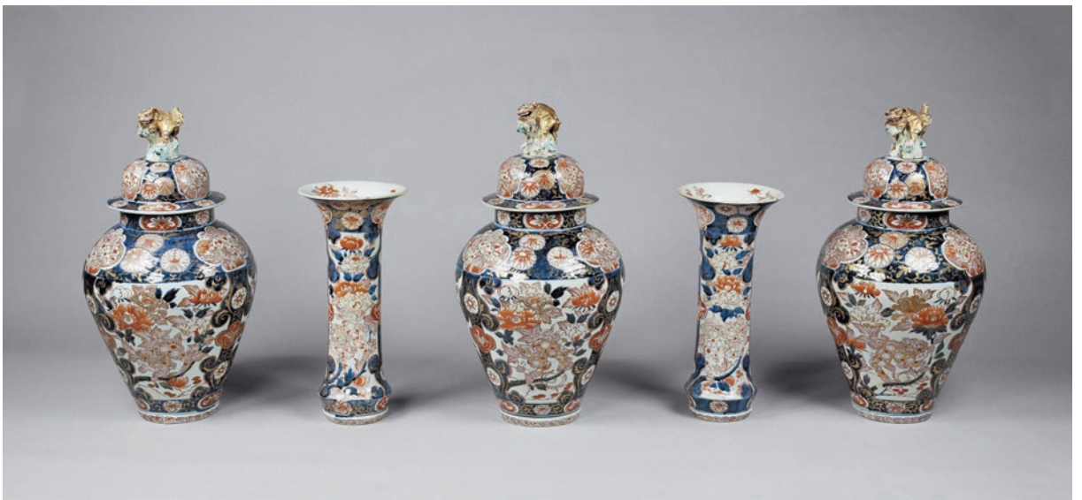
圖 10 日本 約 1775 ~ 約 1824 年 有田窯 青花釉上彩花卉紋瓶、罐五件組 AK-RBK-15621