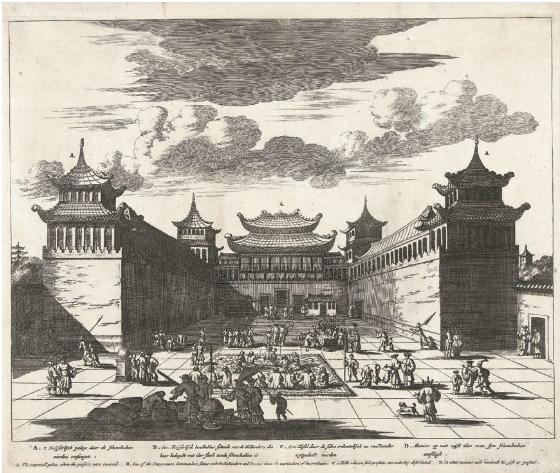
圖 7 荷蘭 1668 ~ 1670 年 中國皇帝接受來自荷蘭使節的禮物於紫禁城前 RP-P-1911-558