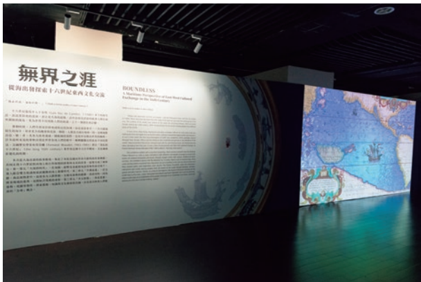
圖 19 「無界之涯：從海出發探索十六世紀東西文化交流」展場

號沈船出水遺物等計 11 件展件（圖 20），是自 2020 年起新冠疫情所造成的全球動盪和停滯之後，荷蘭國家博物館與國立故宮博物院的再次攜手合作。 6