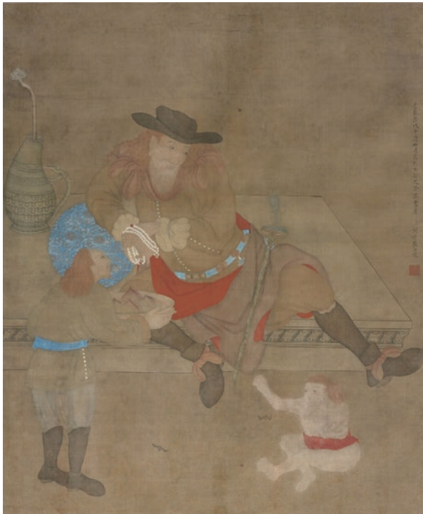
圖 4 1738 年 張汝霖 西洋人圖 © 荷蘭國家博物館藏 AK-MAK-1410