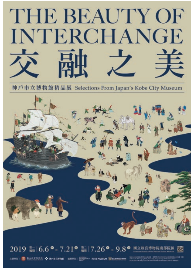
圖 11 2019 年國立故宮博物院南部院區「交融之美：神戶市立博物館精品展」海報