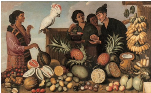
圖 8 荷蘭 約 1640 ~ 約 1666 年 安德里斯·貝克曼、(傳) 亞伯特·艾克豪特 巴達維亞的市集 SK-A-4070

歐洲玻璃、荷蘭為訂製中國瓷器所設計繪製的圖稿、荷蘭德爾夫特窯場製作的中國風磁磚畫、陶器以及其模仿日本及中國的產品、日本柿右衛門及伊萬里瓷器、伊斯蘭做克拉克瓷、以及中國景德鎮生產之貿易瓷與考古出土遺物等，計 35 件（圖 7 ~ 10）。 2 該展累計約 90 萬參觀人次。