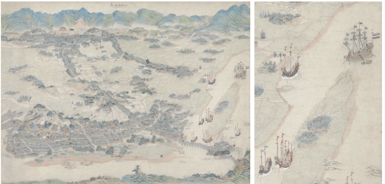
圖 2 17 世紀 無款 福州圖 NG-1988-13