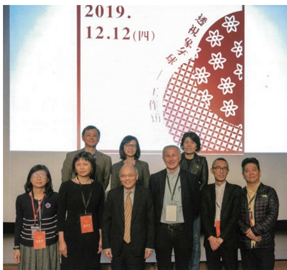
圖 14 2019 年「透視象牙球工作坊」學者合照 取自胡愷文整理，〈「透視象牙球工作坊」紀要〉，《故宮文物月刊》，444 期，2020 年 3 月，頁 76。

件西洋銅版畫（圖 12），以及一件荷蘭德爾夫特窯場生產的磁磚畫（圖 13）。 3 同年國立故宮博物院舉辦「透視象牙球工作坊」，發表荷蘭國家博物館及荷蘭數學和計算機科學研究院（Centrum Wiskunde & Informatica Amsterdam，以下簡稱 CWI）與國立故宮博物院結合數位科技於人文研究的最新合作成果（圖 14）。荷蘭國家博物館及 CWI 與國立故宮博物院合作，在研究團隊的努力下，逐步以電腦斷層掃描結合影像重建的數位科技，解開象牙球各層樣貌之謎。該研究計畫由國立故宮博物院對其院藏的兩顆象牙球進行電腦斷層掃描，荷蘭國家博物館與 CWI 接著就電腦斷層掃