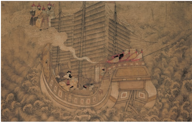
圖 3-1 18 世紀 無款 媽祖聖跡圖：拖夢護舟 © 荷蘭國家博物館藏 AK-RAK-1991-11-C