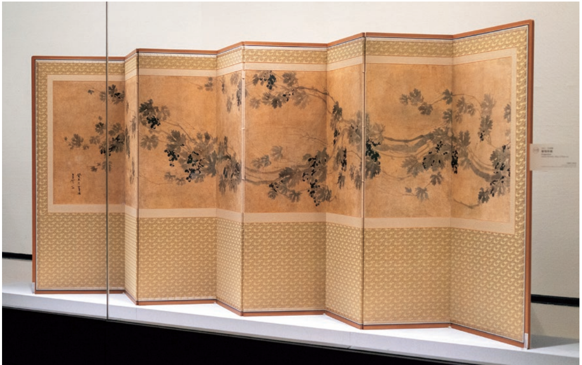
圖 16 朝鮮 1823 年 吳南運 葡萄屏風 荷蘭國家博物館藏 AK-RAK-2016-4 國立故宮博物院提供

2023 年國立故宮博物院南部院區的「朝鮮王朝與清宮藝術交會特展」（圖 15）中，荷蘭國家博物館借展其館藏一件韓國墨葡萄屏風（圖 16）和一件中國的冊架圖壁紙（圖 17）。 5 其中展出之冊架圖壁紙，係該作品修復後的首次展出。同年荷蘭國家博物館也參與了國立故宮博物院的「無界之涯：從海出發探索十六世紀東西文化交流」展（圖 18、19），為該展提供了包含中國外銷瓷，以及紀年 1613 年東印度公司白獅