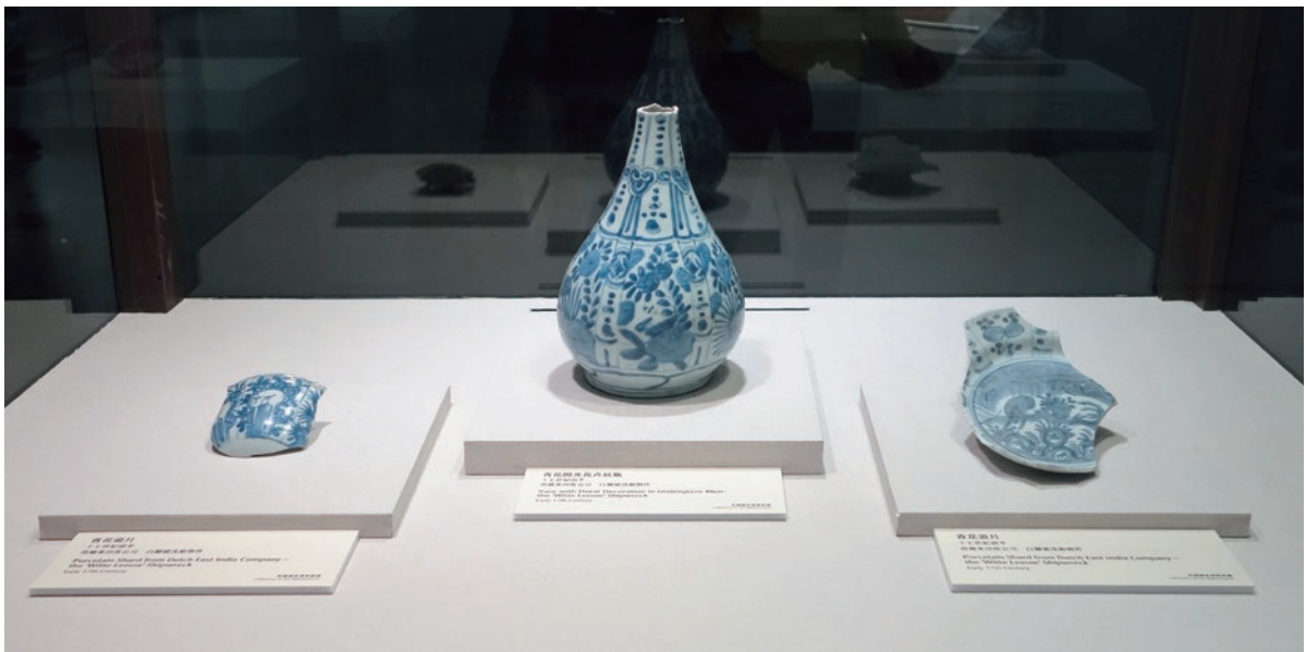
圖 20 「無界之涯：從海出發探索十六世紀東西文化交流」展 荷蘭東印度公司白獅號沉船物件 荷蘭國家博物館藏