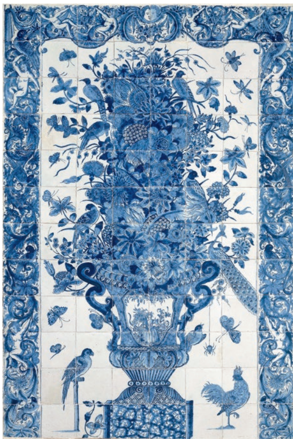
圖 13 約 1725 年 花器台維夫磁磚 © 荷蘭國家博物館藏 BK-NM-4638

件西洋銅版畫（圖 12），以及一件荷蘭德爾夫特窯場生產的磁磚畫（圖 13）。 3 同年國立故宮博物院舉辦「透視象牙球工作坊」，發表荷蘭國家博物館及荷蘭數學和計算機科學研究院（Centrum Wiskunde & Informatica Amsterdam，以下簡稱 CWI）與國立故宮博物院結合數位科技於人文研究的最新合作成果（圖 14）。荷蘭國家博物館及 CWI 與國立故宮博物院合作，在研究團隊的努力下，逐步以電腦斷層掃描結合影像重建的數位科技，解開象牙球各層樣貌之謎。該研究計畫由國立故宮博物院對其院藏的兩顆象牙球進行電腦斷層掃描，荷蘭國家博物館與 CWI 接著就電腦斷層掃