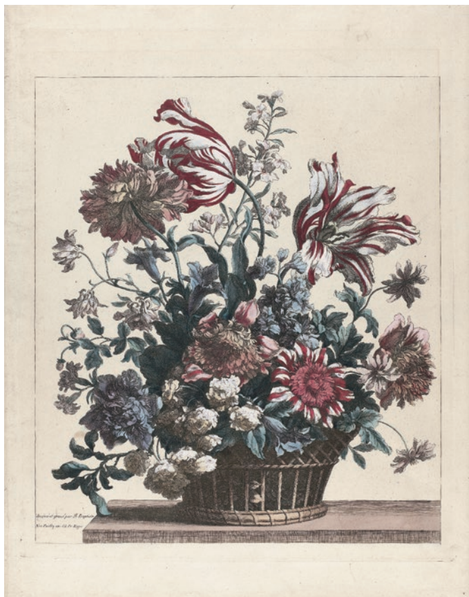
圖 12 1646 ~ 1699 年 曼諾尹 籃花圖 RP-P-OB-63.317