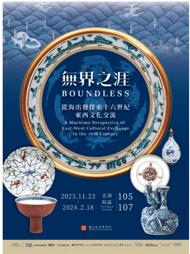
圖 18 2023 年「無界之涯：從海出發探索十六世紀東西文化交流」展海報