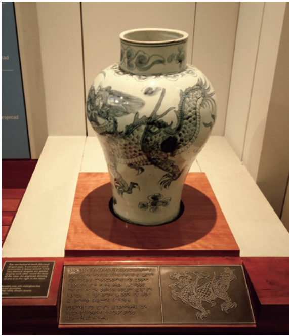
圖8 V&A 美術館以典藏真品搭配點字說明及浮凸的龍紋紋飾提供觸覺體驗 作者攝