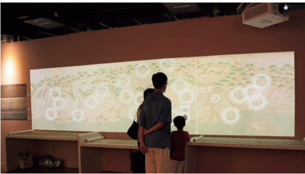
圖 5 「臺灣意象」展中的乾隆臺灣地圖互動展件