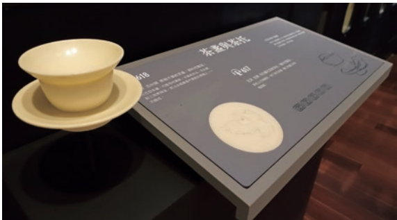
圖9 故宮南院常設展廳的觸摸物件

構、博物館與原住民社群，重新解構、詮釋清代歷史檔案中有關臺灣原住民（圖 10）與清代公主之敘事，並因此與在地的教育機構、原住民社群、觀眾建立全新的關係。 8