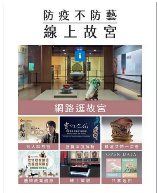
圖 11 博物館在疫情中提供各類線上資源，持續服務觀眾。

(圖12)，包括成立「永續發展工作小組」、於官網設立專區公開相關資訊，並盤點日常業務中之溫室氣體排放及逐步實踐節能減碳等。 13 在氣候與環境變遷日趨嚴峻的此時此刻，故宮身