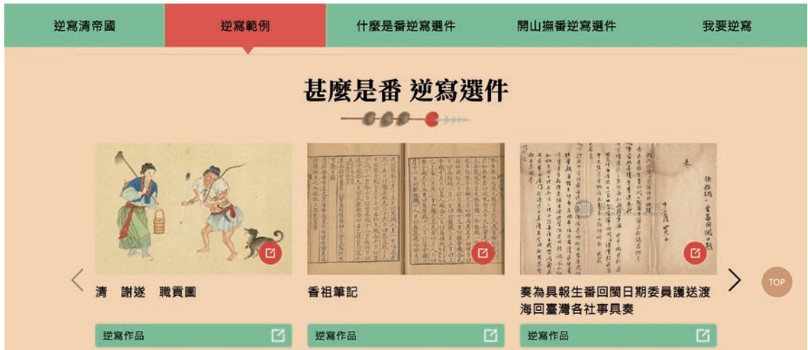
圖 10 「逆寫」清宮史料