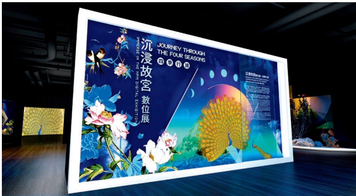
圖 3 「沉浸故宮數位展——四季行旅」