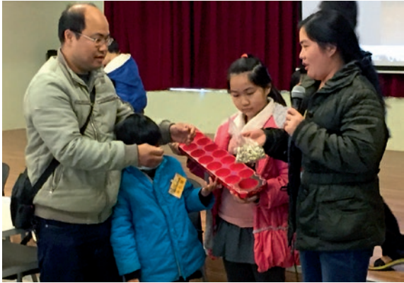
圖7 新住民在本院教育活動擔任分享者與教學者，與學員分享家鄉的傳統童玩。