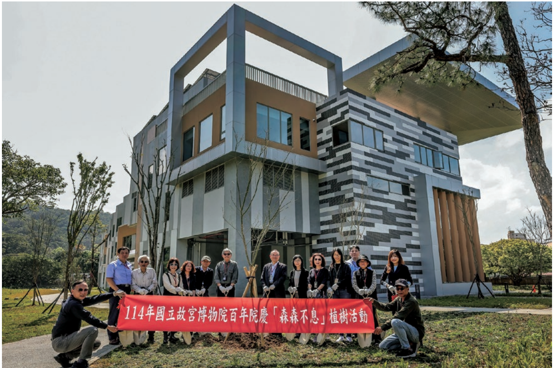
圖 12 故宮響應植樹減碳活動 取自《國立故宮博物院》臉書粉絲專頁： https://www.facebook.com/photo/?fbid=1122068109961825&set=pcb.1122087566626546&locale=zh_TW ，檢索日期：2025 年 3 月 19 日。