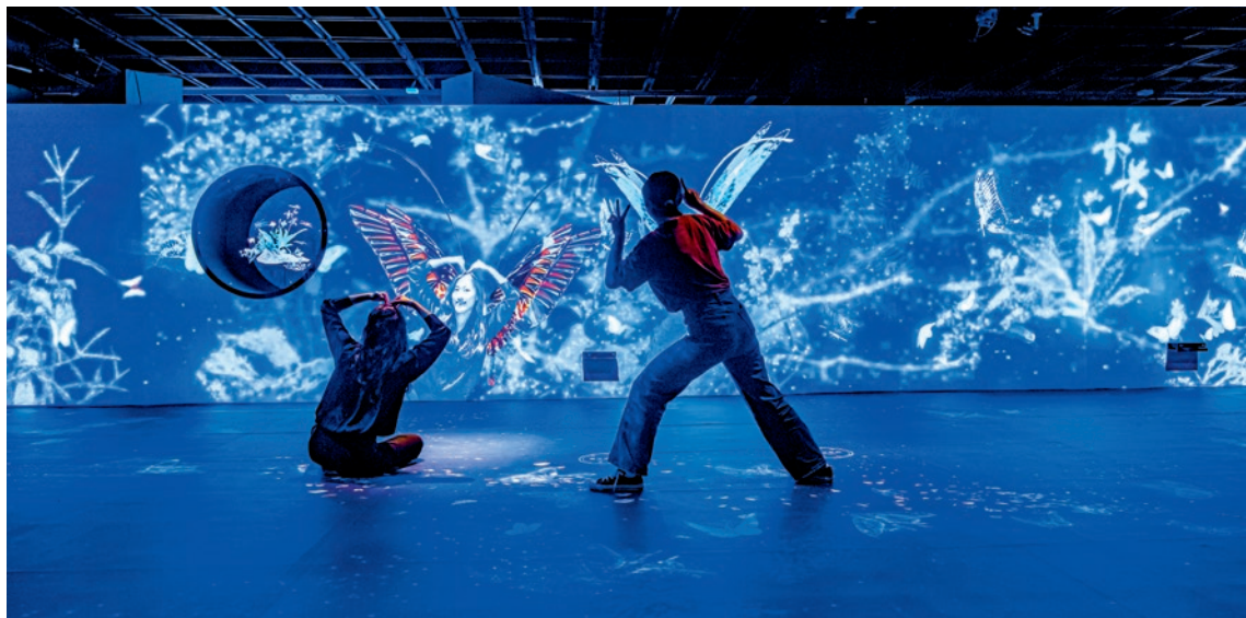
圖 2 鼓勵拍照共享的「故宮魔幻山水歷險展」

地方歷史；與博物館社群合作以數位展覽呈現「臺灣意象」（圖 5）；或藉由網路傳播，與「宅文化」，亦即網路動漫文化對話（圖 6），以發展新的觀眾參觀經驗並開拓觀眾群體；及呼應時下「聲音經濟」（Voice Economy）之盛行，