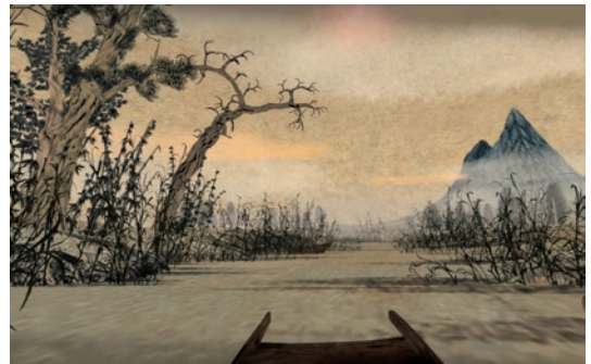
圖 1 以 VR 體驗《鵲華秋色》中遊河的畫面

而故宮運用新興科技與各類網路平臺、社群媒體的實踐案例，則可見於月刊刊載的其他多篇文章。例如故宮南院小編撰寫的網路社群經營實務探討，陳述故宮如何利用網路落實文化平權，並藉社群開拓觀眾群體。而各項新媒體科技的運用，包括以「虛擬實境」（Virtual Reality, VR）（圖 1）與「擴增實境」（Augmented Reality, AR）創造虛實整合的參觀經驗與美學；