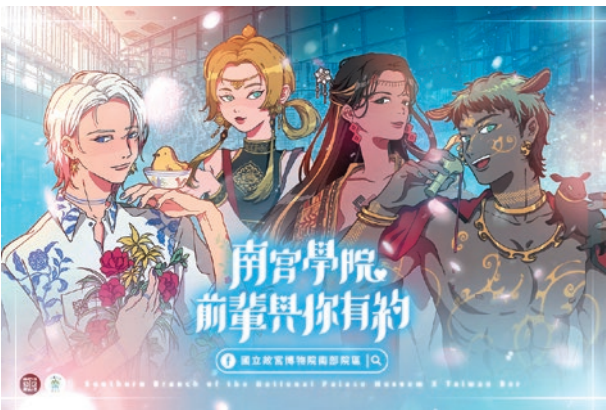
圖 6 南宮學院角色人物

利用快速成長的 Podcast（播客）數位載體傳播博物館資訊，大幅增加觸及範圍的努力等。 5 以上所舉僅為部分案例之討論，但已足以顯示故宮積極運用新科技及社群媒體，並藉新興網路平臺邁入動漫文化、聲音傳播等嶄新領域，