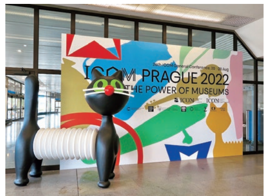
圖 2 2022 年 ICOM 布拉格大會 會場一隅 葉家好攝 取自【博物之島新訊】2022 ICOM 布拉格大會現場報導》，《中華民國博物館協會》，2022 年 8 月 25 日： https://www.tmaroc.org.tw/2022news8/ ，檢索日期：2025 年 4 月 9 日。