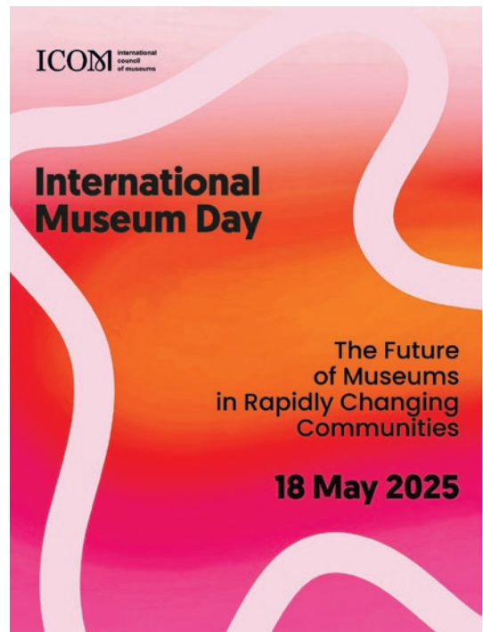
圖 1 國際博物館日 2025 年主題海報

2015 年，聯合國公告《翻轉世界：2030 年永續發展議程》(Transforming our world: the 2030 Agenda for Sustainable Development) 8 文件，提出