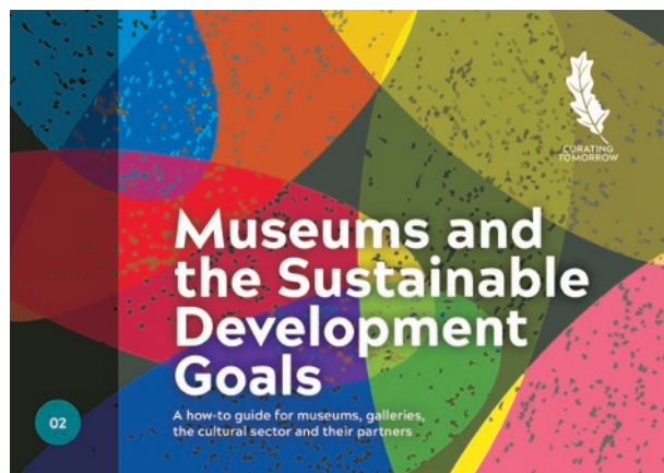
圖 3 《博物館與 SDGs：GLAM 指南》封面 取自 McGhie, H. A., Museums and the Sustainable Development Goals: A how-to guide for museums, galleries, the cultural sector and their partners . Liverpool: Curating Tomorrow, 2019. Accessed April 9, 2025. https://reurl.cc/yRv94l .

體且可衡量的行動目標。最後，透過擬定與自身使命最為契合的永續承諾，包括：具體行動計畫、融入日常實務、明確目標設定與定期成果報告，館所不僅可有效追蹤進展，亦能與利害關係人建立持續溝通與信任，展現其於永續發展中的貢獻與責任。再者，這些主張適用於所有國家，更強調「不遺漏任何人」(No one will be left behind) 的原則，以及永續目標之間的相互關聯和不可分割性。