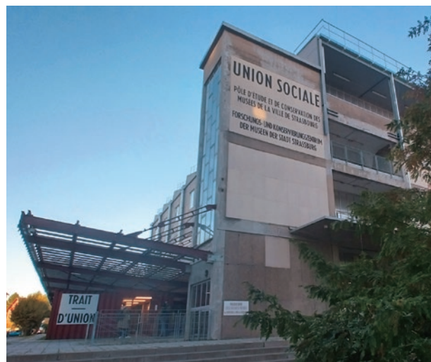
圖6 法國斯特拉斯堡市立博物館群的研究與保存中心建築物一隅 陳怡蓁提供

回到2025 IMD的主題，旨在透過無形文化資產、年輕力量、新興科技等三個子題，探索當今社會與博物館共同面對瞬息萬變的大環境。此時，博物館不再只是單純的保存空間，而是轉化成為形塑永續、理解包容的積極行動者。依ICOM的主題說明，冀以博物館能夠透過「創造就業機會和提供教育計畫來支持當地經濟」，並「藉由培養創造力和運用新興技術，推動創新並提高近用性」，以及「作為文化中心，促進包容性、韌性和文化資產保存，為城市的永續發展做出貢獻」，與SDG8就業與經濟成長、SDG9永續工業與基礎建設及SDG11永續城鄉的重點一致。