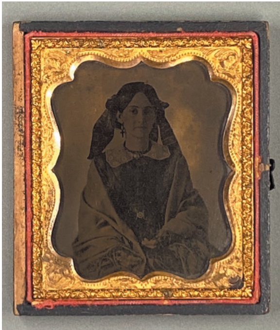
圖 1 西式盒裝玻璃濕版照片