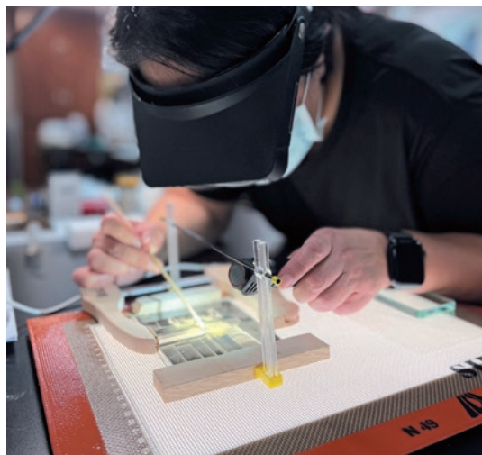
圖7 玻璃底片修復演練

自二十世紀以來，保存修復逐漸發展為獨立職業與學科，修復師需具備材料理解、劣化診斷、技術執行與倫理判斷等多重能力。1928