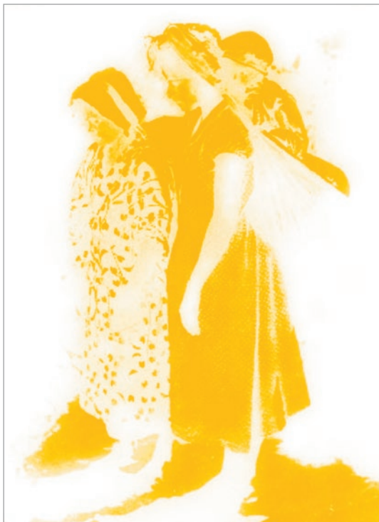
c. 蒔金粉：根據不同黏性程度的膠體獲得金粉影像