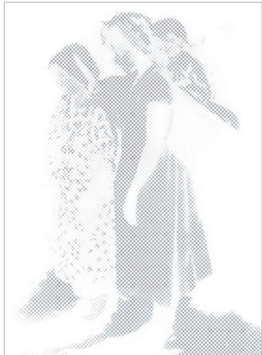
b. 放相曝光：根據影像階調獲得不同硬化程度的膠體