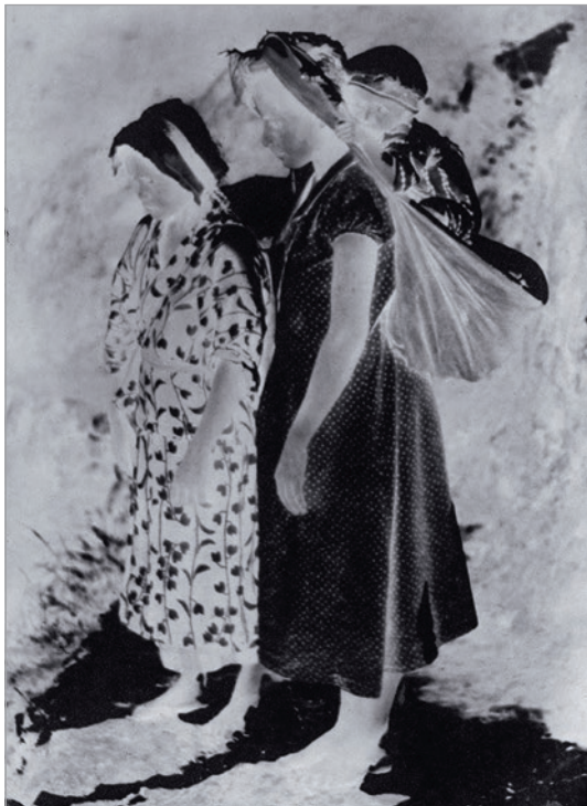
a. 實景拍攝：獲得底片