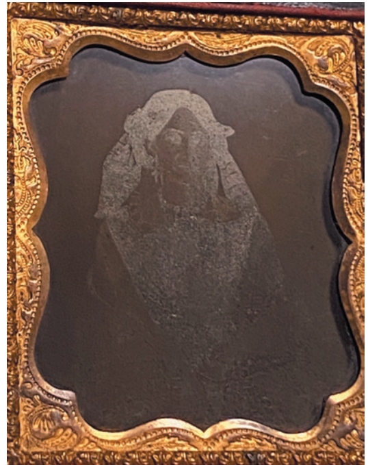
圖 2 改變光線角度可呈現底片影像 私人藏 © 作者提供