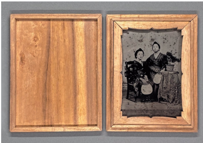
圖 3 日式盒裝玻璃濕版照片 私人藏