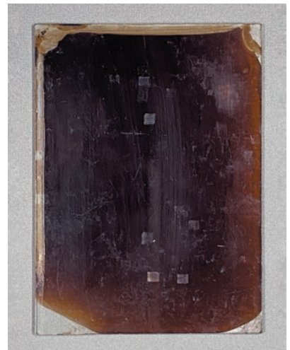
圖 4 影像背後髹漆 私人藏

膠膠體為硬化，仍具有黏性、吸水性與膨脹性，此時結合漆藝中蒔金粉技法，即可獲得金色衣服的影像。再將火棉膠溶液（Collodion）布滿玻璃上的影像面，以固定金粉，待乾燥後分離膠膜進