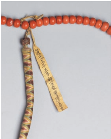
圖5 清 道光3年 珊瑚數珠 拴黃簽 局部 國立故宮博物院藏 故雜 005121