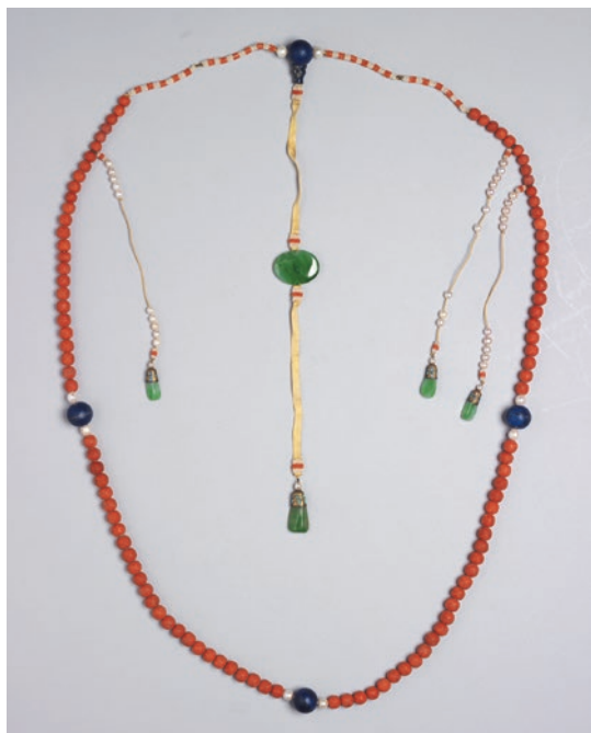
圖1 清 珊瑚朝珠 國立故宮博物院藏 故雜 001787

飾，精潔清雅（圖2），少數拴有小紙片——即黃簽，可追索其物主（圖3）。另有一類被稱為數珠實仍為原物料性質的文物，一般僅以大小一致的半寶石珠串成一掛，少數有黃簽者，