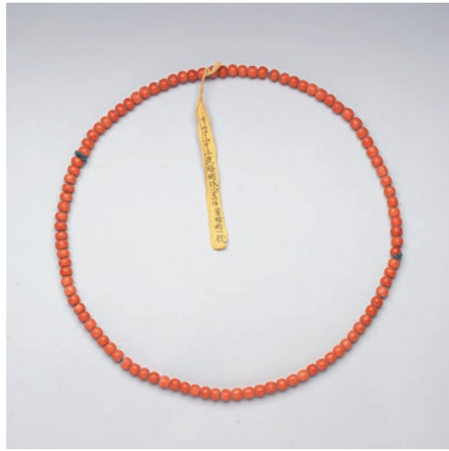
圖4 清 珊瑚數珠 拴黃簽 國立故宮博物院藏 故雜 005181