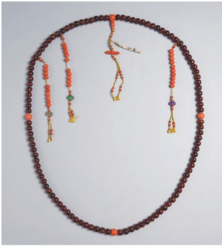
圖3 清 蜜蠟念珠 拴「聖祖」(康熙帝)黃簽 國立故宮博物院藏 故雜 001012