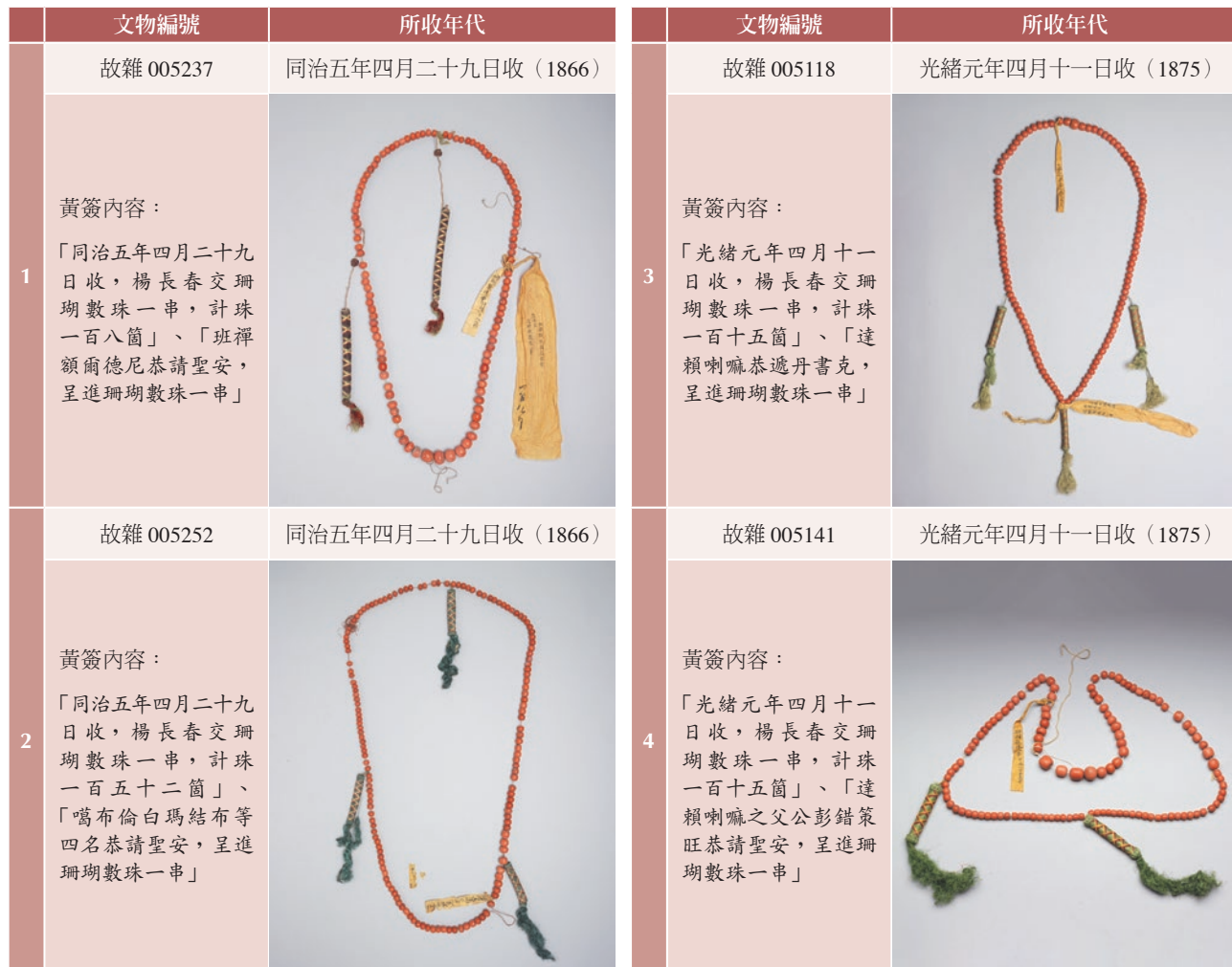
表一 本院藏半寶石數珠與進貢者

此四十三掛半寶石數珠，藉著共伴的清宮黃簽，可知其多為晚清五十年間之同治、光緒年間所進，進一步比對歷史文獻、清宮奏摺與《內務府題本》等紀錄，透露除了前、後藏賀正的年班，還有賀皇帝登極、慈禧（1835-1908）壽辰等十多趟年班、專差特貢。進貢者主要為