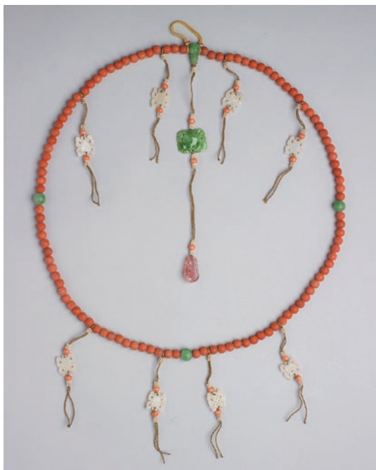
圖2 清 珊瑚念珠 國立故宮博物院藏 故雜 000903