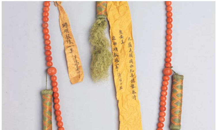
圖6 清 光緒7年 珊瑚數珠 拴黃簽 國立故宮博物院藏 故雜 005150

可大分為兩類，一類經清宮整理後挑揀大小較一致者串成，多有秤重紀錄（圖4）；另一類，多有三串菱格紋長絲穗，有註記收入宮中時間（圖5）或紀錄進貢者黃簽，少數收入時間與進貢者黃簽皆存（圖6）。院藏此類因伴有黃簽可追索進貢者的半寶石類數珠，以珊瑚為大宗，間有蜜蠟，共有四十三掛，皆為清代西藏僧俗所貢。